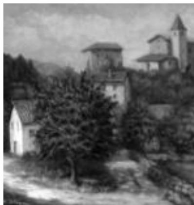
Idiazabal. Mihisetik urruntzen zoazen heinean zehatzagoak dira koadroak. Hurbilduz gero, margo multzo bat besterik ez da ikusten. N. URBIZU