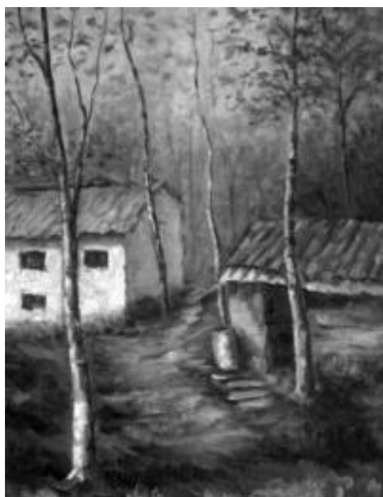
Baserriak, zuhaitzak. Naturako paisaiak dira Alegiako jubilatuen tabernan ikus daitezkeenak. Ez da pertsonarik ikusten. Miren Ortegak kalean margotzen du, egin behar duena aurrean duela, hain zuzen. Horregatik, koadro batzuetan haizeak eragindako mugimendua nabaritzen erraza da. N. URBIZU