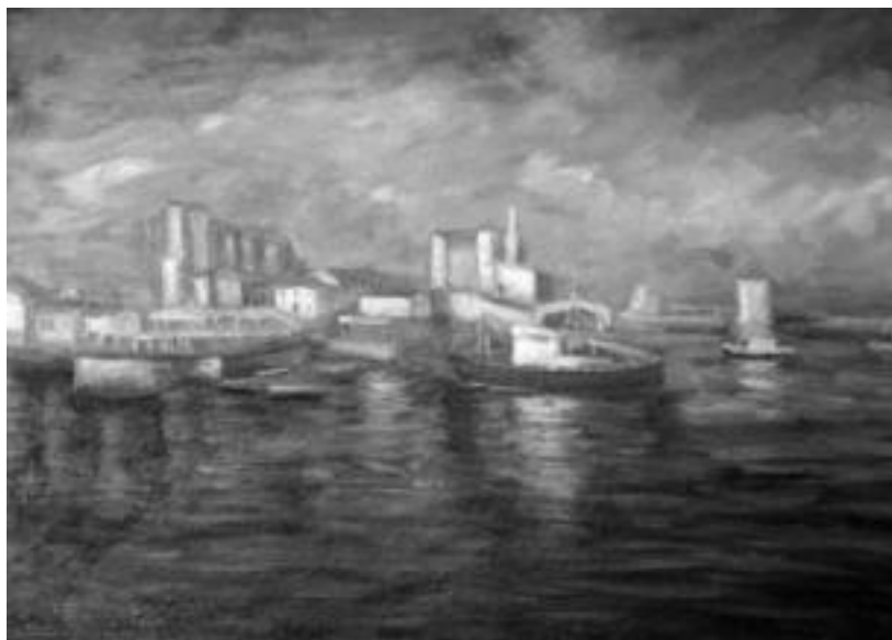
Castro-Urdiales. Miren Ortegaren bi margolanetan ikus daitezke kostaldeko paisaiak, Alegiako erakusketan beti ere. Inpresionismoaren ezaugarriak argi asko ikus daitezke koadro honetan. N. URBIZU