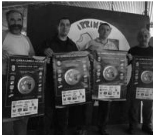
Irrintzi elkartearen zenbait kide Garagardo Azokaren kartelarekin. i. g.

Garagardo Azoka bihar hasiko bada ere, aste gutzian dabil-tza antolatzaileak lanean. Irrintzi txirindularitzari lotutako elkartearen denez, Frantziako