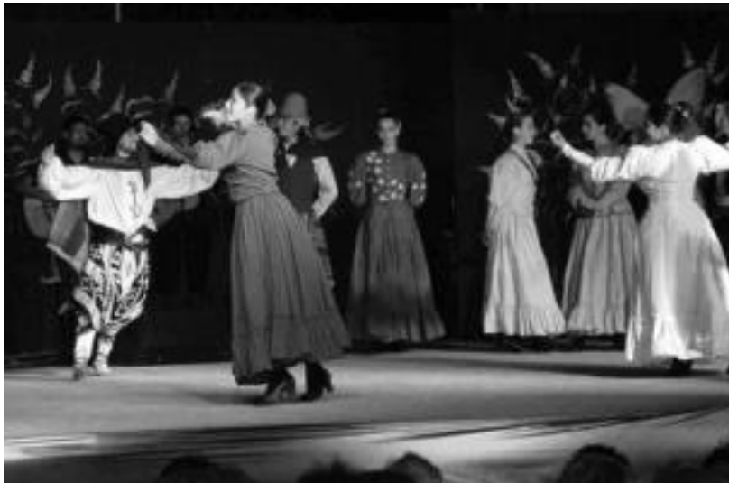
El Gran Ballet Argentino Euskal Herria plazan emanaldia eskainiko du, hil honen 27an. HITZA

Asteburu honetan hasi eta irailera bitarte, sei emanaldi antolatu ditu Tolosako Udalak; guztiak 22:30ean izango dira