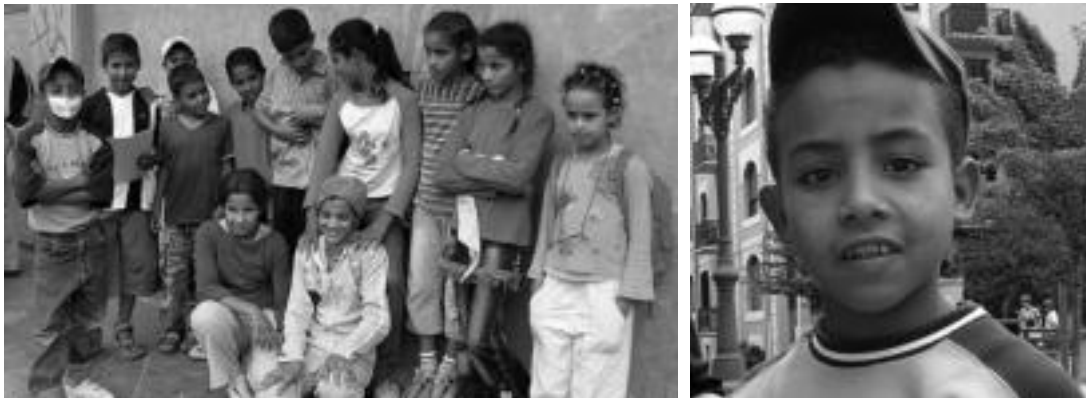
Hamabost saharar etorri dira aurten Tolosaldera uztaila eta abuztua bertan igarotzera. Batzuentzat estreinako aldia izan da. I. TERRADILLOS

15 saharar gaztetxo etorri dira uztaila eta abuztua eskuadean igarotzera