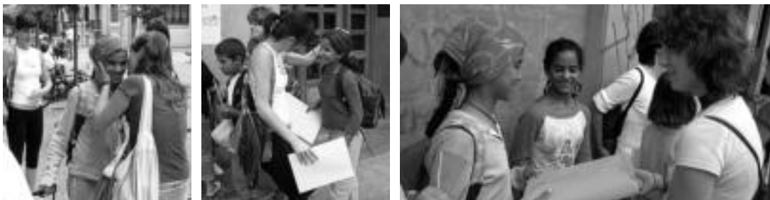
Harrera beroa egin zieten errefuxiatuen kanpamentuetatik etorritako saharar gaztetxoei. Opariak ere jaso zituzten. I. TERRADILLOS