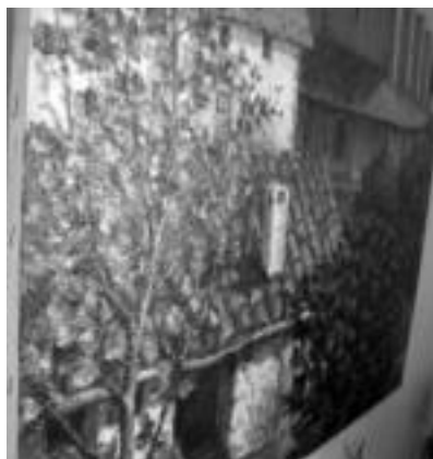
Beasaingo eliza. Badirudi leihoetik begiratu eta utzi daitezkeen hostoak direla. Pintzeladek margo asko jartzen dute mihisean. N. URBIZU