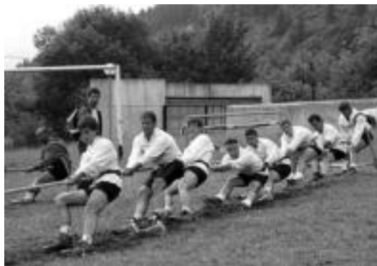
Areso taldea lanean, Gaztelun jokatu zen jardunaldian.

Laukiztarrekin lehiatutako saioak gerorako eragina utzi zioten: «Gaztedirekin txukun hasi ginen: presioa ikaragarria zen, baina sokak gure aldera egiten zuten. Baina ez ginen baliu, presioari ezin etsia etorri zitzaigun eta haiek horretaz ohartu zirenean, indar kolpe gogorak jo zituzten eta guk ez ginen erantzuten asmatu», azaldu zuten aresoarrek. Le-