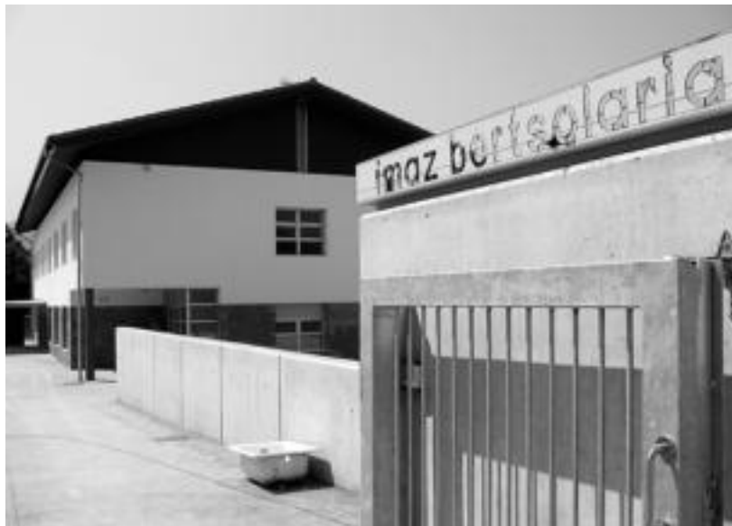
Imaz Bertsolaría Eskola berria Santa Barbara eta frontoiaren artean eraiki dute. N. URBIZU