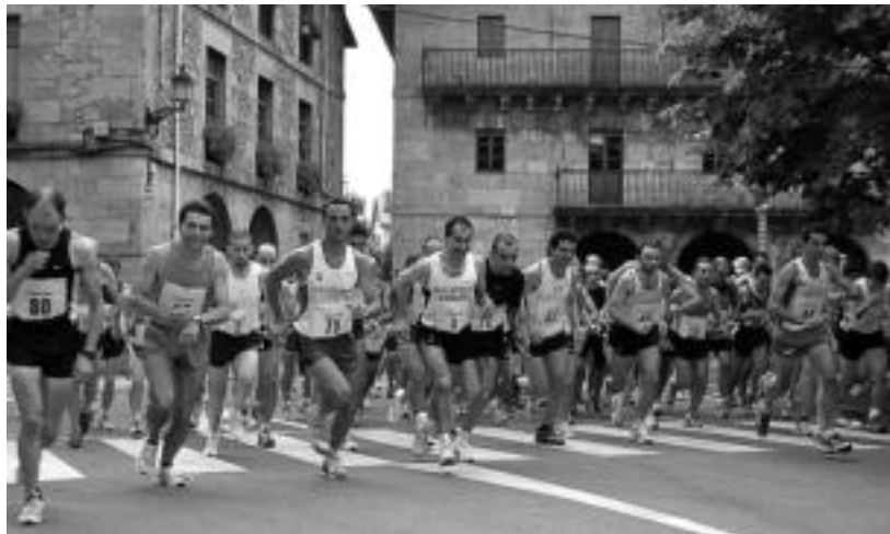
Hasiera. Asteasuko plazatik abiatu ziren korrikalariak, zazpi kilometroko ibilbidea egiteko. Denera, 89 lagunek eman zuten izena, eta denek amaitu zuten lasterketa. MADDI SOROA

teko asmoa bazuen ere, baso inguruko bidea oinez egin behar izan zuen.