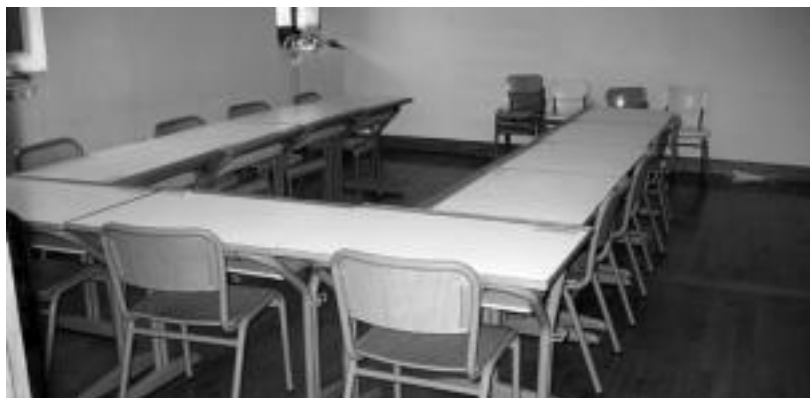
Udaletxe lokal batzuetan hartu dituzte eskolak hilabete batzuetan. N. URBIZU

Herriko ikasleak udaletxe azpian egon dira aurten klaseak jasotzen