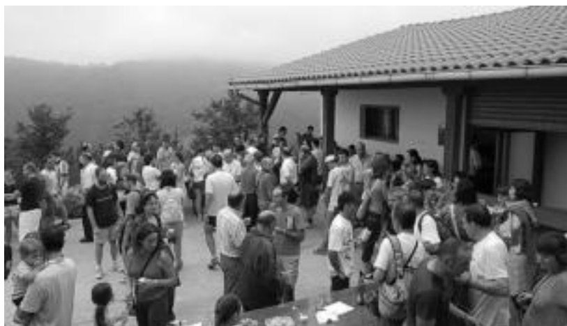
Hamaiketakoa. Lasterketaren ondoren, Santamañan bertan parte-hartzaileen artean sariak zozketatu zituzten, eta hamaiketakoa ere eskaini zuten. MADDI SOROA