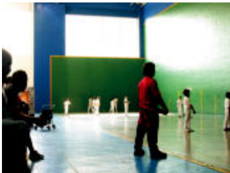
Ikusle asko izan ziren, gurasoak gehienak. Adiskidetasuna ez zen jokalarien artekoa bakarrik izan. n. URBIZU