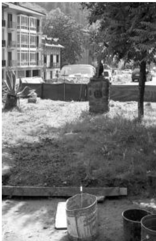
Kanpoaldea. Udari begira urtero txukuntzen dute lorategia. J. G.