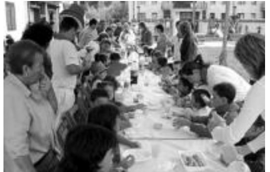
Gurasok eta gazteek afari-merienda egin zuten txikientzat. HITZA