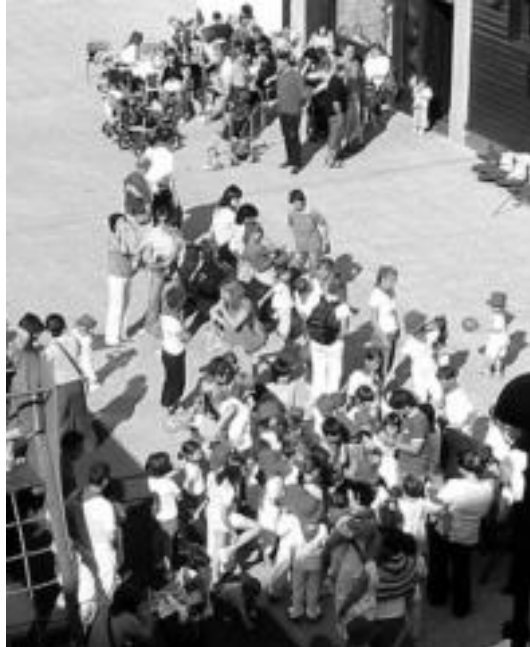
Umeek jolasak izan zituzten egunean zehar, parke inguruan. HITZA

Ume mordoa bildu zen parke inguruan, guraso gazteek gogotsu prestatutako festa inguruan. Txupinazoak eman zuten festarako seinalea, entzierroa egin zuten, eta ondoren ume jolasak, eta txikientzako afari-merienda. Ondorengo afarian 100 bat lagun bildu ziren. Haien baliabideekin egindako festa arrakastatsua izan zen, beraz. Afalostean ere, musika jarri zuten dantzatzeko eta kaleko giro onaz gozatzeko.