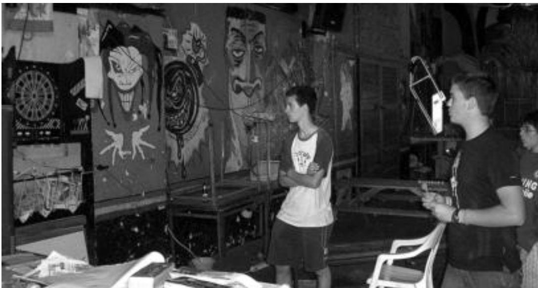
Kontzentratuta. Dardotan jokatzeko aukera ere bada. Argazkiko bi gazteek, behintzat, maila altua dutela erakutsi zuten. J. GOIKOETXEA