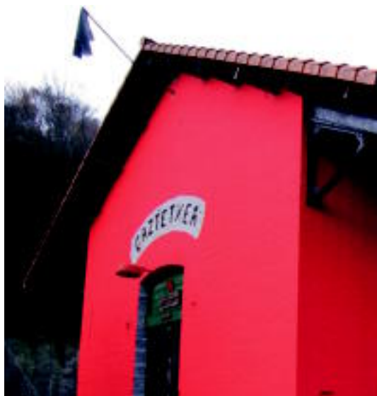
RENFEren lehengo biltegian aurkitzen da Alegiako Gaztetxea. N. URBIZU

FESTAK ▶ Ohiko egitarauaz gain, berrikuntzak ere prestatzen ari dira aurtengo herriko jaietarako ▶ 6-7