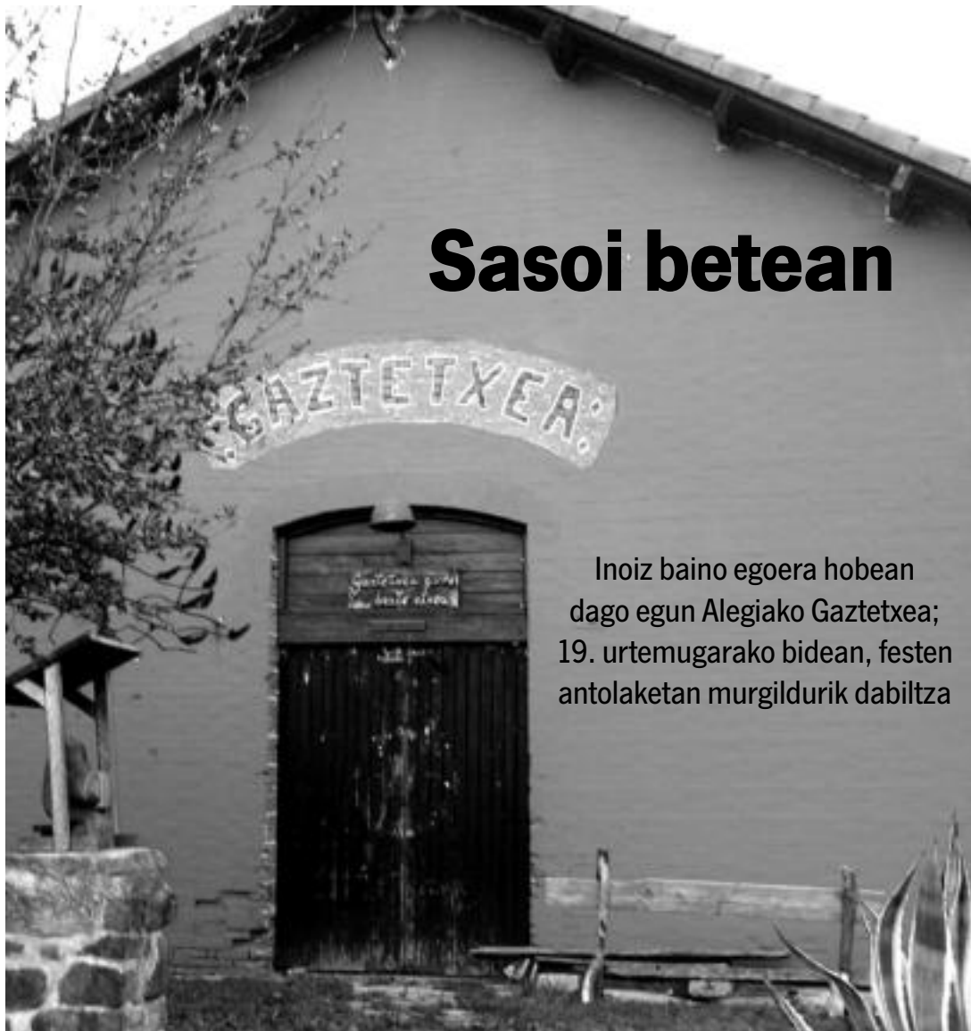
Itxura berria. Duela gutxi margotu dute kanpotik Gaztetxea, eta argazkian ikusten den itxura du orain. J. G.