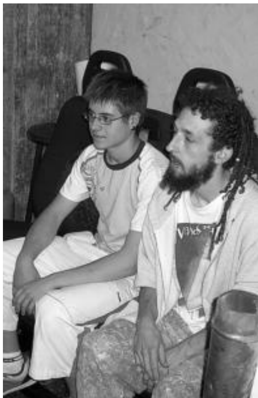
Aisia. Bi gazte film bat ikusten Gaztetxean. J. G.

Beraz, Alegiako Gaztetxean aurrera jarraitzeko ilusioa eta gogoia badagoela, behintzat, argi geratu da. Hala, jaien ondoren ere ez dute denborarik galduko, eta abenduan izango den XIX. urtemugaren prestaketa lanetan hasiko dira gazteak buru-belarri, aurrekoak bezala oparoa izatea nahiko dutelako.