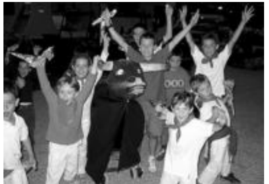
Iurramendiko txikiek zezenarekin entzierroa egin zuten. HITZA