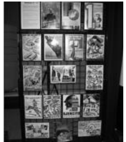
Esloganak. Irudietan, garai haiei deklarazioez, eta argazkiz gain, II. Errepublikako esloganak ere bildu dituzte. Hauek propaganda gisa-eta erabiltzen zituzten kartelak dira. E. EZEIZA