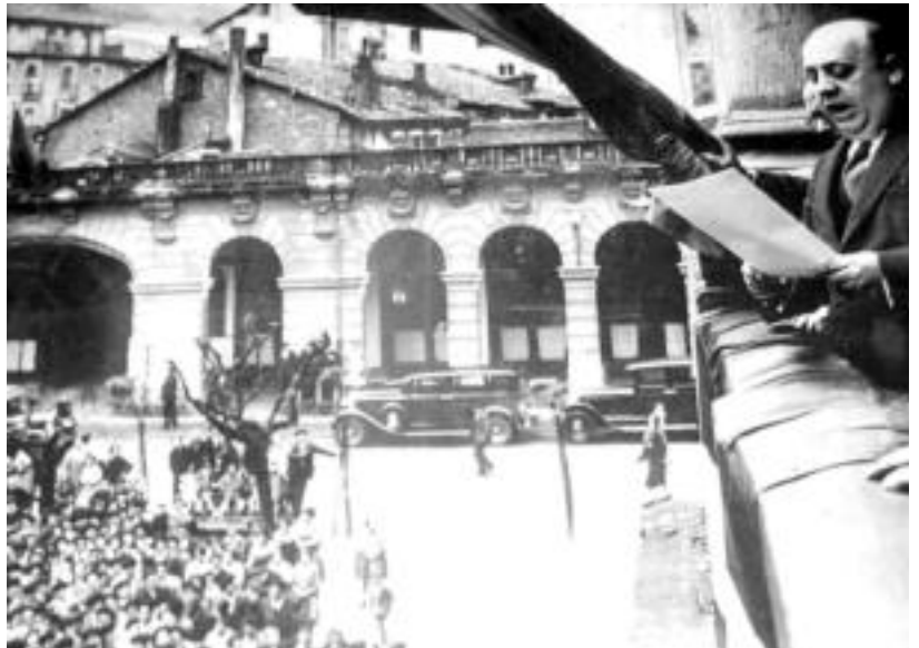
Eibar. 1931an, Eibarren, Indalecio Prietok Untzagako enparantzian udaletxeko balkoitik hitzaldi bat eskaini zuen, Errepublikaren hasiera aldarrikatuz.