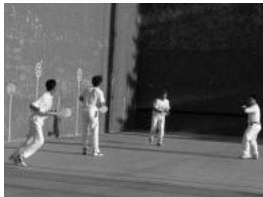
Guztira, 14 bikotek hartuko dute parte; argazkian, iaz partida bat. J. S.

Gaurkoan ere zaletuek izango dute zer ikusia Berazubikoan; izan ere, bi neurketa izango dira jokoan. Lehenengoan, 19:00etan hasiko dena, Zabaleta eta Urdañapilleta jokalariek osatutako bikotea Galarraga eta Landa izango dituzte aurrez aurre. Bigarrenean, berriaz, Lontxo eta Nabazal Imaz eta Garmendiaren aurka ariko