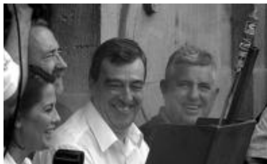
Eskubi —erdikoa— atzo txupinazoa botatzen.

Hemen ere pasadizo zelebra gertatu zen, ordea, txupinazoa lehertzerako, zinego-