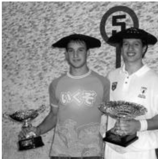
Renobales eta Belloso txapelkun izan ziren 2004an.

Kadeteak, gazteak eta senior mailakoak izango dira eskuz banakako partida guztiak jokatzeko, 21:00etatik aurrera