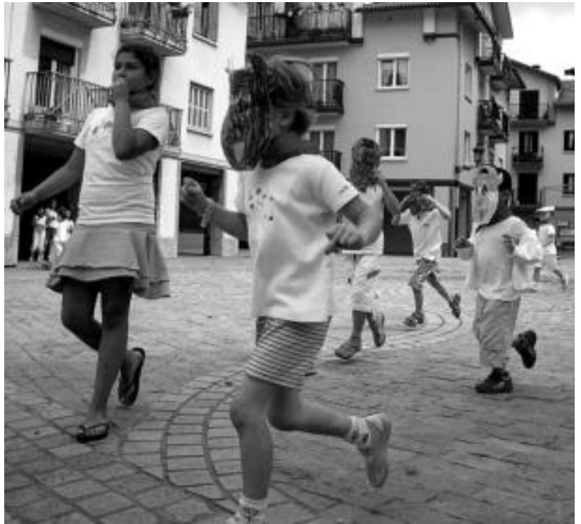
Entzierroa irudikatu zuten atzo eguerdian Irurako plazan herriko haurrek. I. GARCIA

Atzokoa egun berezia izan zen, San Fermin festak oinarri hartuta txupinazoa bota baitzuten udaletxeko balkoitik. Gero txikiak goizean zehar egindako zezen maskara jarri eta entzierroa egin zuten zaharagoen atzetik. Azkenik, Gaztelekuko taldeak maskuriarekin aritu ziren txikiak harraipaten.