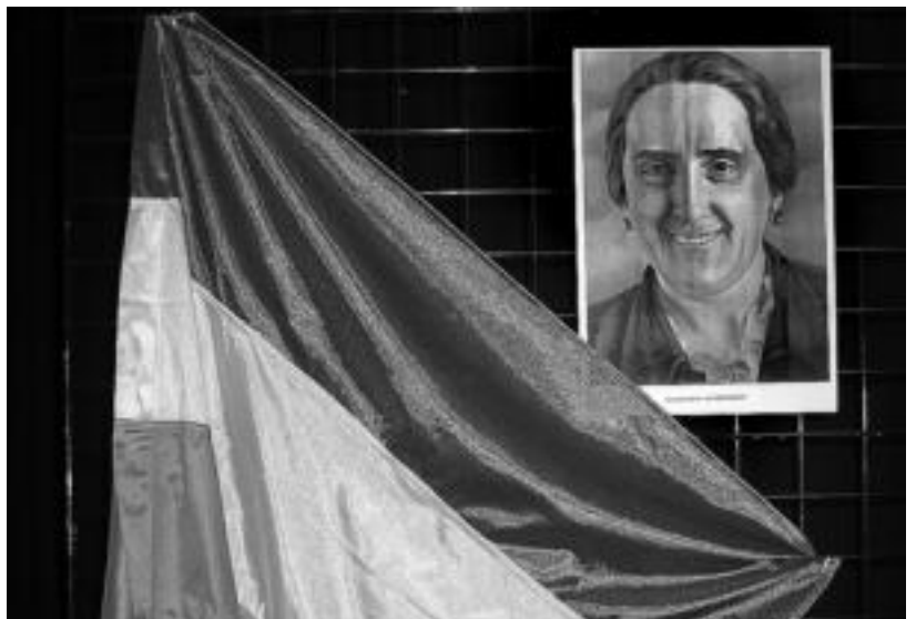
Emakumeak. Erakusketa honetan omenaldi bat egin nahi izan diete emakumeei, hauek lan handia egin baituzten garai haiei. Hala, bereziki, Dolores Ibarruriri leku berezi bat egin diote erakusketan. Errepublikarrentzat erreferente izan baita, emakume eta gerlari gisa.