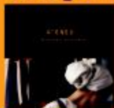
Aloratu Ane Alorzu