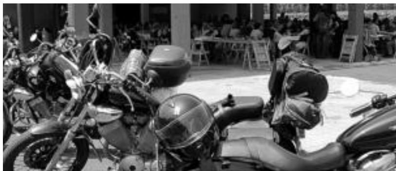
290 motozale bildu ziren iragan igandean egin zuten bazkarira. MADDI SOROA

Gipuzkoarren eta emakumezkoen kopuruak gora egin duela azpimarratu dute; irailean beste ekitaldi bat egingo dute