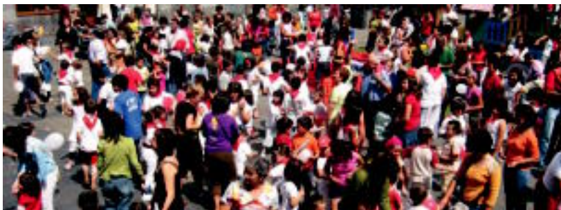
Erruz bete zen Plaza Berria atzo; adi-adi jarraitu zuten gaztetxoek buruhandien irteera.

Suziriarekin batera lehertu zen festa. «Ez baduzue kantatzen ez dira buruhandiak aterako!», jakinarazi zieten haurrei megafoniatik. «A San Fermin pedimos...» eskaria oso-osorik abestu eta korrika alde egin zuten denek, maskurietatik ihesi. Goiz-pasa polita igaro zuten Plaza Berrira joandakoek. Arratsaldean jarraitu zuten festak eta gaur, besteak beste, entzierrero txikia korritzeko aukera izango dute.