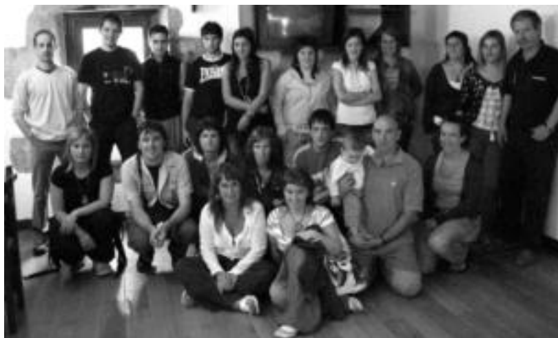
Aurrera elkarteko zuzendaritzako eta batzordeetako kideak, asteazkenean bilera egin aurretik. JAIONE ASTIBIA

Baina ez dira bakarrik ariko lan horretan. Izan ere, orain