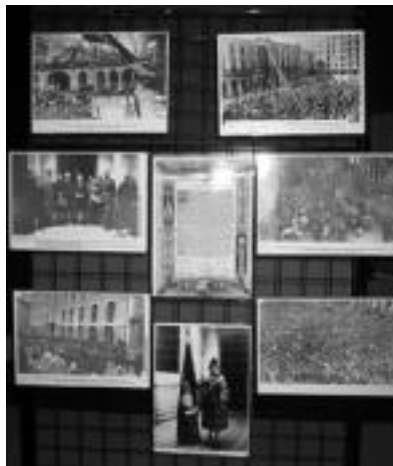
Hasierak. Argazkietan Errepublika garaiaren bilakaera ikus daitezke; hala, erakusketa honetan ditugu, 1931an, II. Errepublika aldarrikatu zireneko lehen irudiak. E. EZEIZA