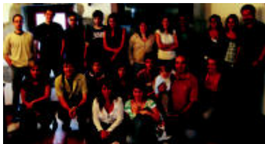
Aurrerako zuzendaritzako eta batzordeetako kideak. J. ASTIBIA