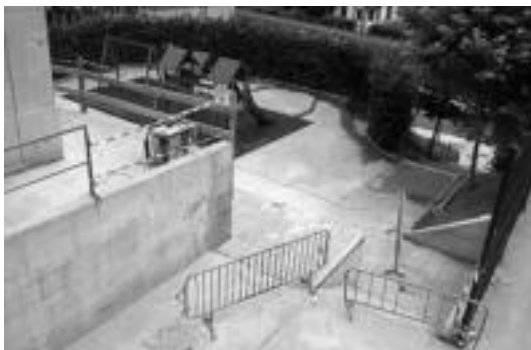
Haur parkearen inguruan ari dira obrak egiten. I. GARCIA