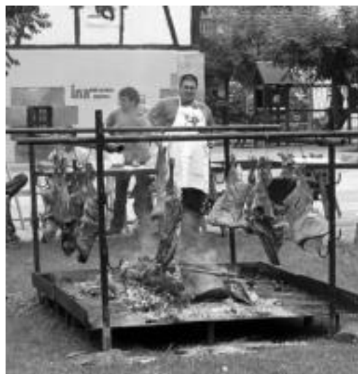
Zikiro jatea jada arrunta da jaietan. Irudian, Lizartza. INIGO TERRADILLOS