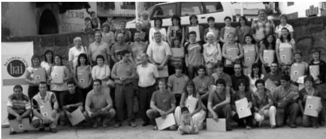
Bi herrietako allkateak eta Mendiguren bertan zirela, banaketara etorri ziren Aresoko eta Leitzako ziuertagiridunak. JAIONE ASTIBIA