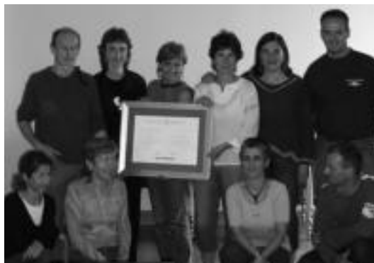
Eskolako Agenda 21eko ordezkariak, saria jasotzerakoan.

Eskolako Agenda 21eko ordezkariak «oso gustura» hartu dute saria, eta 2006-07 ikasturteko gai nagusia finkatu dute jada: hiri hondakina, zaborra.