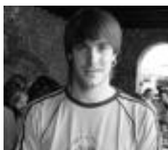
JKIN BARANDARAIN PAKE TOKI ELKARTEA

Aresoko eta Leitzako 57 eragilek Bai Euskarari Ziuertagiriak jaso dituzte, hauetatik 9 entitate berriak dira egitasmoan