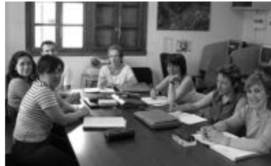
Euskara ikasten airtu diren irurarrak eta anoetarrak. HITZA

Bukatu berri den ikasturtean sei irurar eta bi anoetar aritu dira euskara ikasten