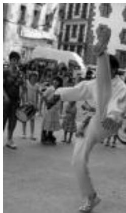
Eragileentzat Aurrekua. J. ASTIBIA

Horrela, plazara bertaratu zen jendearen txalo artean eragile horiek guztiak zegozkien Bai Euskarari Ziuertagiriak jaso zituzten, hartutako konpromiso horien ezaugarri gisa; baita txistu soinuaren dantzari batek eskainitako Aurrekua ere,