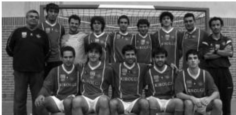
2005-06 denboraldiko Ibarra areto futbol taldeko jokalariek. I. TERRADILLOS

Ibarra areto futbol taldeak eginiko lanarekin gustura daude ordezkariek; zaleen eta Udalaren laguntza eskertu dute