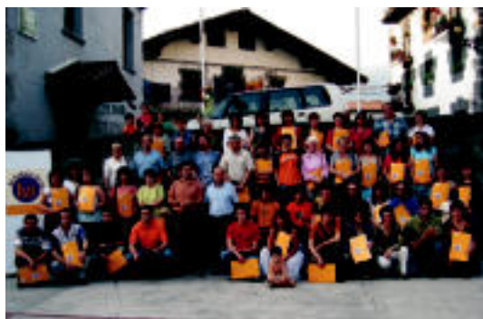
Bai Euskarari Ziurtagiria jaso duten Aresoko eta Leitzako eragileak, bi herrietako alkateekin eta Kontseiluko idazkari Mendigurenekin.

EUSKARAREN ALDE ▶ Kontseiluak «konpromisoak betetzeagatik eta berritzeagatik» zoriondu zituen ▶ 7