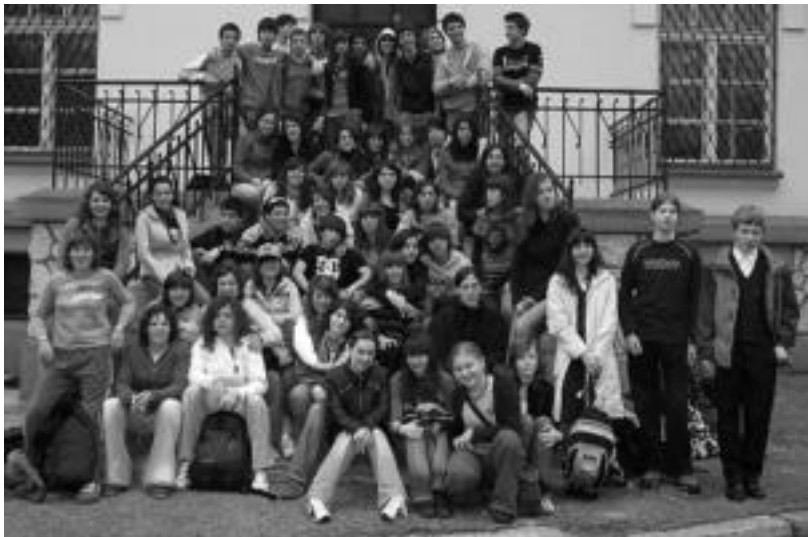
Polonian, Hirukideko ikasleek taldean ateratako argazki bat da hau. HITZA

Polonia eta Ingalaterra bisitatu dituzte Derrigorrezko Bigarren Hezkuntzako eta Batxilergoko 130 ikaslek