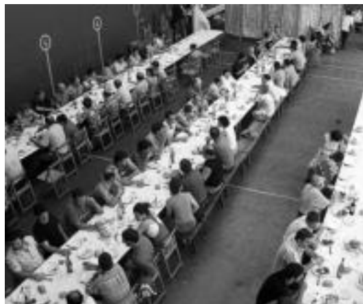
Beroa ez zen oztopoa izan ugartetarrentzat. HITZA

zten, zerbitzen, eta mahaikoei kasu egiten. Horregatik, Ugarteko elkarteak hauei eskerrak eman nahi dizkie, «lanik ez duela ematen badu ere, baduelako, eta jendea honetarako beti behar delako». Era berean, jatera joandakoei ere eskerrik eman nahi dizkie, jai giroan igarotako egunaren parte izateagatik.