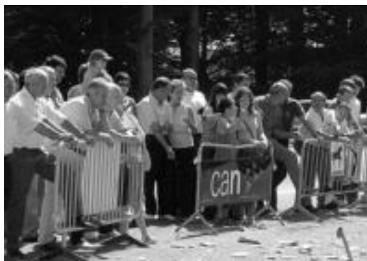
Jende asko bertaratu zen Kaxeta ingurura, festa girora: auzotarrak ez ezik herritik, noski, eta baita kanpotik ere etortzen da. M. SOROA

Aurten zozketako saridunak ere gustura gelditzeko moduan izan ziren. «La Perlan saio osoa, otorduak, San Fermin Torneoko finalerako txartelak, eta herriko laguntzaileek emandako hainbat opari» zozketatu baitzituzten. «Oso ongi atera zen dena», zioten.