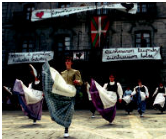
Dantzarien emanaldia, igandean, plazan.

UEMA EGUNA ▶ 'Herria da gorputza, hizkuntza bihotza euskararen taupada txintxarion hotsa' lelopean egin zuten igandean; ekitaldi ofiziala, dantzariak, abesbatza, txekor jatea, trikitilariak, txistulariak... izan ziren ▶ 5