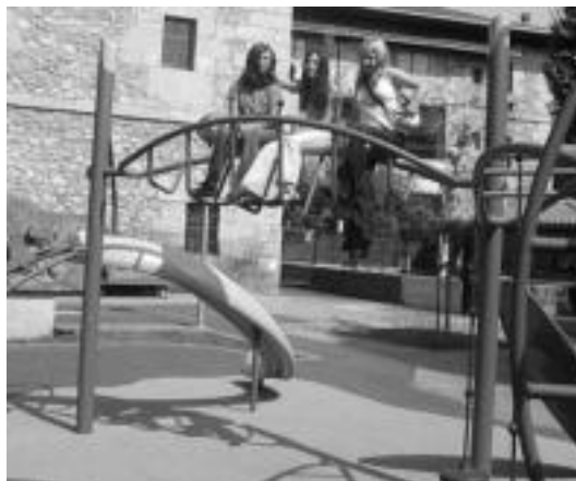
Ontzi-kroskoan jarrita ikuspegi ederra izan daiteke. I. GARCIA

Txikiak ere badute bere aldean ezastruktura nagusi bat. Bertan ezagunagoak diren jolasak aurki daitezke. Bestalde, haurrentzako parke batean beti lekua duten kulunkak ere badaude.