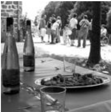
Urkizu. Herenegun eguerdian, Toka Txapelketarekin batera, hamaiketako hartu zuten auzokideak. Trikitilarien doinuak alaitu zuten bertan giroa. MADDI SOROA