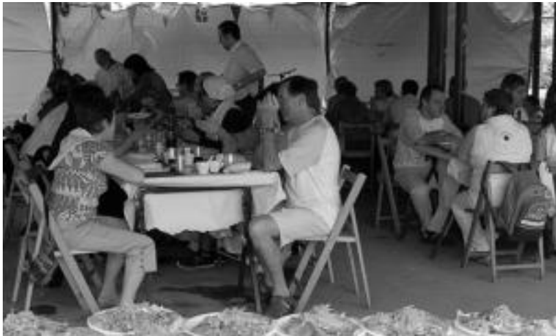
Igandean egindako auzo bazkarian 80 lagun inguruk hartu zuten parte. MADDI SOROA

IV. Antzerki Astearekin hasi zituzten jaiak amaroztarrek, eta zazpi egunen ondoren igandean amaitu zituzten