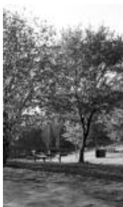
Kutturrun atsedenekua. o. e.

Pasa den asteburuan, larunbatean, hain zuzen, giltza batzuk aurkitu zituen ikaztegiatiko herritar batek. Kutturrun atsedenekuan zeuden giltza horiek. Inork galdu izan baditu, bertako udaletxean utzi dituzte, eta hauek jasotzeko handik pasatu behar da, goizez bakarrik: 09:00etatik 15:00etara bitartean, zehazki esanda.