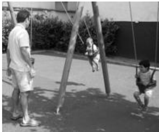
Txikiak kulunketan jostatzeko aukera dute. I. GARCIA