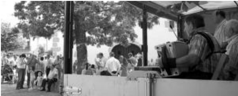
Larraitz. Hamaiketakoaren ostean, trikitilarien eta bertsolarien saioaz gozatzeko aukera izan zen herenegun. Ondoren, bazkarian bildu ziren auzokideak. MADDI SOROA