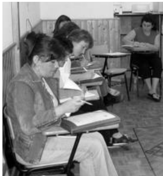
Geriatría tailerrekoak Tolosaldea Garatzeneko ikasgelan. MADDI SOROA