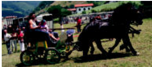
Pottoka gainean nahiz zalgurdian ibiltzeko aukera izan zuten. J. A.