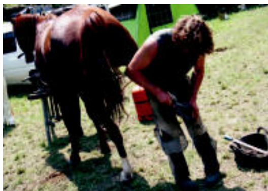
Perraketan ere aritu ziren; irudian hiltzeak sartzen ari da. J. A.