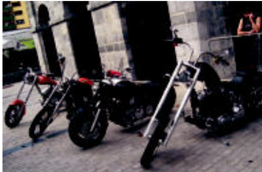
Jaialdiko motorik bitxiak erakusketan jarri zituzten. J. ASTIBIA