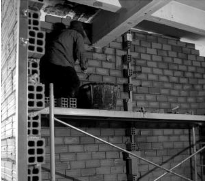
Iturgintzako tailerrean ari direnetako bat, Iruran egiten ari diren medikuarentzako kontsultan. MADDI SOROA

Programan parte hartzen dutenek lanbide heziketa jasotzen dute eta, era berean, lan praktikak egiten dituzte interes publiko edo sozialekin harremana duten obra edo zerbitzuen bitartez. Modu honetan, etorkizunean lan merkatuan sartzeko aukera izango dute.