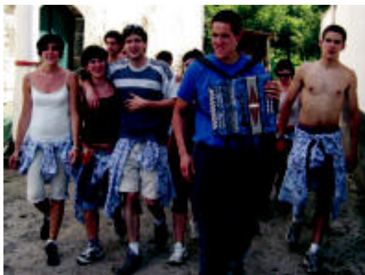
Aresoko zenbait gazte, atzo, eskean baserri baserri. I. ASTIBIA

Herri kirolek ere bere lekua izango dute Asteasun, herritarrak elkarren artean lehiatuko baitira (18:00). Beste txapelketa batzuk ere jokatu dira: Urkizun toka (12:30) eta boloak (18:00), Leaburun toka (12:00) eta Asteasun Pala Txapelketa (12:00). Jaiak aitzaki aproposa dira bazkariak egiteko eta horretara bilduko dira Areson eta Larraitzen. Beste hainbat ekitaldi ere egingo dira eta, noski, horien artean giroa alaitzeko ardura duten musikariak ez dira faltako.