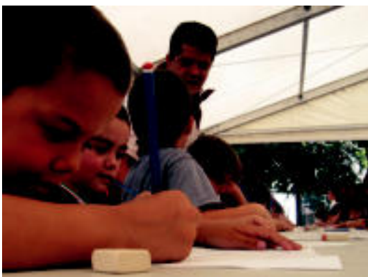
Asteasun gogoz hartu zuten haurrek marrazkiak egitea. I. GARCIA