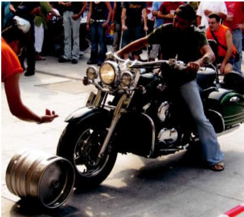
Motorrez trebetasunak frogatzeko jokoak egin zituzten: perrilarekin bultzatuz barrila eramatea, kasu. J. A.

IBARRA ▶ Langostino Moto Festako lehen eguna ikusgarri suertatu zen; motozaleak herrira iritsi ahala eguneko ikuskizunetan parte hartu zuten