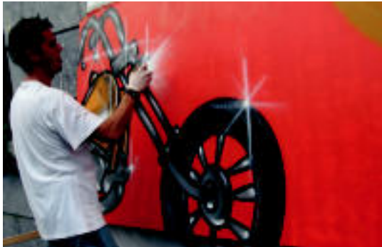
Langostino motozale festarako graffitia egin zuten, koloretsu. J. ASTIBIA

Amaroz (Tolosa). 08:00etan, garbiketa Betikoak taldearekin; 09:30ean, lurren Amarozko hildakoen aldeko meza; diana; 10:30ean, eskulanean erakusketa eta euskal erromeria, Amarozko dantza taldearekin; 13:30ean, fatxada eta balkoi loratu eta apainduenen sari banaketa; 14:30ean, bazkaria; 18:30ean, Amarozko dantza taldearen saioa eta aurrekua; 20:00etan, afari-merienda. Areso. 09:30ean, gosaria; 10:00etan, eskea herrian; 14:30ean, bazkaria; 19:00etan, musika plazan Joxe Anjelekin. Asteasu. 12:00etan, Pala Txapelketaren finala; gero, sagardo dastaketa plazan; 18:00etan, herritarren arteko herri kirolak; 19:00etan, Tapia eta Leturia. Larraitz. 12:30ean, meza nagusia; hamaietakoak, trikitilarien eta bertsolarien saioa eta bazkaria. Leaburu. 09:30ean, diana; 10:30ean, meza eta dultzaineroak eta herriko dantzarien saioa; 12:00etan, Toka Txapelketa eta EHNA tramitatzeko aukera; 18:30ean, Gipuzkoako 1. mailako Aizkolari Txapelketa; gero, Saioa eta Alabier. Leitza (Gorritaran). 10:00etan, meza, kapilan; gero, aizkolariak, sokatira, umeentzat jokoak eta bertsolariak; 14:00etan, bazkaria, hotelean; 17:00etan, Mus Txapelketa; 19:00etan, dantzaldia; 20:00etan, XXII. Txintxurri txapelketa; 20:30ean, zozketa; gero, txokolata. Urkuta. 12:00etan, meza nagusia; 12:30ean, Toka Txapelketa; 18:00etan, ume jolasak eta bolo txapelketa; egun osoan, trikitilariak.