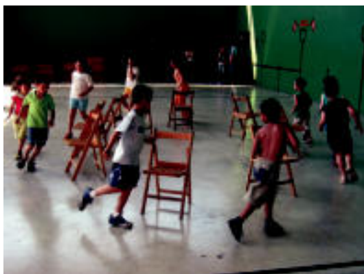
Leaburuko frontoian aulki jokoan, atzo, herriko txikienak.