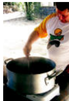
Ajoarriero Lehiaketako parte-hartzaile bat, lanean.

Urteroko arrakastari jarraituz, Ajoarriero Lehiaketan aritu ziren atzo dozena bat talde ▶ 5