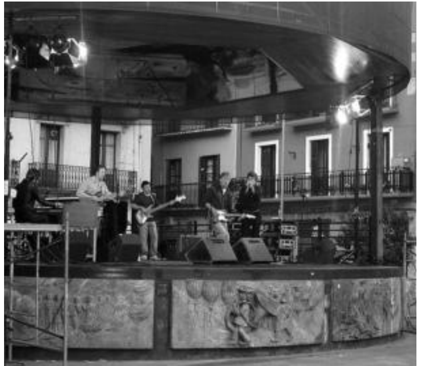
Musika ona entzun ahal izango da egunotan Tolosan; argazkian, iaz, The Blues Blaster 's taldea.

Antolatzaileek «garrantzitsuen» jo duten emanaldia, Paul Lamb & The King Snakes taldearena, gaur izango da, 22:00etatik aurrera, Plaza Berrian. Jendeak ondo har dezala espero dute; izan ere, «Europako blues musikaren erreferentzia nagusia da taldea». Paul Lambek, gainera, 60ko hamarkadan Ameriketako benetako blues musikari gazteengan eragin handia izan zuen, besteak beste, Eric Clapton edota Peter Green musikariengan.