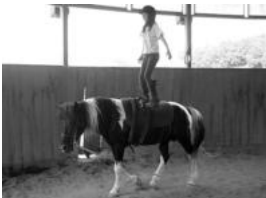
Haur bat zaldi gainean, atzo, Pottok zalditegian. I. GARCIA

Pottok zalditegian egingo dute ikuskizuna gaur, 23:00etatik aurrera