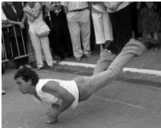
Txintxurrin txapelketak —irudian izakoa— ikusle asko biltzen du.