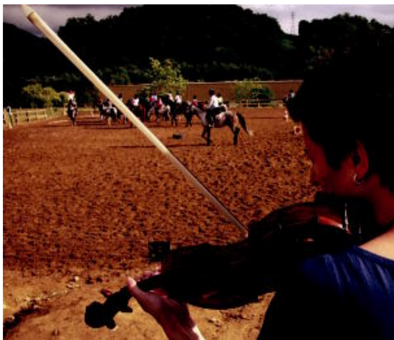
Zaldunak eta musikaria, entsegu batean; gaur ere musika zuzenean joko dute.

ZIZURKIL ▶ Gaur gauean eskainiko dute 'Pottok 06 musiketari'; «inguruan ez da horrelakorik egin» ▶ 4