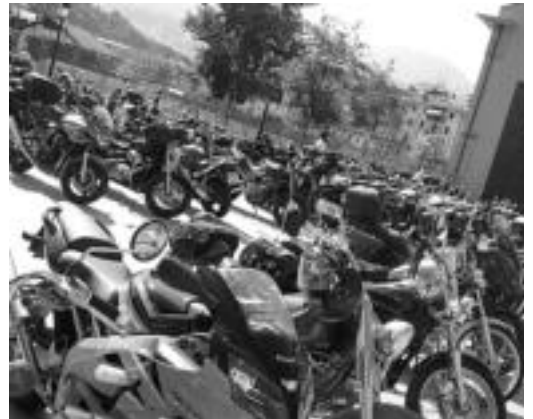
Pasa den urteko jaialdiko irudietako bat. JAIONE ASTIBIA

Motorra eta jaia uztartuz, 250 motozaletik gora elkartuko dira gaur eta bihar Ibarrran