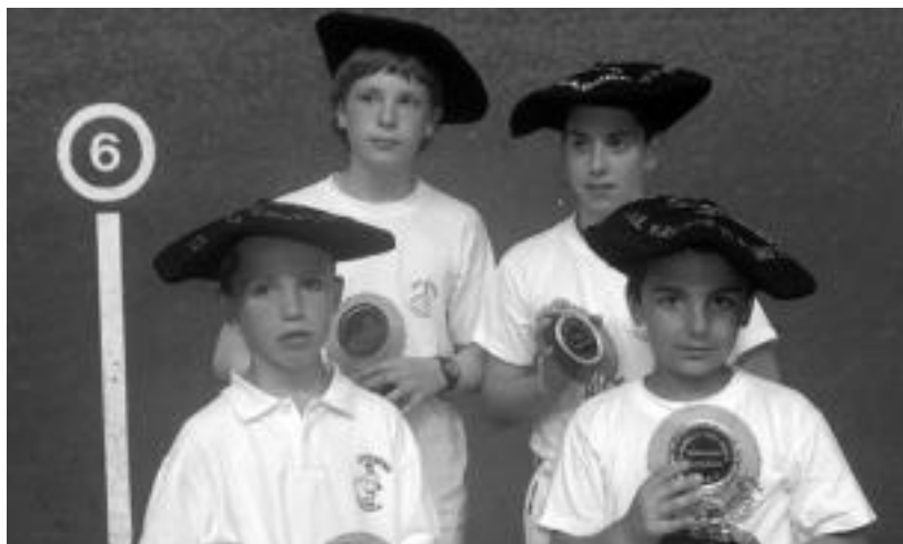
Hainbat txapela eskuratu dituzte Intxurre Pilota Eskolakoek, besteen artean, palakoa. HITZA