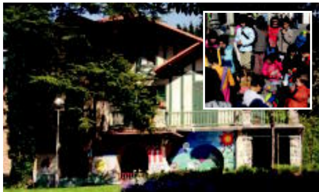
Urtebete honetan Villabonako gaztetxean hainbat ekintza burutu dituzte. HITZA

Ez daudela oso momentu goxoan azaldu dute: «Guk beti irtenbidetzat Haur Eskola beste nonbaiten egitea ikusi dugu, behar duguna badugulako; Udalak Haur Eskola bertan kapritxoz nahi duelako, guretzat besterik bilatzea dirua alferrik gastatzea dela ikusten dugu. Hala ere, Udalarekin hizketan gabilta nora bidali nahi gaituzten jakiteko. Hasiera batean herriatik kanpo bidali nahi gintuzten, eta baita lurrzaira ere. Horregatik, gure jarrera mantenduko genuela eta eskatutako baldintzak betetzen ez baziren Urdapileta ez genuela utziko esan genion Udalari». Egungo haurtzaindegia Aldundiarena denez, hara ere jo dute Gaztetxeok eta Udalak, eta