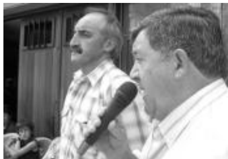
Asteasu. Jende ugari hurbildu zen herriko plazara herri kirol saioak —goian, eta ezkerrean— ikustera. Bazkarian elkartu aurretik, bertsolarien saioaz —eskuinean— gozatzeko aukera izan zen.