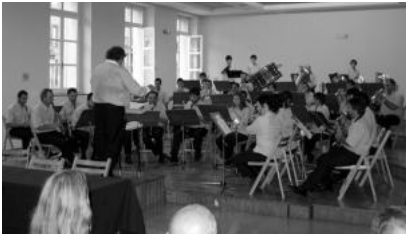
Udal Txistulari Bandak eta Musika Bandak zenbait doinu jo zituzten herenegun, aurkezpenean.