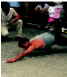
Txintxurrin txapelketa, iaz. J. ASTIBIA