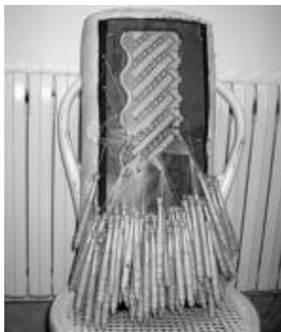
Ehoziariak. Ikastaroetako batean, bainikako eta ehoziarietako lanak burutu dituzte. Tailer honetan zazpi ikasle aritu dira lanean. E. EZEIZA