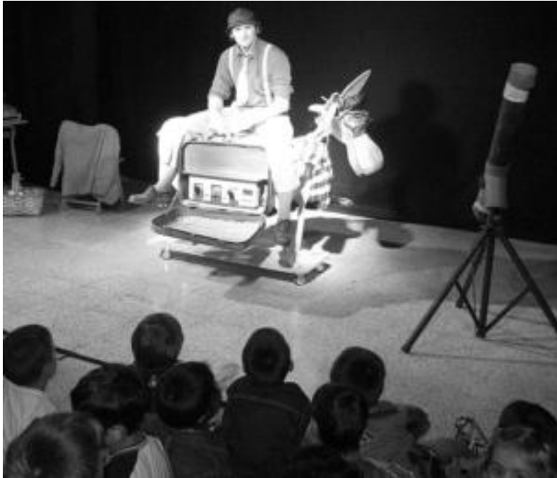
Herenegun, umetxoei zuzendutako lana eskaini zuen Gorringo taldeak; Asto bat hipodromoan. N. LATABURU

Gaur amaituko dute 'Gu ere obratan gaude...' Amarozko VIII. Antzerki Astea, Amarozko Antzerki Artisauak taldearen 'Un poco de impro' antzezlanarekin