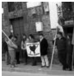
Leiztan elkarretaratze bat. J. A.

Hala, idatzian aitatzen dutenez, esate baterako, hileko 2. ostiraletan uko egiten diote arrantxoari, «bakarturiko kideen egoera salatze eta gaixo larrien askatasuna eskatzeko»; eta «patio orduetan, estradizio eta kanporaketak salatze eta enkarteladak» egiten dituzte; eta