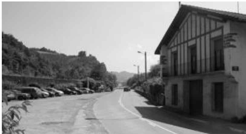
Besteen artean, Alegiatik Bentaundira doan errepide inguruan sartuko dute ur-hodia. N. URBIZU

Aldundiak Baliarraingo errepidea moztu, Alegialdeko urak biltzeko hodiak eta Tolosa-Ibarrako igarobideak berrituko ditu