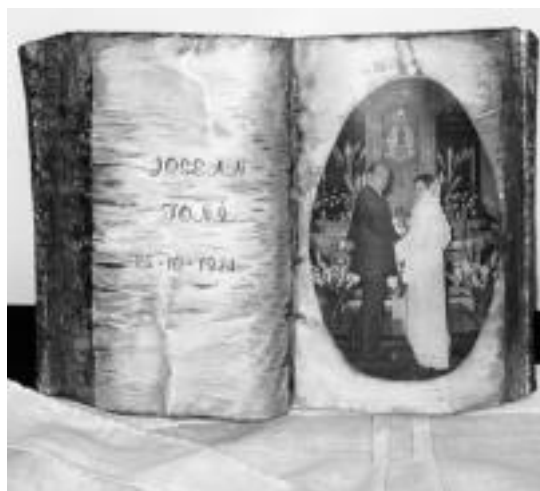
Eskulanak. Ikastaro honetan sei pertsonak hartu dute parte. Hemen, besteak beste, kaxak, platerak eta beirak margotu dituzte. Bestalde, irudian ikusi daitekeen bezala, telefono gida batekin antzinako liburu bat egin dute. E. EZEIZA