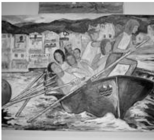
Pintura. Estilo guztietako margolanak burutu dituzte pinturako ikasleek. Honen adibide, argazkian ikusi daitekeena, sanjoanetako batel estropadak ardatz hartuta Ibarrako arraunlari batzuek margotu dituzte. E. EZEIZA