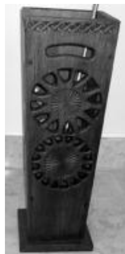
Egur-taia. Euritako-ontziak, ordulariak, kuadroak... egin dituzte, besteak beste, egur-taiako eskoletan. Denera, zortzi lagunek hartu dute parte ikastaroan.