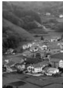
Aresoko herrigunea. HITZA

Eta Leiztan, berriz, bihar egingen dute ohiko batzarra, 21:00etatik aurrera, honako puntu hauek izanik mahai gainean: «2005eko Kontu Oroko