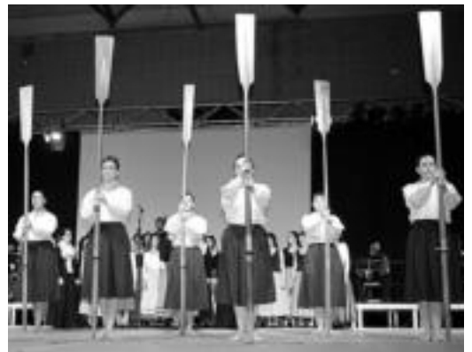
Oinkariren Oroituz ikuskizunaren irudia. HITZA

Eskoriatzan hasiko ditu gaur Oinkarik udan eskainiko dituen ikuskizunaren saioak