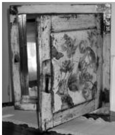
Altzari-errestaurazioa. Kutxak, maletak eta beste hainbat altzari errestrauratu dituzte ikastaro honetan bost lagunek. E. EZEIZA