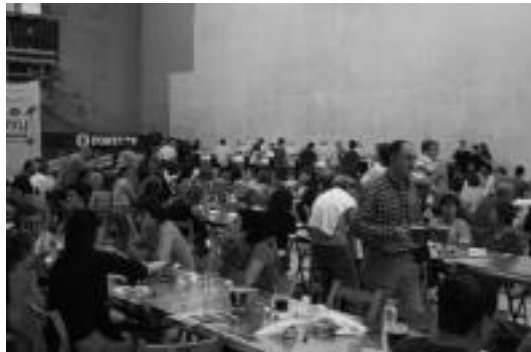
lazo garagardo azokaren irudia.

Iaz bezala, haurrek pitxiak eragin dituzte Garagardo Azokan