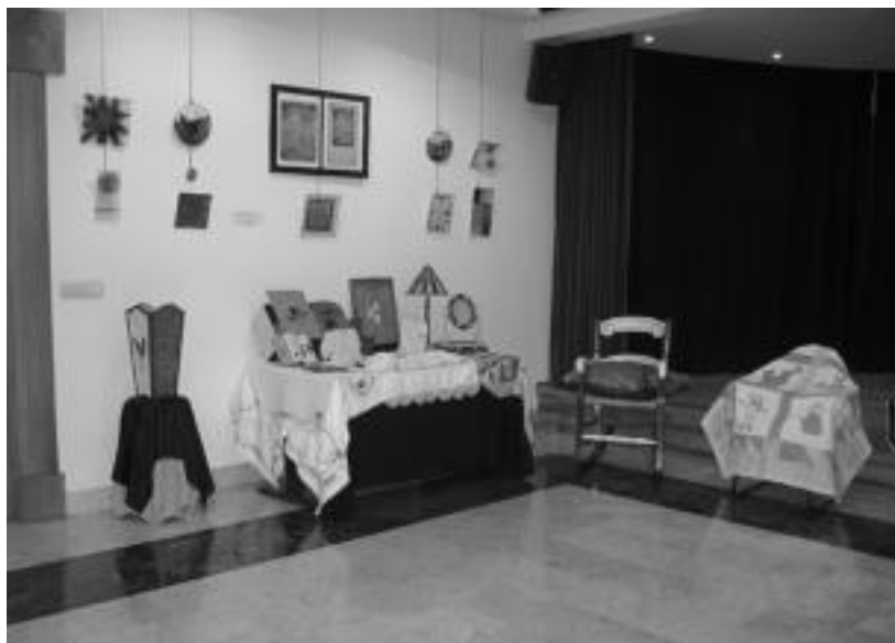
Erakusketa. Eskulanak, egur-taiak, altzari errestrauratuak, margolanak, bainika eta ehoziariak landu dituzte besteak beste, 2005-2006 ikasturtean burututako tailerretan.