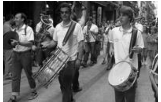
Txarangak alaitu zituen kaleak BetiZu-koekin batera. ESTI EZEIZA