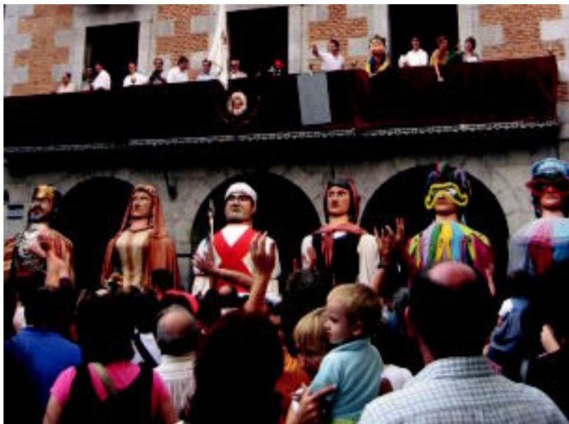
Tolosako erraldoiek zaindu zuten udaletxea txupinazoaren unean. N. LATABURU

SANJOANAK ▶ Asteburu osoan aspertzeko astirik ez dute izango tolosarrek eta kanpotik datozenek ▶ 2,3