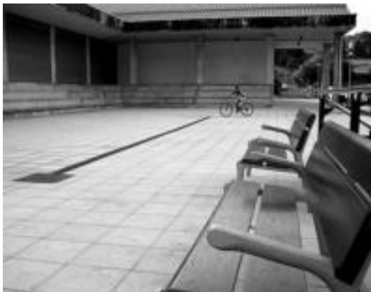
Frontoiaren aurreko plaza egokitu egin dute. n. u.

Herriko arkitektoa zenaren proiektua gauzaturik, frontoian bilduko dira bihar