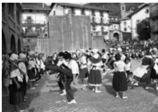
Jendetza bildu zen gaztetxoan Ingurutxo ikustera, beroak bero. J. A.

Eguzkiaren beroak ez ezik, bertara bildu zen jendetzaren txaloen beroan, Ingurutxo ederki dantzatu zuten herriko gaztetxoak: dantzari ttikien taldekoak aurre eta atzean gidari zituztela, haur ttiki eta kozkorxeagoak osatu zuten soka, txukun. Ondoren txistor-opilak banatu zituzten umeen artean, freskagarriekin.