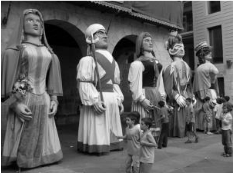
Txupinazoarekin batera erraldoiek alaitu zuten Plaza Zaharreko giroa, euren dantza saioekin. N. LATABURU

Erraldoien konpartsak protagonismo gehiago eskuratuko du eta, gaur, prozesioaren aurretik joango dira dantzari lehen aldiz