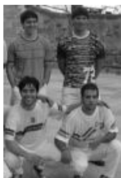
Lau finalistak. J. ASTIBIA

Igande arratsaldean jokatu zituzten finalerdia, Plazako binakako Pilota Txapelketan, eta txapelduen izateko aukera honako bikote hauen artean dago: Alduntzin-Sagastibel-tza edo Aldaia-Olano. Izan ere, Bengoetxea-Gartzia 22-19 eta Makazagarrei 22-18 irabazi zieten, hurrenez hurren, «ordubete pasako partidak joaktuta». Finala eta 3. eta 4. lekuak erabakiko dituzten azken partidak, heldu den hilaren aurrenean, 18:30 aldera, jokatuko dituztela eman dute jakitera.