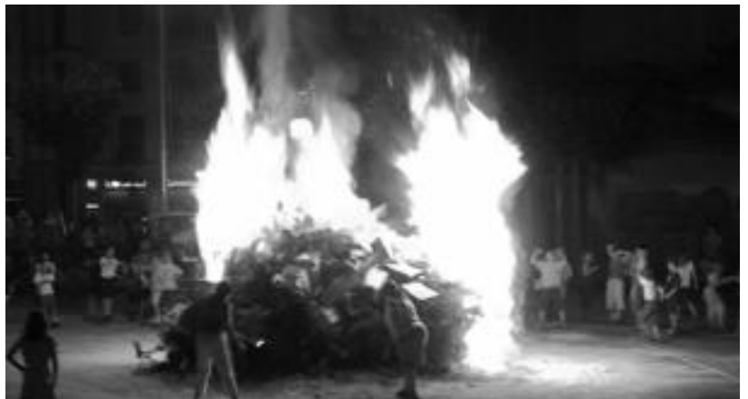
Askotan suak hiru metroak menderatzen ditu, baina, hala ere, jendea animatzen da saltzera. HITZA