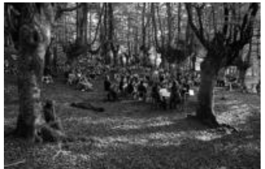
Et Incarnatus orkestra iaz Urkizuko Iraolako zuloa kontzertuan. J. S.

Entzuleak ere ikuskizun honen parte bilakatuko dira, basoetako zuhaitzek ere musikaren oihartzuna eragiten dutelarik. Ohikoa den bezalaxe, amaieran izango da tripa berdintzeko zer jan eta edana bertaraten direnentzat, «ongi eta osasuntsu izan dadila guztiontzat» heldu den uda.