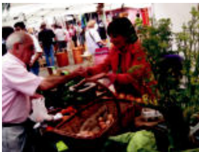
Azoka ekologikoa. Baserriko produktu ekologikoak izan ziren izarrak, besteak beste.

Sanjoanetako Azoka Berezia izan zen atzo produktu ekologikoenarekin batera; posturik hobereenek sariak jaso zituzten; 3x3 Saskibaloi Txapelketa ere izan zen