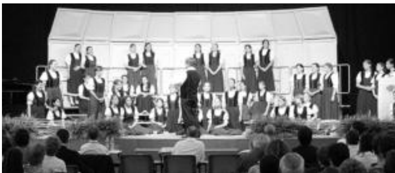
Cantemus Children's Choir-ek zuzendariarekiko eta entzuleekiko harreman hurbila erakutsi zuen. J. ASTIBIA