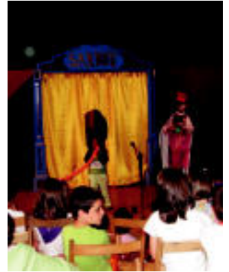
Frontoian pailazoak aritu ziren. N. LIZARTZA