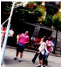
3x3 saskibaloi. Goizean zehar gazteoen banda izan zen, i.a.