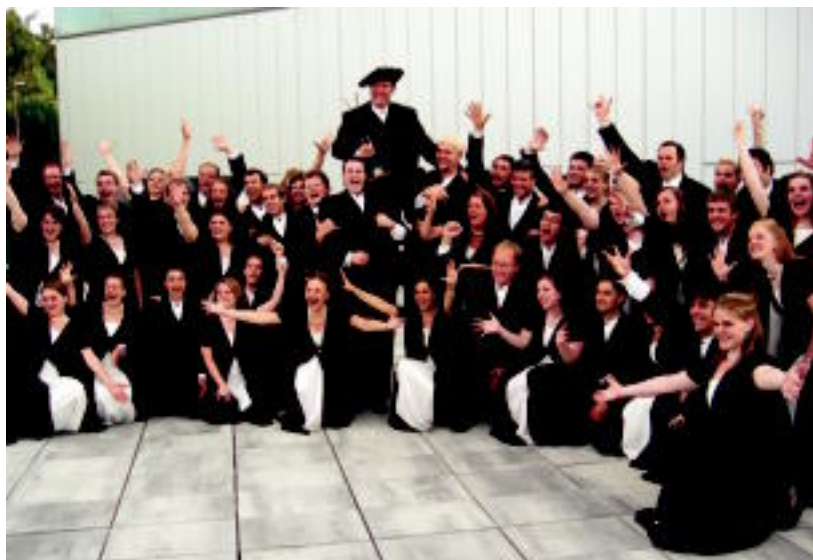
Estatu Batuetako University of Utah Singers abesbatzako kideak garaipena ospatzen. JAIONE ASTIBIA

PARTAIDEAK ▶ Turkiako Bilkent University Youth Choir abesbatzaren baja izan zuen lehiaketak ▶ 6