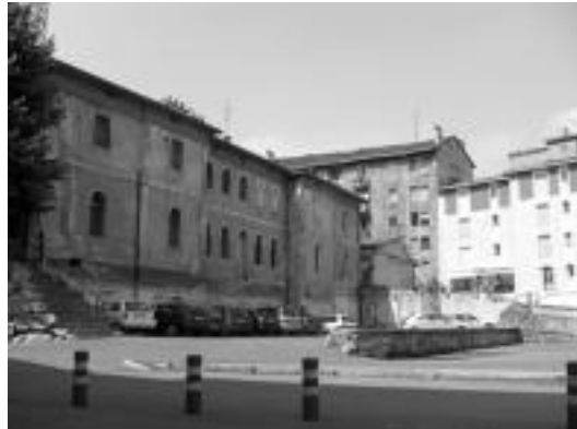
Inguru hauetan joango litzateke Gerontologiko berria. E. EZEIZA

Horregatik, orain burutzen ari diren gestio lanetan, Udaleko alderdi politikoak dira nagusi. Hala ere, gainontzeko par-