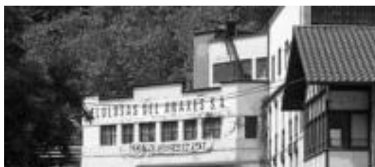
Araxes paper-fabrikak laster hilabete egingo du ibxita. N. U.

Araxes paper-fabrika berriro martxan 1997an jarri zuten, hiru urtez itxita egon ondoren.