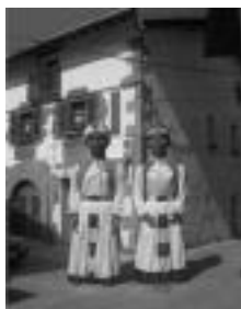
Leitzako erraldoiak. HITZA

Leitzako erraldoien konpartsan aritzeko gogoia dutenei egin diete deialdia