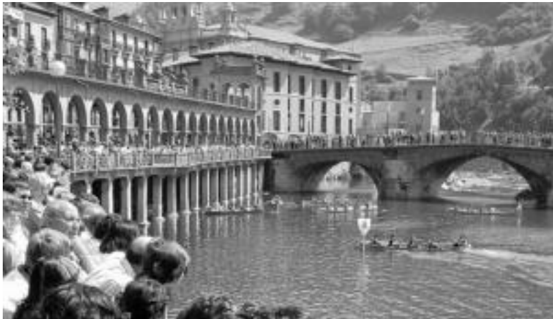
Jende andana bildu ohi da batel estropadak ikusteko; argazkian, iazko San Joan jaietakoak.

Bihar, batel estropadak izango dira ekitaldi nagusia; gaur, besteak beste, 3x3 eta Europako Abesbatzen Sari Nagusia