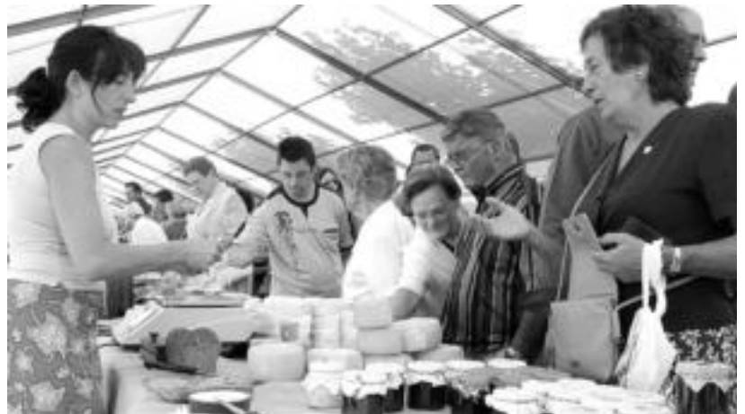
Jende asko erakartzen du urtero Sanjoanetako Azoka Bereziak; argazkian, iazko edizioa.

Herriak pixkanaka kolorea hartzen joango da, beraz, asteburuan, ostirala heldu artean. Ordutxe lehertuko baita festa, hiru egunetan zehar luzatuko dena.