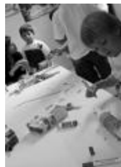
Eskulanak gogoko dituzte. J. A.

4-12 urte bitarteko haurrentzat eta gaztetxoentzat zabalik dago izen-ematea