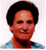
URTE ASKOTARAKO! Orain artean bezain polita jarrai dezazula. Denon partetik.