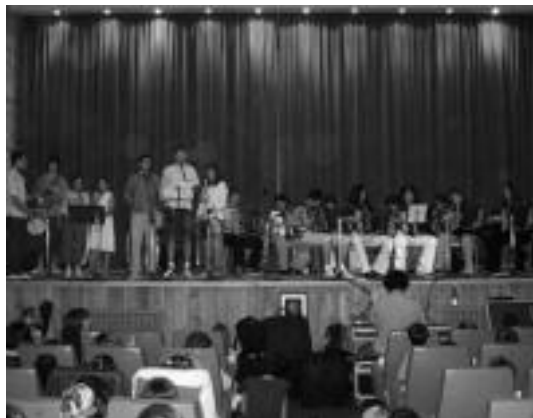
Duela bi urteko kontzertuan, ikasleak emanaldian murgilduta. J. ASTIBIA

Urtero eskaintzen dute kontzertua Musika Eskolako ikasleek. Ikasturtea bukatzearekin batera —gaur izanen dute, gainera, azken eskola eguna, bertako zuzendariak adierazi duenez—, ikasitakoaren erakusketak egiteko baliatzen dute ekitaldia. Hala, bi herrietako ikasleek 8 musika-tresna landu dituzte, bakoitzak bat edo