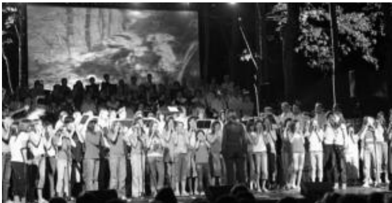
Herriko taldeek bat egin zuten, larunbatean, Zumardi Handiko kontzertu berezian. JOKIN MONFORT

ganean, baina antolatzaileei apustua ondo atera zitzaion.