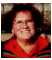
URTE ASKOAN, MARIJE! Non dago tarla zerrarekin? Jeje. Guztok balera ta zure imbarearekin, tortuko dugu. Mila muku Guantanamolo eta Orendango lagunak.