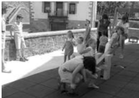
21 ikasle —atzo atseden garaian jostatzen— ditu Aresoko eskolak. J. A.

Geroztik, ordea, berriz ere beste eskutitz baten bidez eskakizunak onartu ez baina murriztu egin dizkietela jakin dute. Azken berrien ariora, «Haur Hezkuntzarako tutore bat, Lehen Hezkuntzarako, beste bat eta ingelerakoarentzat bere 9 saioez gain, beste 5 bakarra» onartu dituzte: «La-