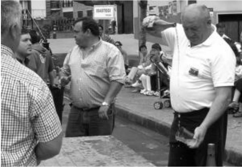
Jende ugari izaten da urtero Ateaga elkarteak antolatutako sagardo dastaketan. IMANOL GARCIA

Zortzigarren urtea beteko du aurten Bakailaoa Saltsa Berdean Lehiaketak; eskualdeko 15 bikote ariko dira etzi, plazan, platera hobekien nork prestatu