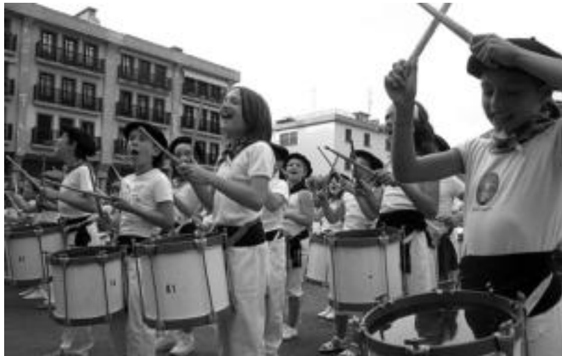
Txupinazoaren ondorengo danborradan haurrek gozatu zuten burrunba ateratzen. I. GARCIA

Gaur, Korpus Eguna, haurrek dira protagonista. Udalak antolatutako egitarauan, esaterako, ume eta gatetxoentzako parkea izango da goiz eta arratsaldean. Herri Borondatearen Aldeko Jaietan Mozorro Eguna egingo dute, eta Patxin eta Potxin pailazoaren ondoren, mozo- roen desfilea egingo dute.