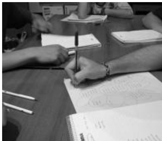
Margaritarena egiten dute, bertsoaren errimak idazteko. N. URBIZU

Lehenengo urteko irailan eta urriaren bitartean hasi ziren biltzen. «Bertsoekiko zaletasuna beti egon da hemen: era ez