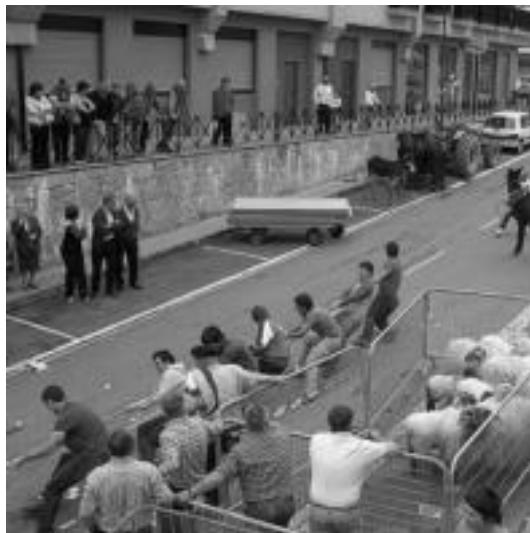
Gazteen eta helduen arteko demak jende asko biltzen du. HITZA