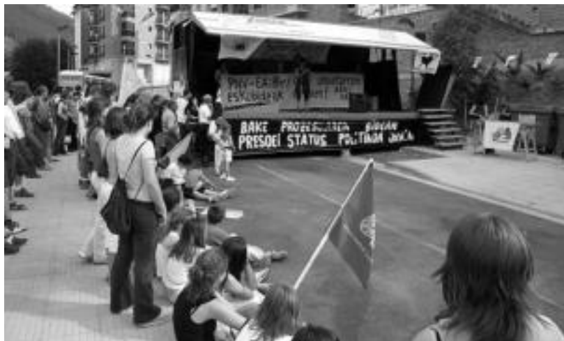
Herritar ugari bildu ziren txosnetan egindako txupinazora.