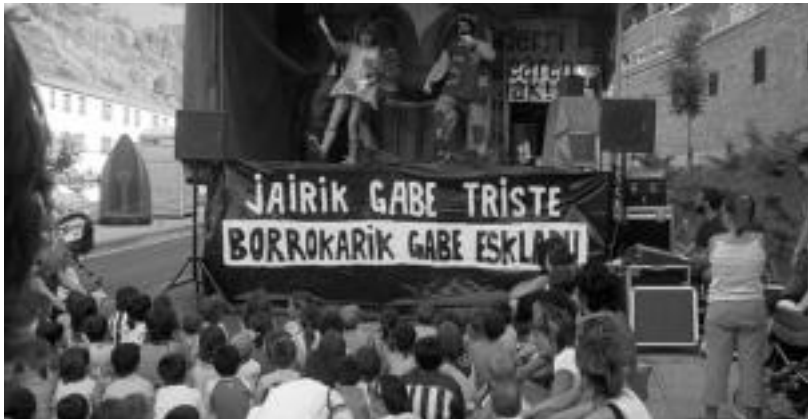
Gaur umetxoak izango dira protagonista, eta Potxin eta Patxin pailazoen emanaldiekin gozatuko dute. HITZA

Hiru urtetik hona Herri Borondatearen Aldeko Jaiak antolatzen dituzte