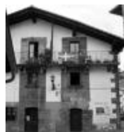
Aurrera elkarte, kanpotik. J. A.

Bi urtetik behin aukeratzeko dute elkarteko junta. 2004an osatu zen orain aurrekoa eta aurten berritzea egokitzen zaie. Aurrera elkarteak 300 bazkide baino gehiago dituelarik, horiei guztiei bertan parte hartzeko deia egin diete, ezinbestean. Izan ere, batzor-