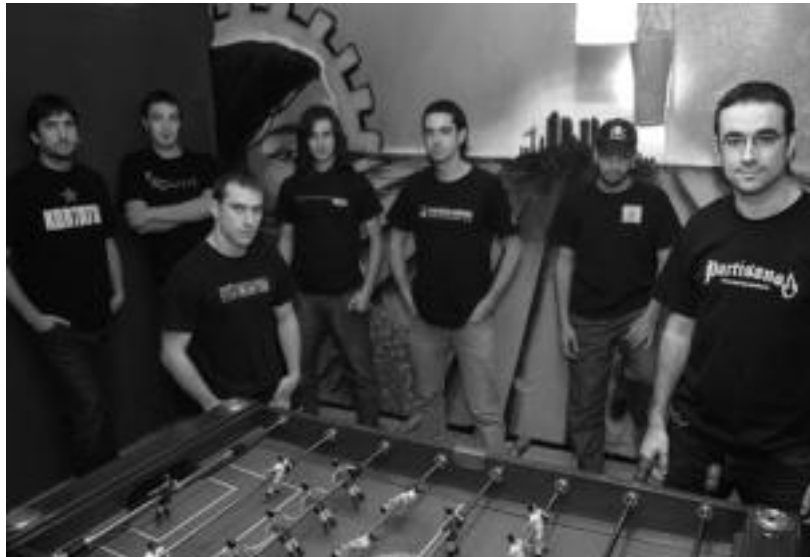
Obrint Pas talde kataluniarrak bihar eskainiko du kontzertua Ibarrrako plazan.

'Herri bat Gaztetxe bat' lelopean, 36. edizioa da aurtengoa; adin eta pertsona guztiei zuzenduriko egitaraua izango da