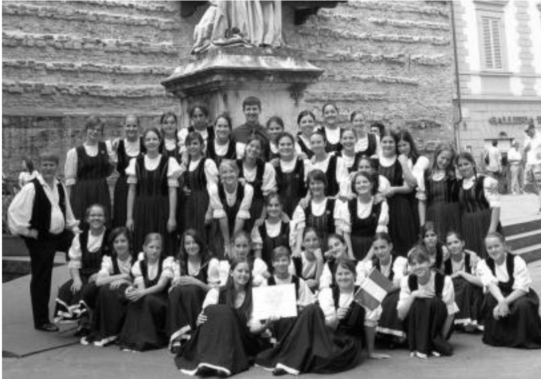
Cantemus Children's Choir talde hungariarrak parte hartuko du, etzi, 18. Abesbatzen Europako Sari Nagusian. HITZA

Munduko abesbatzarik onenak lehiatuko dira, etzi, larunbata, Usabal kiroldegian, 17:00etatik aurrera, 18. Abesbatzen Europako Sari Nagusian