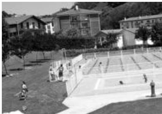
Atzo ireki zuten bezala sartu ziren uretara ausartenak.

Horrela, iraila arte, egunero irekiko dute igerilekua; goizetik arratsaldera, 11:00etatik 20:00etarako ordutegiarekin. Jakinarazi dutenez, baina, «umeei oporrak hartu arte,