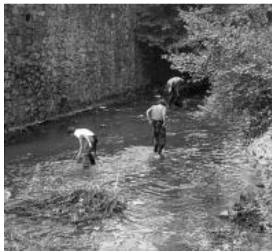
Hirukideko ikasleak, ibai ertza garbitzen. HITZA

eman zioten. Helburu nagusia «herriarekiko konpromisoa sendotzea» izan zuten, «baita udal zerbitzuak sortzen dugun zabor guztia jasotzeko gauza ez direla hausnartzea ere, batik batik bazter izkutueta botatzen ditugunak». Ikasleak «harritu» egin ziren horrelako toki eder batean zenbat zabor bil daitekeen ikusitakoan: freskagarri latak, plastiko mordo bat, frigorifiko bat, autoen paratxoak... «Gustura ibili ziren zabor bilketan, eta lan hauek egitearen beharraz konturatu ziren». Guztira, 500 bat kilo zabor jaso zituzten goiz osoan zehar. HITZA