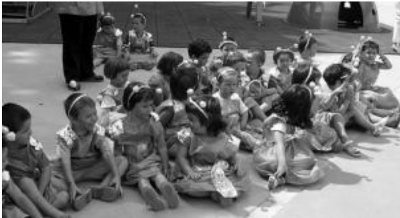
Joan den urtean Laskorain Ikastolak antolatutako udaleku irekietako irudietako bat.

Laskorain Ikastolak eta Galtzaundi Euskara Taldeak uztaierako hainbat ekintza prestatu dituzte gaztetxoentzat