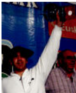
Otaegi, ospatzen.

23 urte azpikoetan jantzi du txapela; Rekondo «nerbio askorik gabe» aritu zen ▶ 3