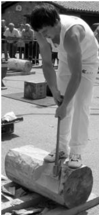
Zizurkilgo San Isidro eguneko erakustaldiaren antzekoak egingo dituzte Otaegik eta Rekondok udan ere. i. g.