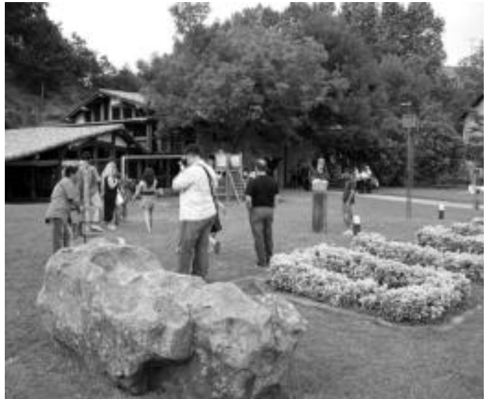
Jendea eskulturei argazkiak ateratzen eta ikuskatzen aritu zen inaugurazioan.