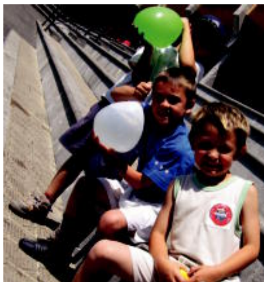
Beroa egun osoan zehar. Terrazan freskagarririk har ez zezaketenak, beroari aurre egiteko, nola edo hala, moldatu ziren. Haurrak puxikekin aritu ziren jolasten. N. U.