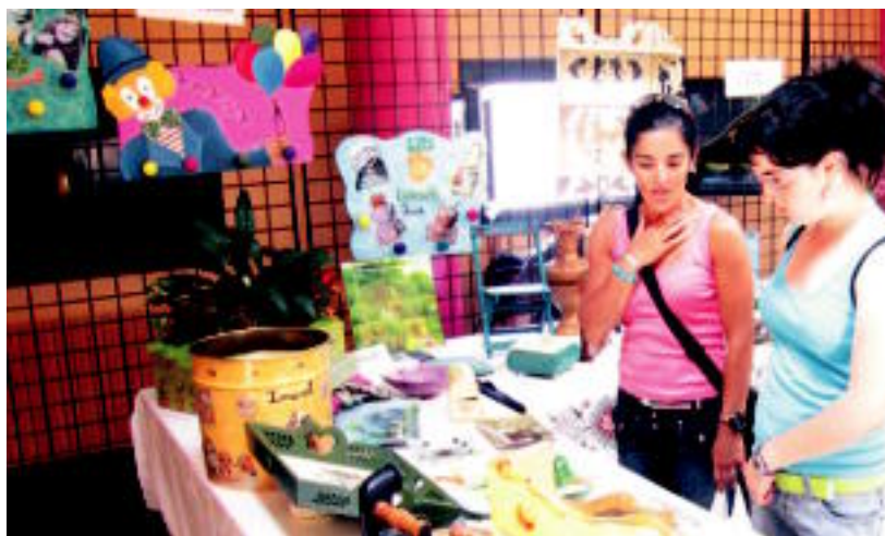
Herriko artisten eta eskulanetako taldekoen lanen erakusketak ikusmina piztu zuen atzo. N. URBIZU

DEMA ▶ «Ez hain gazteek» aurrea hartu zieten gazteei Herri Borondatearen Aldeko Jaietako sega proban ▶ 4