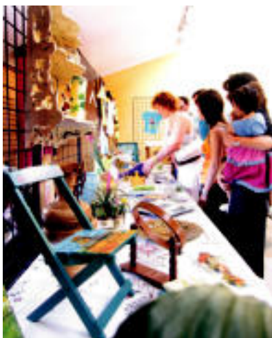
Erakusketa. Herriko artistek eta eskulanetako taldeak egindako lanak ikusgai egon ziren udalebexan. Bertan, hamaiketakoia izan zen. N. URBIZU