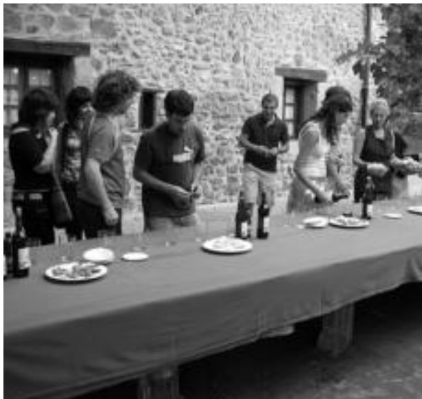
Artisten lanak ikusi ondoren, jendea mahaiondora zerbait jatera bildu zen. E. E.