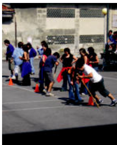
Koadrila Eguna. Egunean zehar, besteen artean, jokoak egin zituzten. Jokoetan, atxurrik behar ez baziren ere, baten bat ikusi zen... N. U.