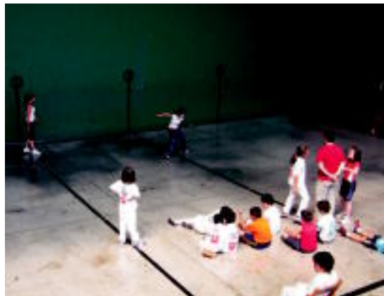
IX. Eskuzko Pilota Herri Txapelketako finalak. Neska-mutielek jokatu zituzten finalak, pilotalekuan. Benjaminak, alebinak, infantilak eta kadeteak aritu ziren. N. URBIZU