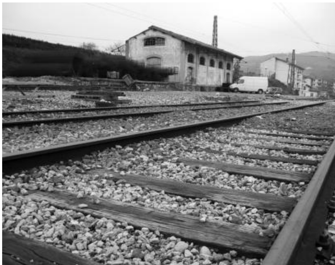
Villabonan gehien erabiltzen den garraio publikoa autobusa da (%17), eta Zizurkilen trena (%18). Argazkian, Villabona-Zizurkilgo tren geltokia, artxiboko irudian. Egun, aparkalekua dago hor: Villabonan 0,8 aparkaleku daude ibilgailuko, eta Zizurkilen hiru ibilgailuko bi aparkaleku.

Egunean 1.098 pertsona igo eta jaisten dira Villabona-Zizurkilen; emakumeak eta gazteak dira erabiltzaile gehienak