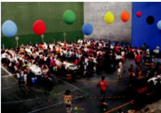
Samaniego ikastetxearen bazkariara jende ugari bildu zen. E. EZEIZA