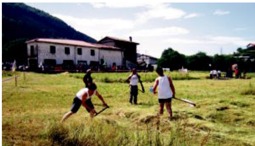
Aurkariak moztutako belarra bildu eta 22 plaza egin zituzten helduek; gazteen taldeak, berriz, 17. N. URBIZU