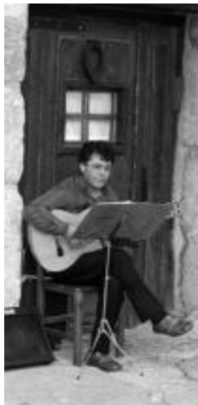
Musika ere, erakusketa alaituz. E. E.