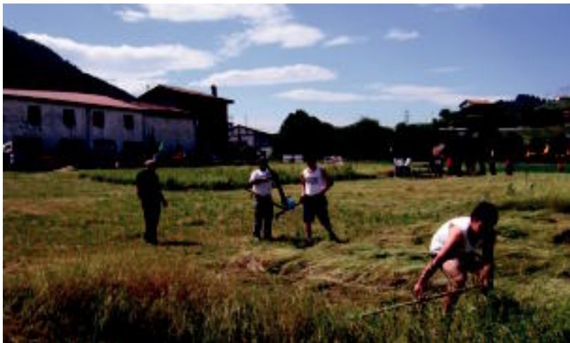
Herri dema. 11:00ak aldera, anoetar asko Herri Borondatearen Aldeko Jaien barneko herri deman izan ziren. Segala proba egon zen, gazteak «ez hain gazteen» aurka. 10 minutuz aritu ziren belarra mozten, eta ondoren, biltzaileek kontrako taldearen belarra jaso eta lera batean kargaturik plazak egin behar izan zituzten. Hori guztia, 30 minututan. Irabazleak helduak izan ziren, 22 plaza eginik. Gazteek, 17. N. URBIZU