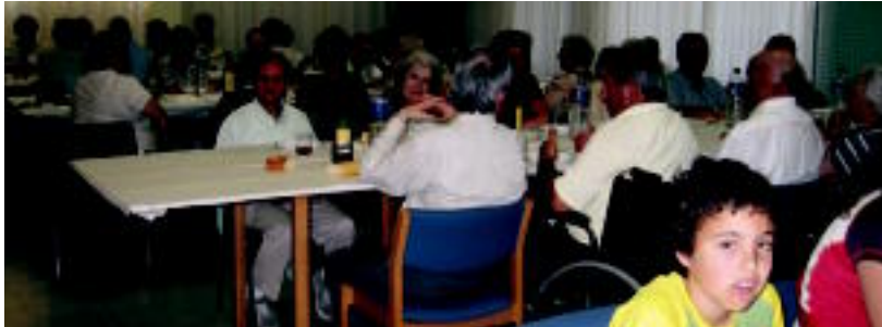
Euskal Herria plazako Zentro Sozialean bazkaria egin zuten atzo lurreamendiko adinekoek.

Gaur, bazkari berezi batekin emango diote bukaera lurreamendi egoitzakoek 2006ko Adinekoen Asteari