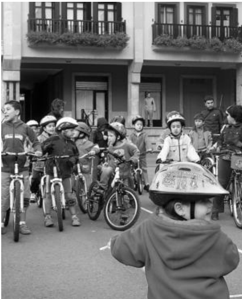
Oinezkoak eta bizikleta gainekoak gainontzeko garraibideen menpe geratzen dira, «alderantziz izan beharrean». Irudian, Anoetako Ikastolako haurrak, bizikleta gainean, iaz, Autorik Gabeko Egunean.

Hori guztia kontuan hartuta, «eta guztion parte-hartzea ezinbestekotzat joz», 2006ko urtarrilean Ernioaldeko Udaltaldea osatzen duten zazpi herrietako biztanleei inkestak egin zizkieten, «herritarrek egunero nola mugitzen diren baloratzeko. Honela, eman daitezkeen datu objektiboez gain, herritarrek euren mugikortasunaz duten ikusapuntua ere kontuan hartu ahal izan dugu». Eskualde eta udalerrri bakoitzak mugikortasuna baldintzatzen duten ezaugarri espezi-ko ugari dituela gogoratu dute,