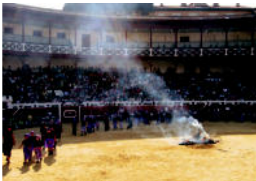
Hirukideko ikasleek San Juan sua irudikatu zuten. E. EZEIZA