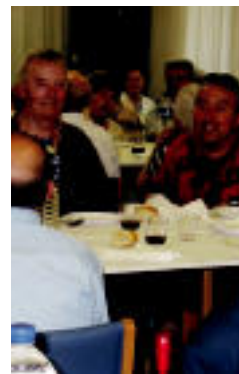
Adinekoak eta senideak, atzo, bazkarian elkartuta. E. EZEIZA

Atzo, bazkaria eta omenaldia izan zuten lurreamendikoek ▶ 5