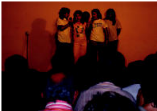
Flemingeko 5. mailakoek bertso emanaldia eskaini zuten. E. EZEIZA