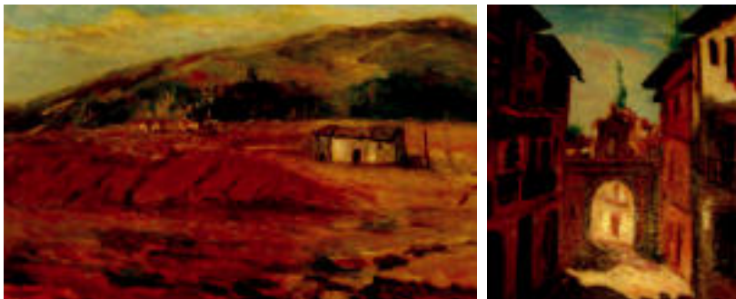
Teknika inpresionista erabiltzen du Lopezek paisaiak eta kaleak irudikatzean. HITZA