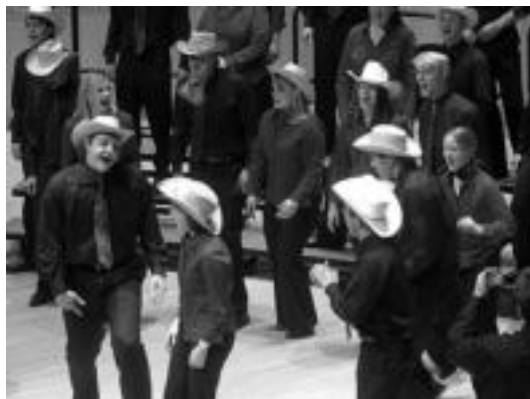
Utah-tik (AEB) iritsiko da University of Utah Singers taldea. HITZA

alkateak etorriko dira, eta baita Euskal Herriko zenbait politikari ere.