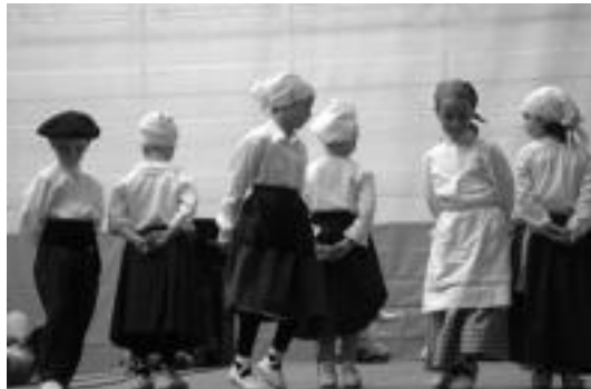
Uzturpe ikastolako jaietan txikiak ere aritu ziren. HITZA

Beasainen, Izaskunen eta Uzturpeko jaietan eskaini dituzte saioak Alurr dantza taldeak; udan ere emanaldi ugari dituzte