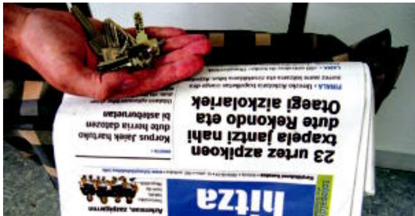
Bi eskualdeetako hainbat puntutan utz ditzakete harpidedunek beraien atariko giltzak. HITZA

TOLOSALDEA ETA LEITZALDEA ▶ HITZA jasoko dela ziurtatzeko eta banaketa fintzeko bidean, ezinbestekoa da banatzaileek atariko giltzak izatea