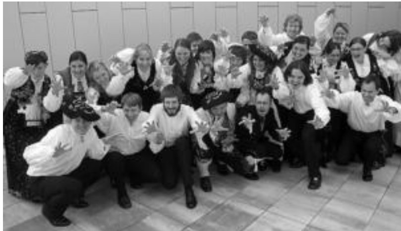
Osloko (Norvegia) Schola Cantorum, Tolosako 37. Abesbatza Lehiaketaren irabazlea. I. TERRADILLOS

Honekin batera gaineratu zuten luxuzko ekitaldi bat izango dela Europako Sari Nagusia bertara oso abesbatza onak eta jende garrantzitsua bilduko baitira. Horren adibide, kulturari atxikimendua eta babesa emanez, parte hartuko duten abesbatzen herrialdeetako