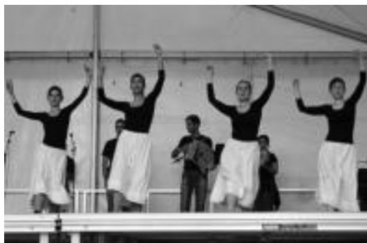
Beasaingo jaietan musikariekin eskaini zuten saioa. HITZA