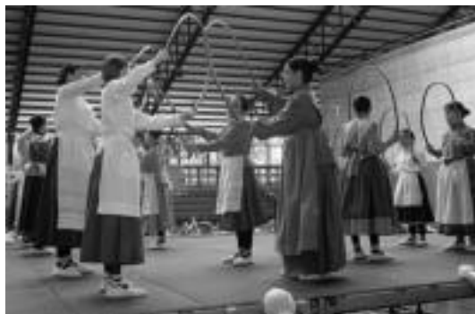
Ikastolako jaietan, 12 urtekoen saioa une bat. HITZA