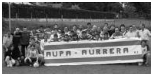
Aurrera taldea Ligako azken partiduan, zaletuekin batera. J. ASTIBIA