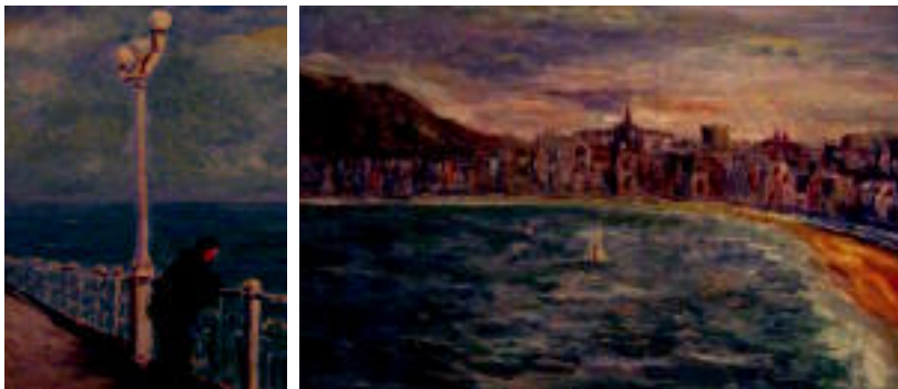
Itasertza gustuko du Lopezek bere margolanak egiterakoan. HITZA