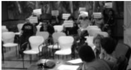
Asteazkeneko udalbatzarreko une bat. HITZA

ak gelditzearen aldeko sinadura bilketa egingo du Ibarrra plazan. Azaldu dutenez, 400dik gora sinadura batu dituzte, eta gehiago lortu nahi dituzte on-