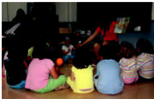
Ipuin kontaketa instrumentuekin lagundu zioten irakasleari. e. e.

Eskolako ikuskizunaz gain, erakusketa ere izan zen ikusgai ▶ 6