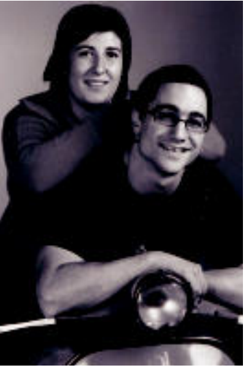
ZORIONAK Zorionak eta ondo pasa. Lagunen partetik.