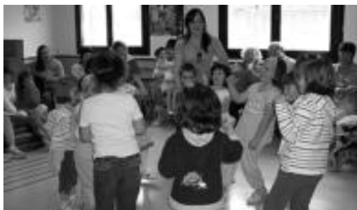
Haurrek egindako emanaldiaren une bat. ESTI EZEIZA