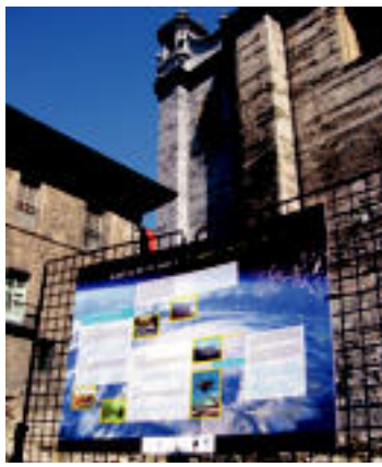
Energiari eta klima aldaketari buruzko erakusketa ikusgai da egunotan Errotan, Tolosan. L. MONTES