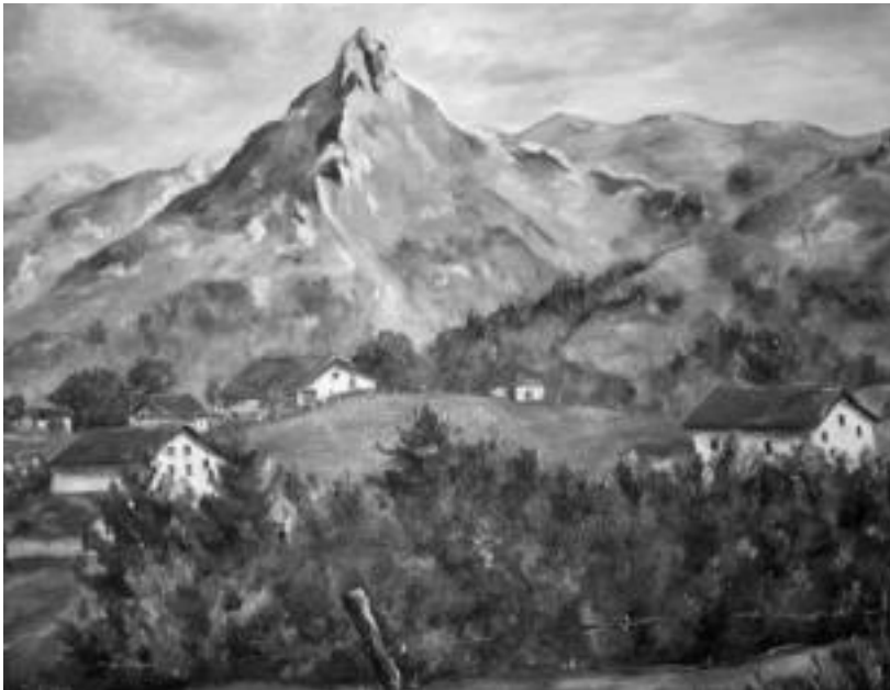
Txindoki udan. Pintzelarekin egindako olio teknika erabili du lan honetan. Ikusten denez, herria ere barneratu du bertan. Maite Itsasok ikusten duen moduan islatzen du dena; ez du ezer ere asmatzen. Lazkao aldera jotzen du, hango ikuspuntua gustukoagoa duelako. N. URBIZU