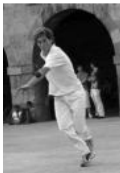
lazio txapeldun aurrelaria. J. A.

Hauexek dira bikoteak: Lazkano-Buldain / Alduntzin-Sagastibeltza; Makazagatarrak / Telletxea-Zabaleta; Bengoetxea-Gartzia / Zeballos-Iriarte; Tximista-Bordazpi / Sagasti-