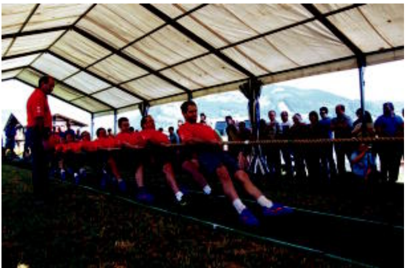
Izaskundarrak taldeak irabazi ziren Urnietari eta Oiartzuni sokatira lehia, Izaskun auzoan. MADDI SOROA

Izaskungen, hiru talderen arteko sokatira lehiak zabaldu zuen egitaraua: Izaskundarrak, Oiartzun eta Urnieta. Izaskundarrak izan ziren jaun eta jabe, beraien abilezia erakutsiz eta etxeko zaleen animoek lagunduta. «Talde guztiak oso ondo aritu ziren. Ordu eta erdi bi ordu inguruko festa polita izan zen, eta jende asko elkartu ginen, eguraldi onak lagunduta. Gero, afaltzera joan ginen denak Izaskungo jatetxera bertara», azaldu diote HITZARI antolatzailak. Datorren asteburuan jarraituko du festak Izaskungen.