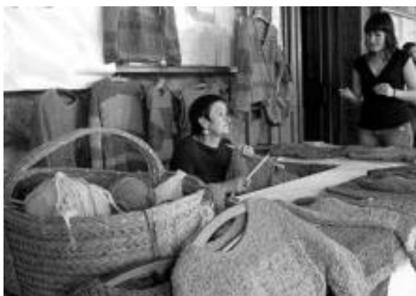
Jertseak. Maindarekizko zerrenda koloreztatuekin egindako hainbat moldetakoak. Hau ere lan eta lan aritu zen egun osoan. MADDI SOROA