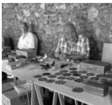
Marketeria. Lan eta lan, zurezko irudi desberdineko piezatxoak elkarri lotuz. MADDI SOROA