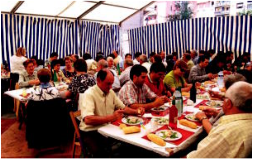
San Inazio auzoan bazkari legea egin zuten igandean, festen azken egunean. MADDI SOROA