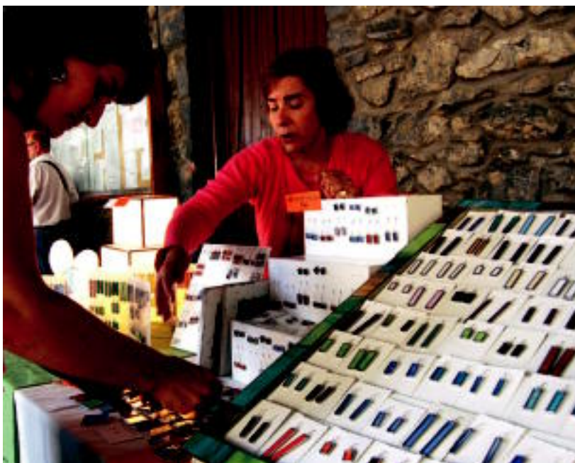
Pitxiak, saskiak, makilak, abarkak, kutxak, ukenduak, bidrierak... izan ziren ikusgai igandean. MADDI SOROA

LEITZA ▶ Euskal Herri osoko 28 artisauk lana eta langintza erakutsi zituzten igandean, eta ikusle franko bildu zen; herri afaria eta musika ere izan dira ▶ 7