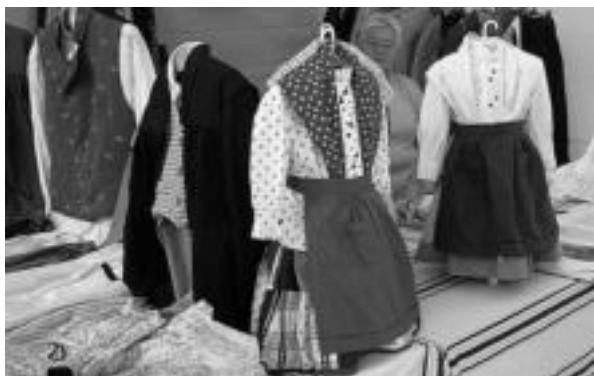
Euskal jantziak. Ume nahi helduentzat ere, eskuz jositako arropak: lortzak, bainnikak, kolore eta oihal mota desberdinez egindakoak. MADDI SOROA