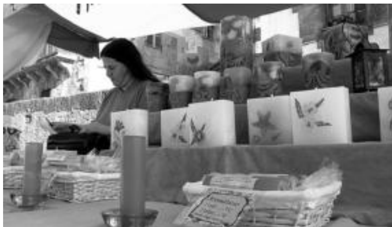
Argizaria. Argizaria, teknika desberdinez landutakoa, kolore eta usain aniztasunaz gain, landare lehorrekin konbinatuta ikusgai zegoen. MADDI SOROA