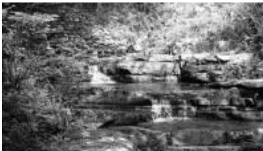
Atxulondoko presa ikusi ahal izango dute ibilbariek. JOXIN AZKUE

Ibilaldiak egingo dituzte ingurura, bihar