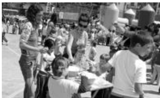
Atzoko arratsaldeko zirkotailerrean, nahikoa jostatu eta gozatu zuten Leitzako eta Aresoko eskoletako ikasleek. JAIONE ASTIBIA

Gaur, 18:00etan, Ateka Beltzan egingen dute aurreneko saioa, Gerra egosten den tokia bideoaren proiektioarekin, eta ondoren KEMeko kideek tiro-polygonoari buruz eskainiko duten hitzaldiarekin. Iluntzetik aurrera, festa giroa jabetuko da: Batugara perkusio taldearekin egindako kalejirarekin lehenik, Karrapean egingen duten herri afariarekin eta ondoren, hor bertan, Txaralde eta Khaus taldeak zuzenean eskai-