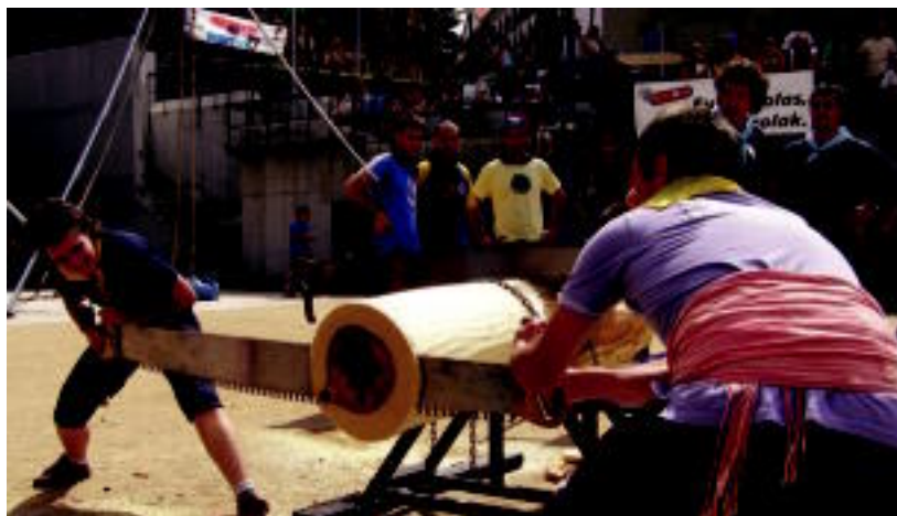
Ibarra bi taldekide, fin, trontzan; denera, 85 neska-mutiek jardun zuten lanean. HITZA

Idiazabal, Hernani, Katatxulo Gaztetxia eta Igeldo izan ziren gainontzeko taldeak. Denera, 85 bat neska-mutil aritu ziren nor baino nor. Zaldibia eta Egia falta ziren, eta bihar Elorrioren ariko dira. Ibilaldian egingo den Bizkaiko Topaketaren barnean, baina puntuaketa gipuzkoarren artean kontutan hartuko dituzte.