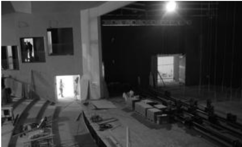
Alboetan palkoak ezarri dituzte, ikuskizunez ere bertatik gozatzeko aukera izango delarik. NOELIA LATABURU

Ekainerako lanak amaituko ez dituztenez, Usabalen egitea erabaki dute; aretoaren inaugurazioa irailaren 8an izango da