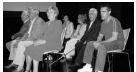
Ikastolaren bultzatzaileak, atzo, omenaldia jasotzen. I. GARCIA