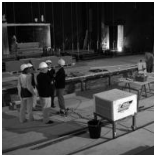
Eszenatokiaren muntaia egin dute, 5 metro gehiagorekin. N. LATABURU

Ofizialki irailaren 8an inauguratu dute, Euskadiko Orkestraren emanaldiarekin. Baina uztailaren amaierarako «lehen saioak» egin nahi dituzte eta «ate irekien jardunaldiak» antolatzeko asmoa dute, «herriarrek aretoaren txokoak gertutik ezagutu ahal izateko».