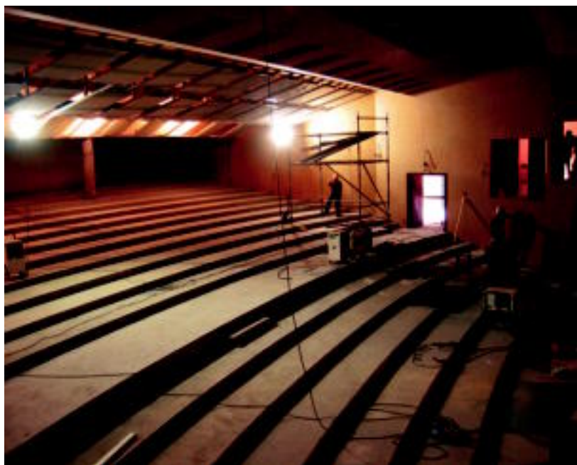
Leidorreko lanak, atzo; inaugurazioa baino lehen ate irekien jardunaldiak egiteko asmoa dute. N. LATABURU

TOLOSA ▶ Ekainerako lanak amaituko ez dituztenez, Usabalek hartuko du hitzordua; irailaren 8an egingo dute Leidor aretoaren inaugurazio ofiziala ▶ 2