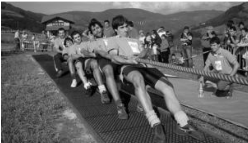
Sokatira lehiak emango die hasiera aurtengo jaiak. Irudian, ibartarren saio bat Izaskunen. HITZA

Bi asteburuetan banaturiko egitaraua izango da; bertso eta dantza saioak eta herri kirolak izango dira, besteak beste