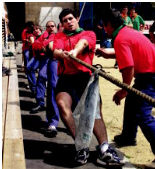
Sokatira izan zen beste probetako bat. HITZA