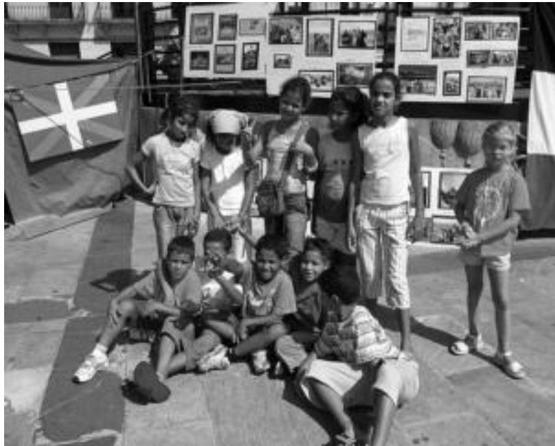
Ekitaldi ugari antolatzen dituzte haurtxoek oporraldi bikaina igaro dezaten; argazkian, iaz eginiko bat. i. t.

Interesatuak ekainaren 2a baino lehen eman behar dute izena; helburuak haurren osasun arazoetan laguntzea eta haien egoeraz jabetzea dira batik bat