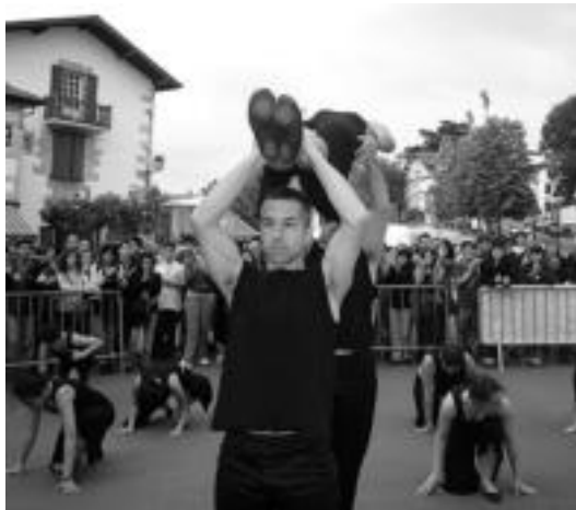
Ikusmin handia sortu zuten Saran. Irudian, Banako . HITZA

Euren dantzak herrian bertan erakustez gain, Ibarrako dantza taldearen helburua inguruko herrietan ere aritzea da. Ekainean, esaterako, bost saio eskainiko dituzte; ekainaren 3an Ibarrako Uzturpe ikastolan, ekainaren 4an Beasainen, ekainaren 5ean Izaskunen, ekainaren 18an Anoetan, ekainaren 25ean Tolosan eta ekainaren 29an Altzon. Abuztuan ere jarraituko dute lanean, eta Ibarran —atzetik datozenak ere dantzatuko dutelako berezia izango da— eta Berastegin, besteak beste, erakutsiko dituzte euren dantzak. Bestalde, inguruan aritzeaz gain, bertako kultura dantzaren bidez munduan zehar zabaltzeko asmoa ere badu Alurrek.