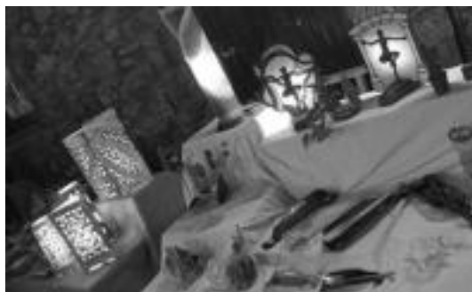
lazko artisauaren erakusketan, zeramikazko lanparak. J. ASTIBIA

datorren ostiralean bestea, «zirkoko jokoak: malabarak, oreka-jokoak eta, egiten ikas-teko» aukera izanez.