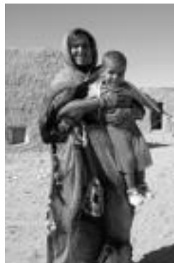
Tindufeko desertuan saharar emakume bat semearekin. i. t.

Izan ere, programa honen bitartez, eskualdeko familia guztiei Tindufeko errefuxiatu sahararren kanpamenduetan bizi diren 7 eta 12 urte bitarteko neska-mutilak hartzeko aukera eskaintzen zaie, «etxeko