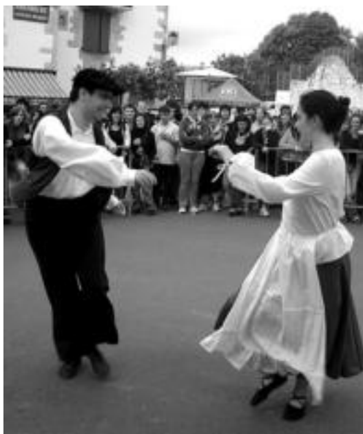
Fandango Arratia eskaini zuteneko une bat. HITZA