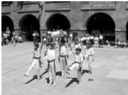
Umeentzako tailerrekin —iazko jokoetako irudia— ekinen diote. J. A.

Horrela, umeek egun pare bat izanen dituzte haien artean. Biharko Pinta eguna , hasteko: «Aire librean, pintaketan ariko dira, eta arropa zaharrek inotzea komeni», zehaztu dute; eta