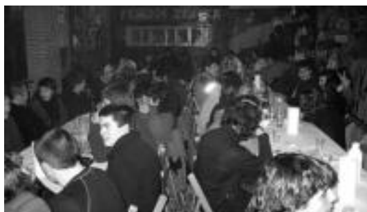
laz Alegian egin zen eta jendetsu. Irudian bazkariko une bat. HITZA

Azpieskualdeko bederatziz herriariko beste hainbeste gaztetxek edota gazte asanbladek antolatu dute egun beteko eta askotariko ekitaldiz hornitutako egitaraua; goizean eginen duten mendi martxatik hasi eta gaueko kontzerturaino. Villabonakoak eginen duelarik anfitrioi-tza edizio honetan, Amez-