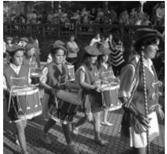
lazio Haur Danborradan ikusle asko izan ziren. HITZA

Ikasturte amaieran katekesiak egiten duen jaia bueltan da, herrian zehar bira egiteko