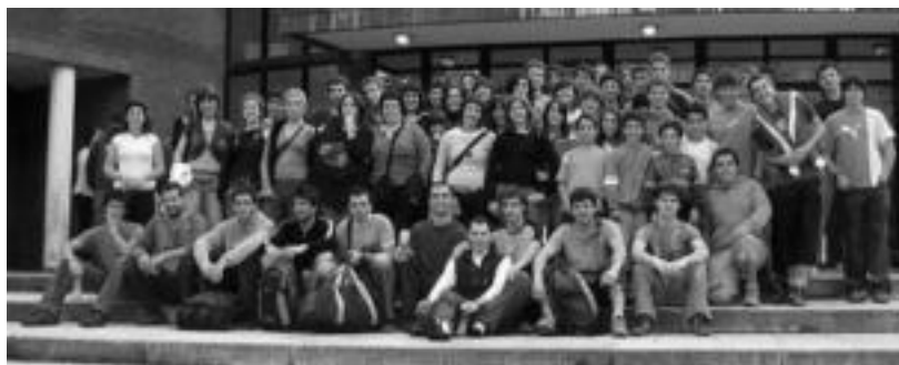
Anoetako futbol taldea 3. mailara igo egin da, asteburuan partida bat irabazi ostean. HITZA

Asteburuan lortutako emaitzekin eskualdeko talde bat 3. mailara igo da