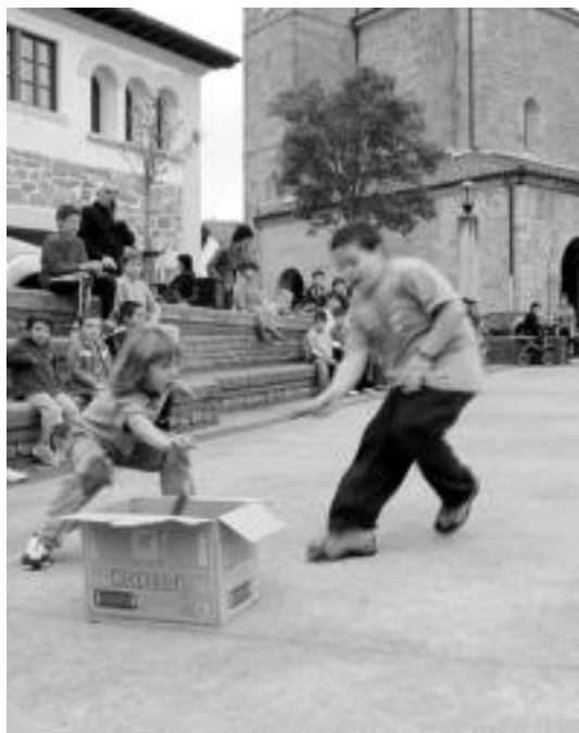
Alkizako plazan haurrentzako jolasak antolatu zituzten. N. URBIZU

Atzo arratsaldean etxeko txikienak izan ziren protagonistak, haiei zuzendutako hainbat ekitalditan gogotsu parte hartu baitzuten