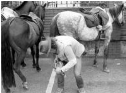
Perratzen. Zaldiek ere atsedenean oinak zaindu behar. N. U.