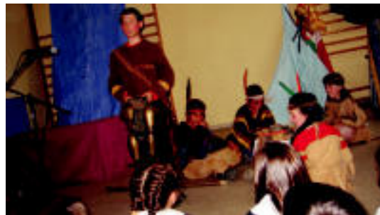
Edo amerindiaren berri ematen zuenaren modukoa. J. ASTIBIA