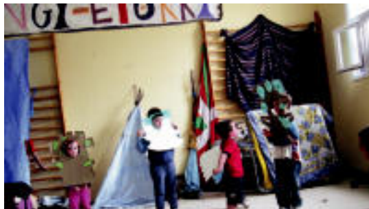
Izeia txikia moduko antzerki ttiki mordoska eskaini zituzten. J. ASTIBIA

▶ HITZAK ez du bere gain hartzen egunkariaren adierazitako esanen eta iritzien erantzukizunik.