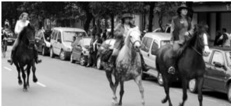
Neska zaldunak. Gutxiago baziren ere, hamar bat neska aritu ziren zaldi gainean paseoan. N. U.