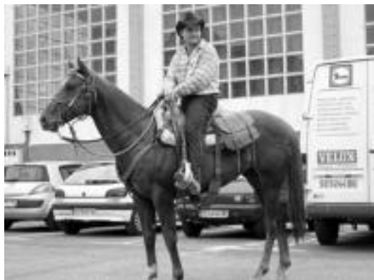
Atsedena. Bakeroen arropa, baina euskaldunen hamaiketakoa. N. U.