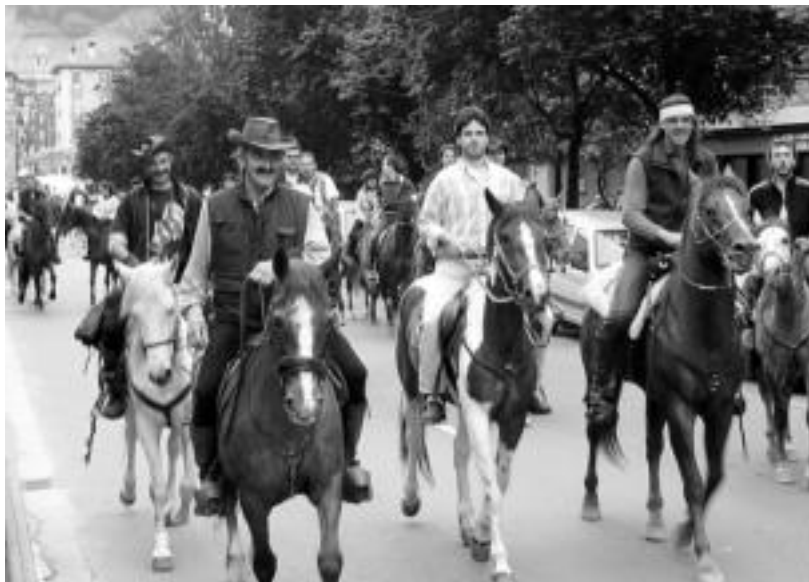
Tolosan. San Frantziskon 52 zaldunek harro asko erakutsi zituzten haien zaldia eta behorrak. N. URBIZU

Atzokoarekin, Gipuzkoan zaldiz ibiltzeko aukerak zabaldu egin zituzten, «ez baitago gaur egun aukera handiegirik kirol hau bertan praktikatzeko».