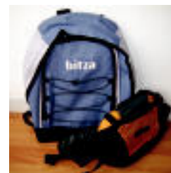
HITZAko gerriko poltsa eta motxila.

Monet pintore frantziarrak Notre Dame-ko katedralari eguneko ordu desberdinetan eginitako koadro ezagunak ekartzen ditu gogora Parisen jasotako irudi honek. Bidelaguna aukeratu eta bost eguneko egonaldia Asturiasen (Espainia) edo Costa Bravan (Katalunia) pasatu nahi duen aukeratu besterik ez du egin behar orain.