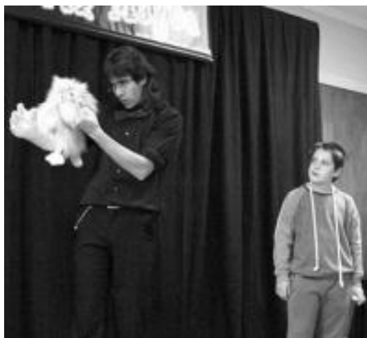
Eritz Magoak trebezia eta umorea erakutsi zituen. I. TERRADILLOS