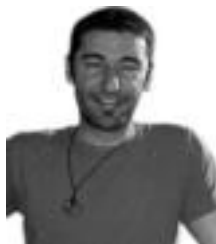
KIKE ZINKUNEGI 'EUSKAL HERRIA' ALDIZKARIA

«'Euskal Herria' aldizkarian hemen bertan jaialdi ibiltari bat egiteko asmoa genuen. Bidaia lantzen dugunez, kultur ezberdinetako jendea, musika, gastronomia... hona ekarri eta ezagutaraztea pentsatu genuen. Hala jaio zen 'Mundumira' jaialdia»