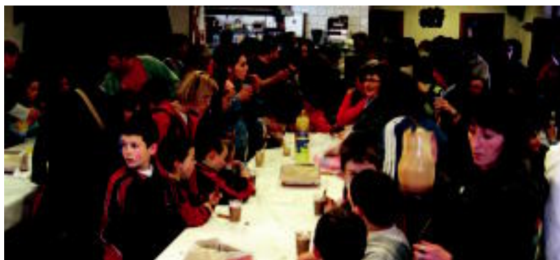
Egunari bukaera, umeez, gurasoek, irakasleek elkarrekin arratsaldekoa eginez eman zioten. J. ASTIBIA

ARESO ▶ Aresoko, Leitzako, Goizuetako eta Aranoko hurrek, gurasoek, eskolek, topaketa egin dute, Prebentzio Programarekin batera