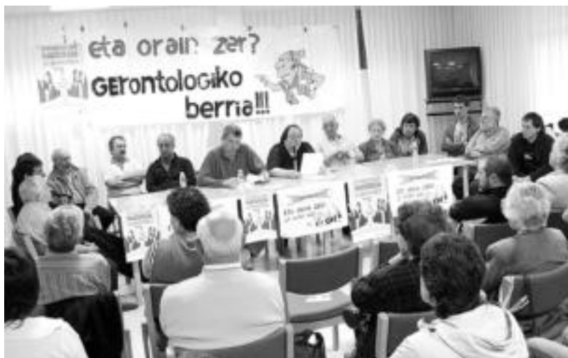
Hilaren 27an zentro berria eskatzeko manifestaziora deitu zuten atzo Tolosaldeko eragileek. JAIONE ASTIBIA

Agerraldian nabarmendu zuten, «arrazoia eskutik izanda, inork ez digu oker gabiltzanik esan inon». Hala, Gerontologikoaren Aldeko Plataformako kideek irtenbideak bi-