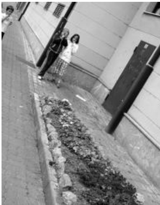
Irurako Argazki Lehiaketan udaberria eta loreak izan ziren gaiak. N. U.