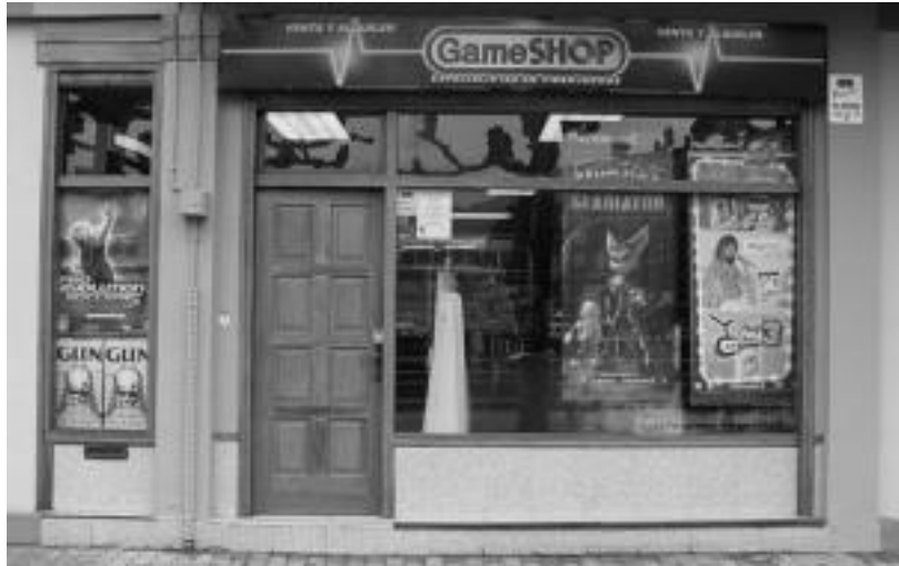
Urrats bat proiektutik jaiotako bideo jokoen denda bat da Tolosan dagoen hauXE. HITZA

Alberdik HITZARI azaldu dioenez, «egitasmo honi esker, orain arte bi enpresa berri sortu dira, biak ere, informatika arlokoak». Izan ere, bere usteetan, «errazagoa da horrelako