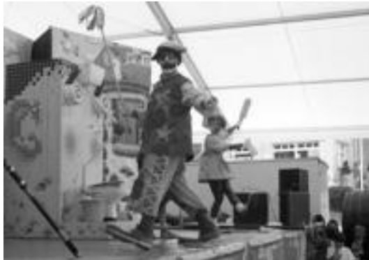
Bihar Pirritx eta Porrotx pailazoak izango dira, Bonberenean. I. GARCIA

Amigos de Cuba y p'Alante . Kultur Etxean erakusketa jarriko dute ikusgai, hil honen 22tik 27ra bitartean, Amigos de Cuba y p'Alante taldeak antolatuta.