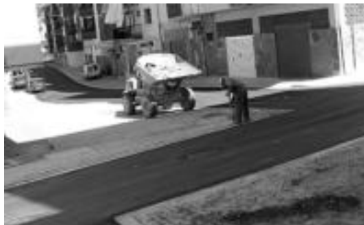
Asfaltaketa bukatuta, atzo garbiketara lanean aritu ziren langileak. J. A.

Eremu horretan 20 bat aparkaleku berri sortuko omen dituzte.