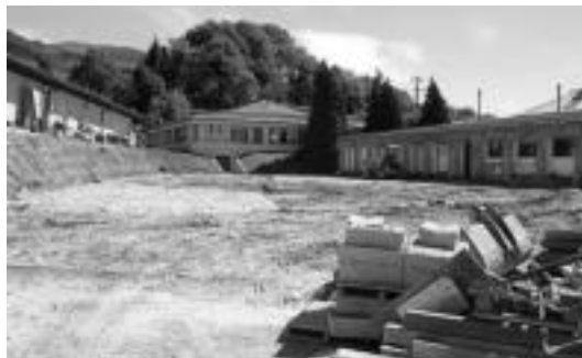
Igerileku atzeko eremua, aparkaleku berria egin behar dutena. J. ASTIBIA