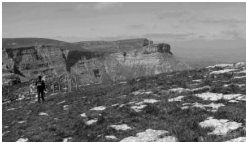
Mendizaleek topatuko duten irudietako bat: Ungino Tologorritik. HITZA

Aizkardi Mendi Elkarteak ibilaldia antolatu du igande honetarako Urduña eta Ahedo-Angulo bitartean