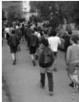
lazko ibilibidearen une bat. J. S.

Ibilbidean zehar mendizaleek kontroletatik igaro beharko dute, eta pasatutako denborak zehaztutako epearen baitakoa