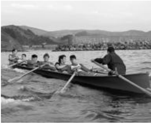
Senior mailako mutilak, entrenamendu saio batean . HITZA