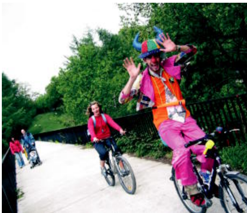
Urmeek pailazo talde batekin egin zuten Leitzako Estaziotik Erreka auzorako joan-etorria. J. ASTIBIA

PLAZAOLA ▶ Trenbide berreskuratuan ibilaldiak egin eta ekintzetan parte hartzeko aukera izan zuten ▶ 7