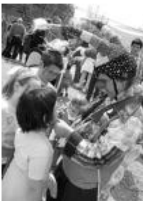
Jostaketa. Kirola eta hamaiketako eginda, jostaketak ere bere tarte izan zuen Bide Berdeen Egunean. Pailazoekin batera, Errekara joan eta han hainbat joko egin zituzten gazteboenek; Estazioan, berriz, makilaia tailerra izan zuten, goizean hedatzeak ziren golbo aerostatikorik ezean (haize gehiegigatik). J. ASTIBIA