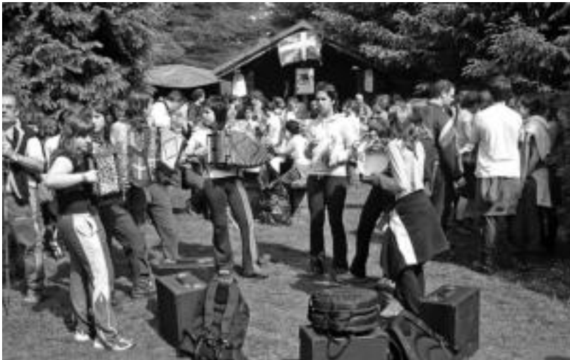
Trikitilarien doinuek ere ez zuten huts egin Andantza Egunean. JOKIN AZKUE

Usurbil eta Zizurkil herriak lotzen dituen mendi eremuan goiz-pasa ederra egin zuten bi herrietakoek herenegun