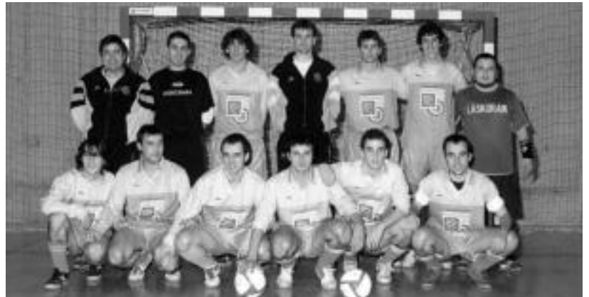
Laskorain taldeko futbolariak partidu baten aurretik, arriboko irudian.

3 eta 4ko emaitzarekin irabazi zuten horitxoek, larunbatean, Allerruren aurka jokaturako derbian