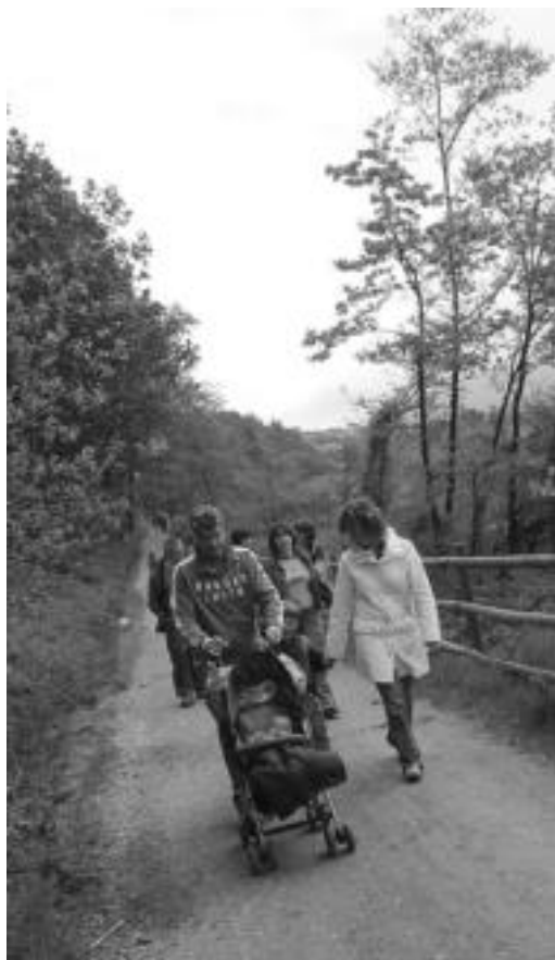
Oinez. Familia giroa nagusitu zen igandean Bide Berdeen Egunean. Udaberriko giro goxoa lagun, adin guztietako ibiltariak bete zuten egunari men egiten dion Plazaolako trenbidea. J. ASTIBIA