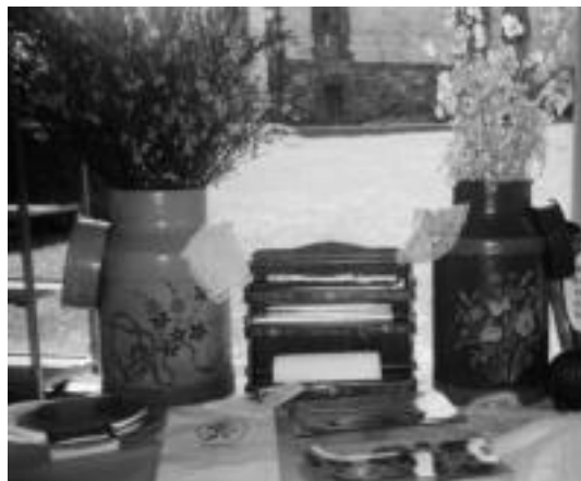
Lore saltzailea plazan egon zen. Urtean zehar ikastaroan Baliarraingo lagunek traste zaharrak ederki apaindu dituzte. HITZA