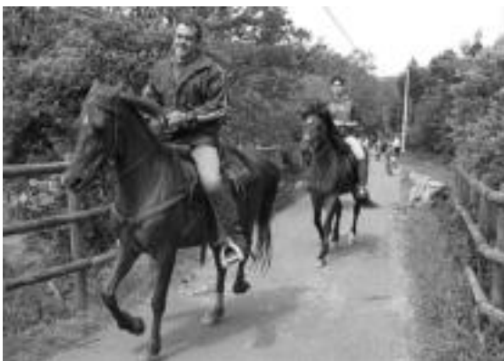
Beste aukerak. Bidea zaldiz nahiz birringaz egin zuenik ere izan zen. Hiru zaldizkoek ibilbide osoa egin zuten, hainbat birringazalek bezala. Hainbesteko ibilaldia egiteko oraindik ttiki samarrak izaki, beste batzuk joan-etorri motzaxeagoa egin zuten, baina itzulera luxe-luxe egiten da hala ere, aldapa gorantzzen baita. J. ASTIBIA