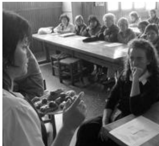
lazkoan bezala aurten ere sukaldaritza ikastaroa izango da. i. t.