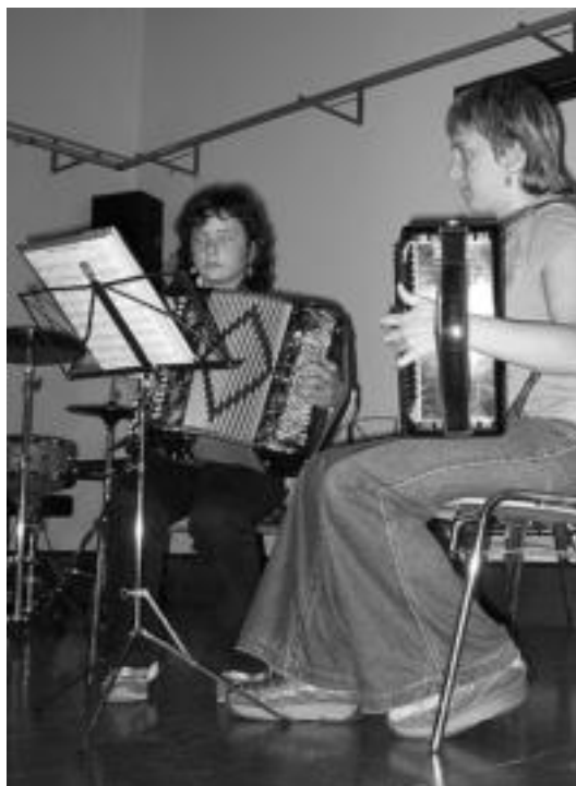
Instrumentu ugari entzuteko aukera izan zen, eskusoinua, tartean. I. G.

Zizurkilgo Maiatza Saltsan egitarauaren baitan, atzo Loatzoko musika eskolako ikasleek kontzertua eskaini zuten Atxulondo kultur etxean. Jende ugari joan zen eta aretoa guztiz bete zuten. Musika ikasleak bere instrumentuekin egiten ari diren aurrerapenak entzun ahal izan zituzten. Bestetik, Maiatza Saltsan baitan ere, gaur Umeen Eguna eta bihar Andantza Eguna egingo dira.