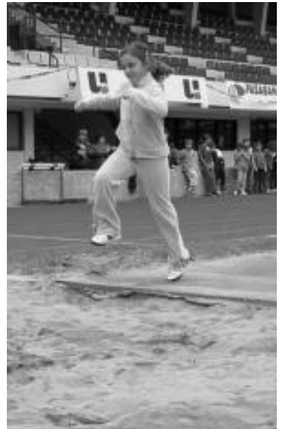
Luzera jauzian hondar gainera. Esfortzu handirik egin gabe ere, metro bat saltzera ailegatzeko ziren ikasleak. Saltatzeko zekitenek, ordea, bi metro eta erdira ere iritsi ziren. N. URBIZU