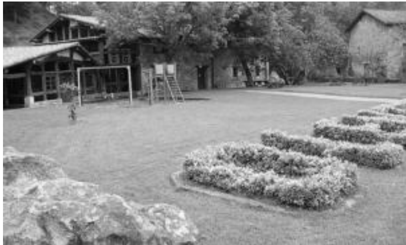
Olentzo jatetxeko lorategia arte erakuslehoio bilakatuko da ekainetik aurrera. JAIONE ASTIBIA

Eskulturgileentzat lehiaketa deialdia egin dute; lehenengo 10 sailkatuen obrekin erakusketa egingo dute Olentzon