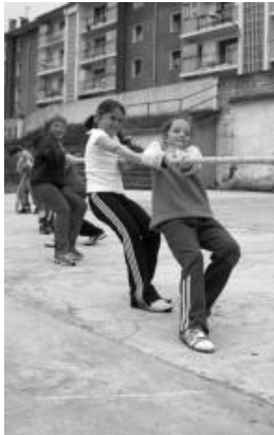
Sokatiran. Pilotalekuan sokatiran ere aritu ziren, adinaren arabera, eta alde bakoitzean talde ezberdinak jarri. Neskato hauen taldeak irabazi ez bazuen ere, saiatu, saiatu ziren. N. URBIZU