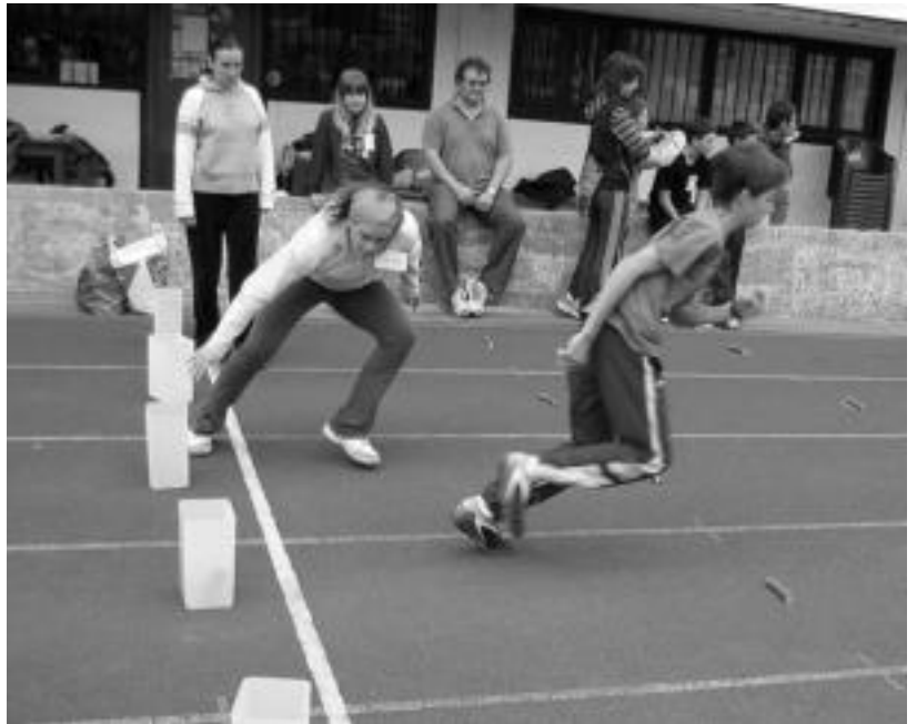
Lokotsak jasotzen. Atzokoan oskolak izan ziren zirkuitoan egin behar zituzten jolasen artean lehenengoa. Ondoren, korrikaldiarekin lotu egiten zuten, eskuan azken lokotxa harturik. Borrokatua izan zen proba hau. Irudian kozkorrenek jokatzeko agertzen badira ere, gazteboenek ere egin zuten proba neketsu hau. N. URBIZU

Ez da lehiaketa moduan egiten, baizik eta taldean jolasten eta inolako lehiakortasunik gabe. Ikasleek era honetara berdin disfrutatzen dutela azpimarratu nahi dute antolatzaileek.