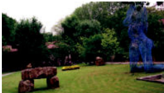
10 sailkatuen obrekir erakusketa egingo dute Olentzon. J. ASTIBIA

Eskulturgileentzat lehiaketa deitu dute ▶ 7