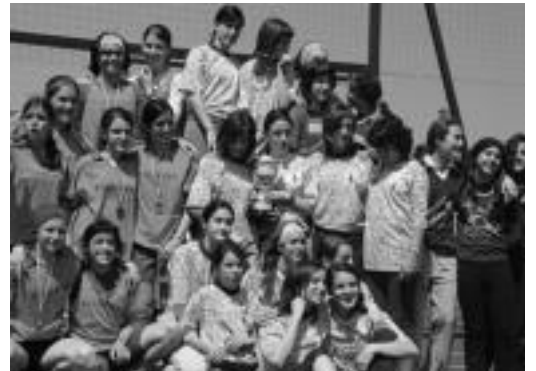
Orixe eta Hirukide ikastetxeetako korrikalariak. HITZA

Infantil mailako Eskolarteko Gipuzkoako Atletismo Txapelketa jokatu zen igandean