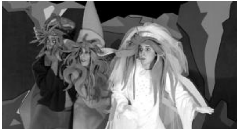
Xurdirin antzerki musikalaren irudia; Umeen Egunaren amaieran eskainiko dute. HITZA

Maiatza Saltsan egitarauaren baitan egingo diren ekitaldien artean, gaur Loatzo musika eskolako ikasleen kontzertua