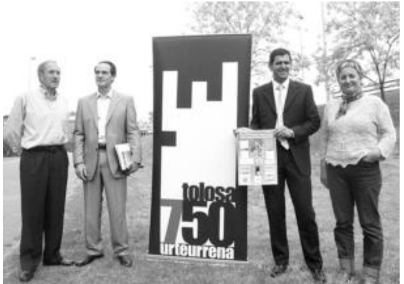
Donostian burutu zuten, atzo, aurkezpena Fundazioko eta Peña Olanoko ordezkariak eta Olanok berak. n. l.

Giro bikaina, beraz, ziurtatua dago egun honetarako; izan ere, Klasikoarekin batera, sega apustua izango da Iurreamendiko zelaietan.