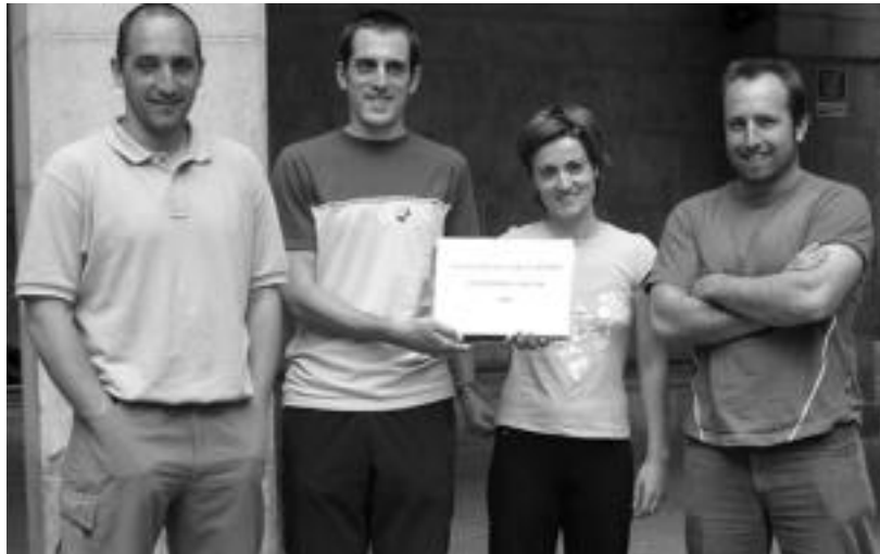
Kurkezpenean, Udaleko eta Hirukideko, Laskoraingo eta Anoetako ikastolako ordezkariak.

Eskolarteko Olinpiaden zikloari emandako etenaren ondoren, zentzu berri batekin jarraipena emango diete