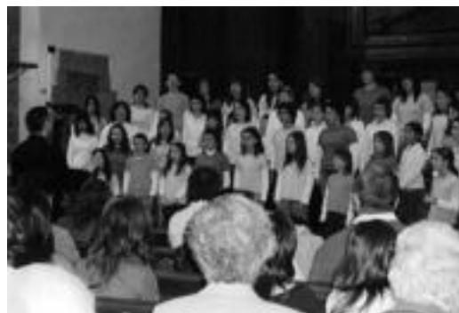
Asteburuan 3 abesbatzek elkarrekin abestu zuten elizan.