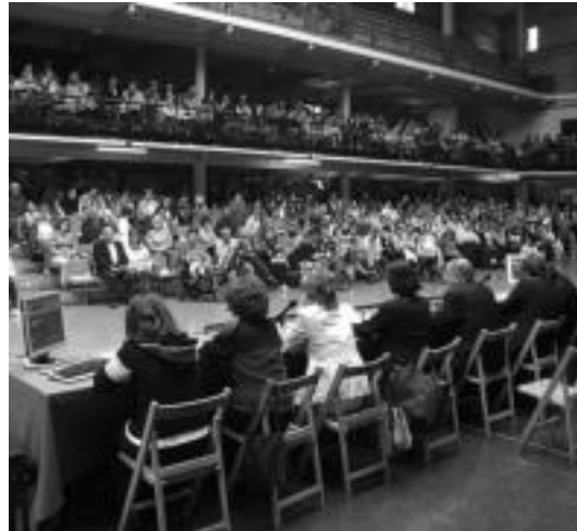
Etxebide ere izango dute hizpide; argazkian Etxebideko zozketa. i. r.

Gazteria sailak Kutxaren babesarekin antolatu ditu hitzaldiak, eta «egungo gazteen errealitatearen isla» izan nahi dute. Ogasuneko teknikari bat eta erregimen zibilak eta Etxebide izango dira aurrez aipatu bi hitzaldiak osatuko dituztenak, hil honen 11n eta 18an, hurrenez hurren. Horretarako, Eusko Jauriartzako ordezkari bat bertaratuko da. «Hitzaldiak herriko nahiz kanpoko gazteentzat baliagarriak izatea espero dugu».