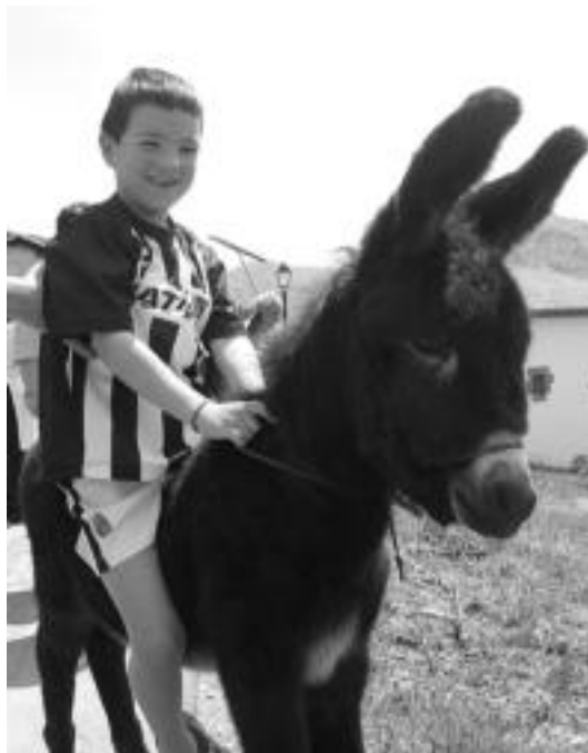
Astoeak eta astakumeak ere ez zuten hutsik egin atzokoan. I. T.

Indarberritzeko premia ere bazen, eta tabernan elkartu ziren, bertan egitekoa baitzen pintxo lehiaketa eta dastaketa. Iluntzerako, berriz, oilarraren igoerarekin jaiak agurtzea baino ez zen geratzen.