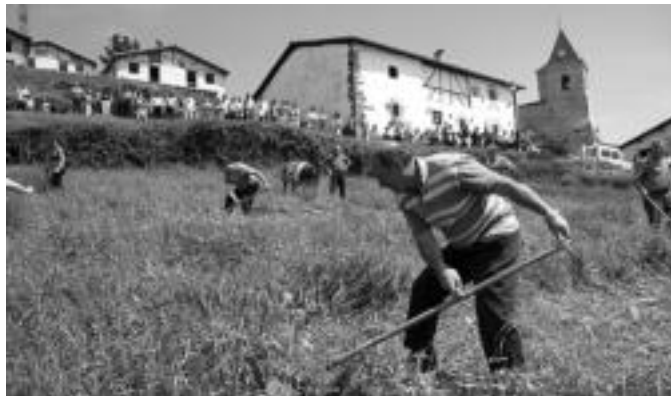
Jende ugari ikusi nahi izan zuen sega apustu berezia. I. TERRADILLOS