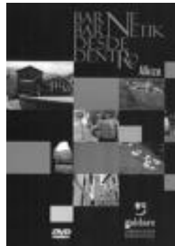
Alkizako DVDa. HITZA

samena eta DVDaren gidioia zehaztu zuen Galdareekin. Herriko historia, arkitektura, ohiturak, festak eta abar azaltzen dira, 25 minutu irauten duen grabaketan.