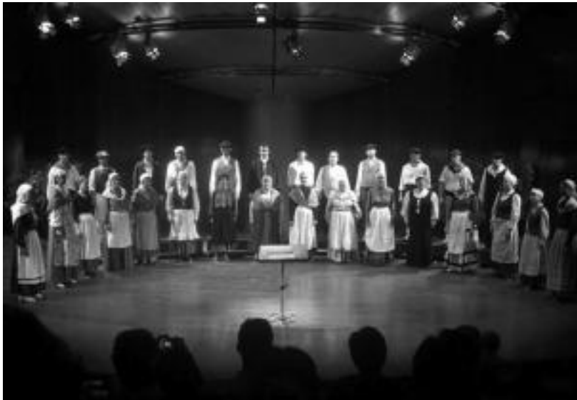
Hodeiertz abesbatza Bangalore hirian eskainitako kontzertuan. HITZA