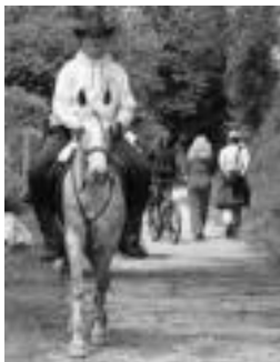
Zaldiz, oinez, birringaz... HITZA

Aurtengo bide berdeen eguna Leitzan eginen dute, hain zuzen ere, Estazioaren berreskurapena aldarrikatuko dutelako. «Leitzako geltokia hondamen egoeran dago, eta gune hau ere berreskuratu daitekeela erakutsi nahi dugu. Orain arte, bertan dauden eraikinen jabegoa auzian zegoen, baina jada hori argitu da; Nafarroako