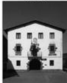
Alkizako mapa. HITZA