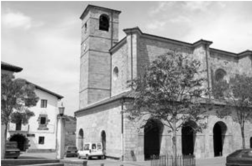
Alkizari buruzko datuak biltzen dituzte argitalpenek; argazkian, herriko eliza eta udaletxea.