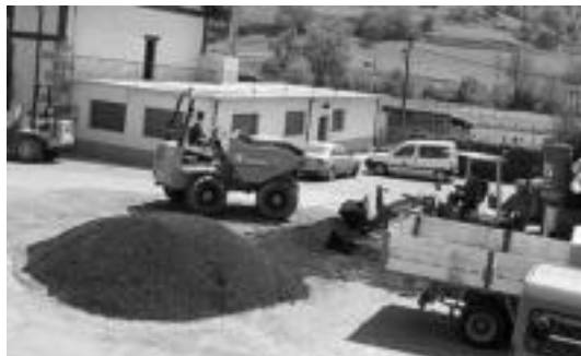
Atzo eguerdian, makinak lanean, brea garraiatzen. JAIONE ASTIBIA

Gereñone-Pedrone eta Txuine-Santuru aldeko bideetan brea botatzen ari dira