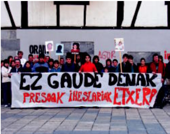
Eutsi gogor! Jo ta ke!