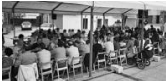
Bazkariaren ostean, kantu saioa egin zuten parte hartzaileek. HITZA

Xepla taldea izan da txapelduna, eta atzetik sailkatu dira Uzturpe B eta IKE A; «harrera ona» azpimarratu dute