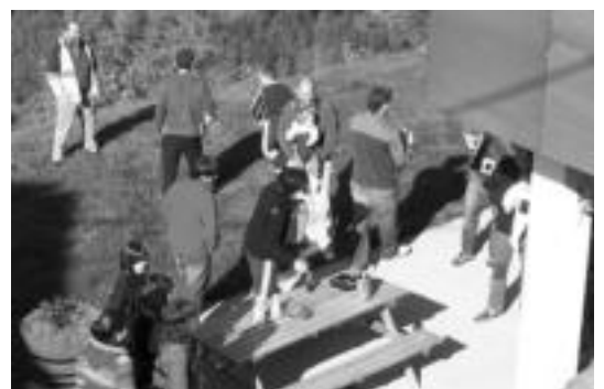
Goian, parrandako une bat. Behean, sagardo probaketa. ENEKO MAIOZ