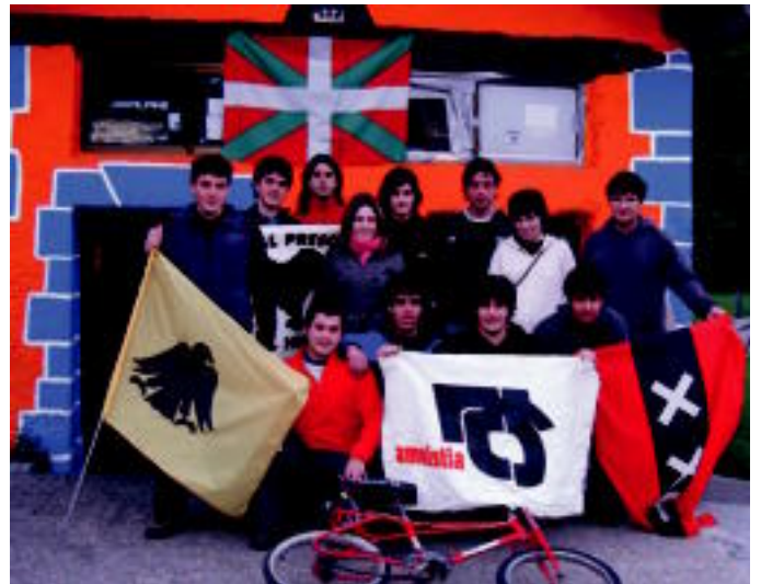
Zorionak, Punkarro! Hire kementa gure garaipena.