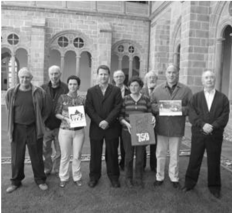
Atzo aste osoko ekitaldien berri eman zuten «marko paregabean»: Donostiako San Telmo museoa. N. L.

Aste honetan egingo den Donejakue barrualdeko ibilbidea eta XVII. Lore eta Landare Azoka aurkeztu dute, Tolosa 750. urteurrenaren agendaren baitan