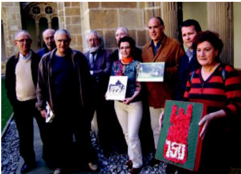
Donostiako San Telmo museoan aurkeztu zituzten atzo aste honetarako antolatutako ekitaldiak. N. LATABURU

AZOKA ▶ Berdura plazak hartuko du, larunbat goizean; 4.000 krabelinez estaliko dute urteurreneko logoa ▶ 2