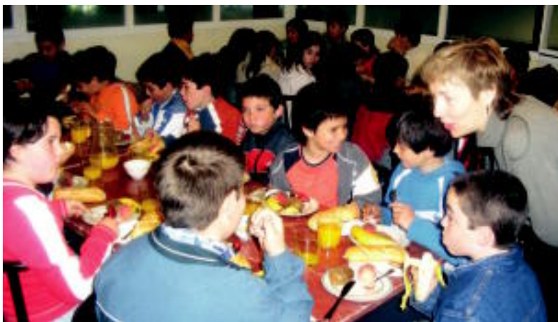
Goizean gosari osasuntsuarekin hasita, egun guztirako kemena ziurtatuta dute gaztetxo hauek. HITZA

TOLOSA ▶ Laskorain Ikastolako 5. mailako ikasleek Gosari osasungarria programa burutu dute Zubietako Merka Bugati fruta eta barazki merkatuan