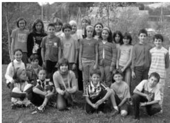
Ekzer-eskuin eta goitik behera, bertsolaritza eskolak jasotzen dituzten Samaniegoko, Jesusen Bihotzako, Hirukideko eta Laskoraingo hainbat ikasle.