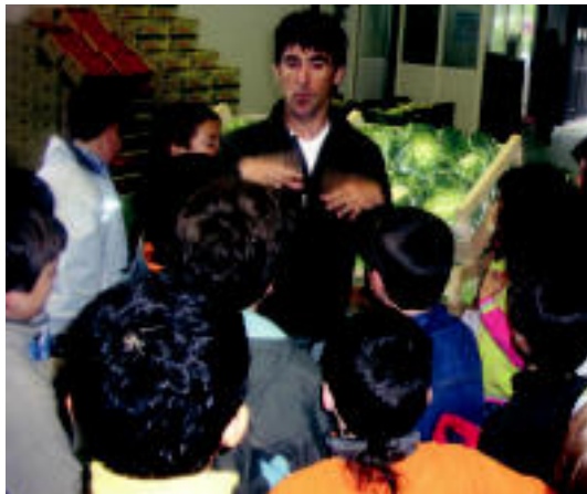
Merkatuko arduradunaren azalpenak adi jarraitu zituzten. HITZA

Hori ikusita, eta Ingurumena asignaturan Elikadura eta osasuna gaia landu berria zutenaz baliatuz, Laskorain Ikastolako 5. mailako ikasleek, euren irakasleekin batera, Donostiako Zubietako Merka Bugati fruta eta barazki merkatu zentralerako Gosari osasungarria izeneko saioa burutu zuten lehengo asteartean.