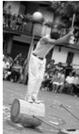
Rekondo aizkoran eta Urrutia harri jasotzen, asteburu kiroltsua. J. A.

Edozein moduz, estutzen saiatuko dela ere esan du; izan ere, bera ere nagusiekin lehiatu da orain arte txapelketa honetan, eta prestaketa ona eginda dago. Lanei dagokienez, bere ustez «oraingo hauek erosoagoak dira, zutik ez dugu ebaki beharrik eta horrek nekea ere gutxiago izatea eragiten baitu». 45 ontzako enborra ahalik eta kolpe gutxienean ebakitzea; beste 45 ontzako bat, ahalik eta azkarren; 60 ontzako ere erlojuz kontra; eta bukatze-