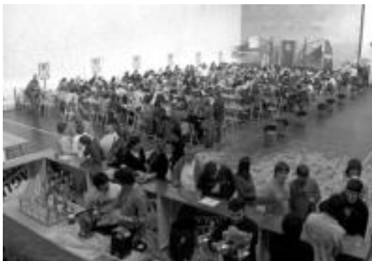
Jatorduetan jende asko bildu zen Alegiako frontoira.

Ostiralean 03:00ak arte egon ziren pilotalekuan eta larunbatean 02:00ak arte. Han sortutako giroa ona izan zen, eta antolatzaileek esan duten moduan, «ez da liskarrik ez tentsio unerik ere egon; jendea gustura ibili zen, eta antolakuntza aldetik ere arazorik ez zen egon».