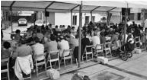
Iazko bukaerako bazkaria. Aurturaren egunaren dute. HITZA