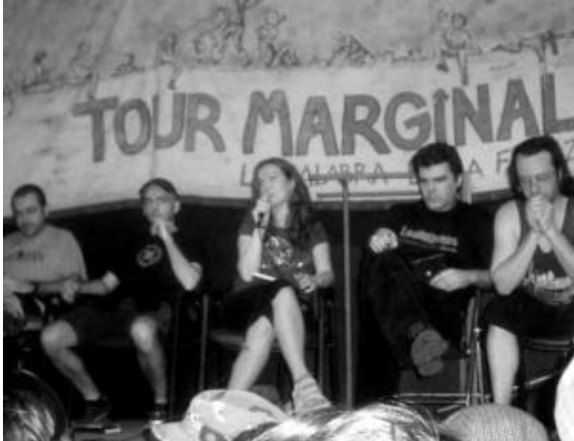
Skalariak taldeak Txiletik egin berri duen biraren une bat; gaur Tolosako Bonberenean ariko dira.

Gaur, 22:30etik aurrera, eskainiko du taldeak Gipuzkoan egingo duen birako lehen aurkezpen kontzertua