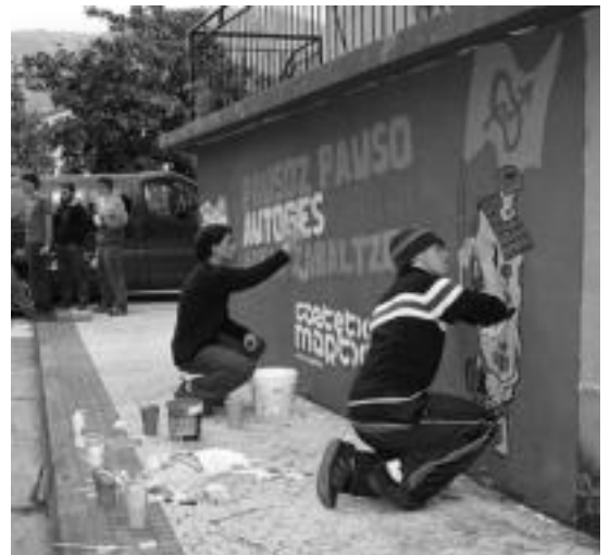
Muralak. Ibarrako Gaztebearen parean murala margotzen jardun zuten arratsaldean zehar, bizikletaz zetorren jendea itxaron bitartean. Murala bukatu ostean, Tolosara abiatu ziren, Trianguloan Bonberenea txaranga eta Mulanbo perkusio taldearekin kalejira egiteko. N. URBIZU