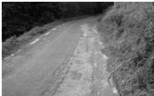
Errepidearen zorua egoera kaskarrean dago. I. GARCIA

Diputatuen Kontseiluak onartu du proiektu honen obrak egiteko eskaintza, 2004-07ko Aparteko Planaren baitan. 811.000 euroko aurrekontua izango du, eta lau hilabete epea obrak burutzeko.