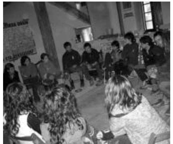
Bilera. Oraindikoa Gaztetxe Marxka izandu den gaztebe berri jaso zuten Leitzako Atekabeltzen bildutakoek. «Herriz herriko errealitateari erantzunez, ezaugarri amankomunak dituzte. Eta herrian murgiltzea oso garrantzitsua da denontzat», baieztatu zuten. J. ASTIBIA