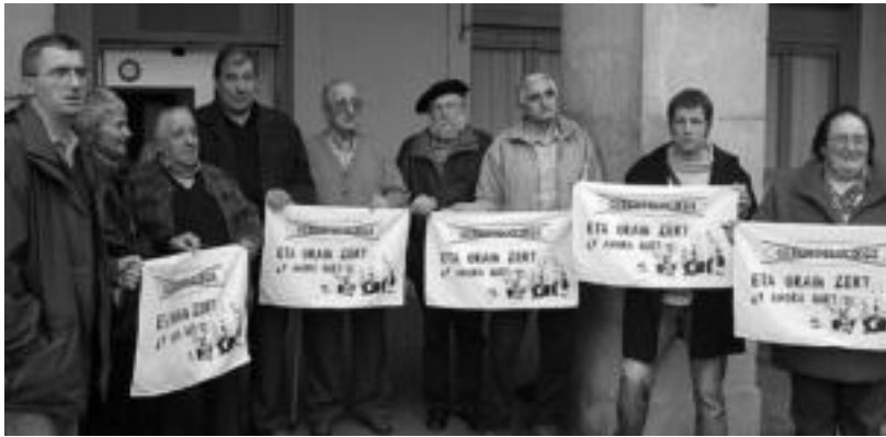
Tolosako Gerontologiko berriaren aldeko plataformako partaideetako batzuk. NOELIA LATABURU