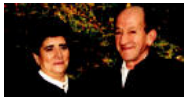
ZORIONAK Zorionak eta bustiko degu. Ondo pasa zuen seme-alaben partetik eta, batez ere, iloba guztien partetik.

Mesedez, ekarri argazkia bi egun lehenago ondoko leku hauetako batera. Mila esker.