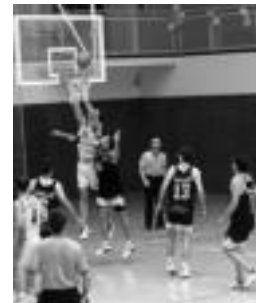
TAKE Aralar, Astigarragan.

Leioakoek talde altua dute oso, bi metrotik gorako jokalaria ugari dituzte, eta errebotean min handia egun zuten. Hala ere, aurkariak lan gutxi eman zieten etxekoei.