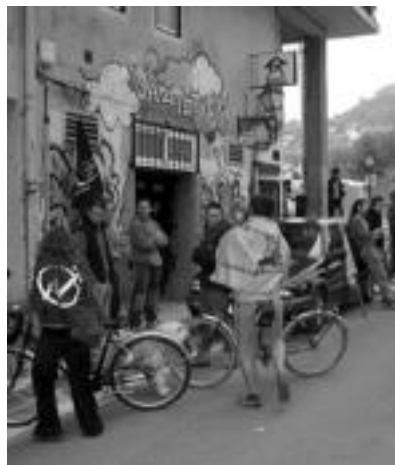
Ibarrara. Tolosako San Blaseko lokalean mokadutxo egin ondoren, Ibarrako Gaztebera joan ziren bizikletaz eta furgonetaz. Bertara, eskualdeko herri ezberdinetako gazteak bildu ziren. ESTI ZEIZA