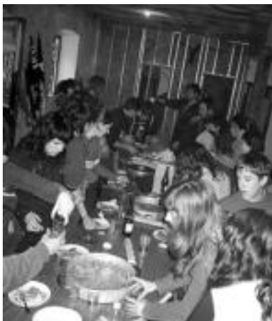
Gosaria. Marbarekin helburuetako bat «harremanak sortzea» izanik, elkar ezagutzeko bide bat bada, mahai inguruko ere, eta halaxe egin zuten Leitzan, bilera eta gero: hamaiketako egin. J. ASTIBIA