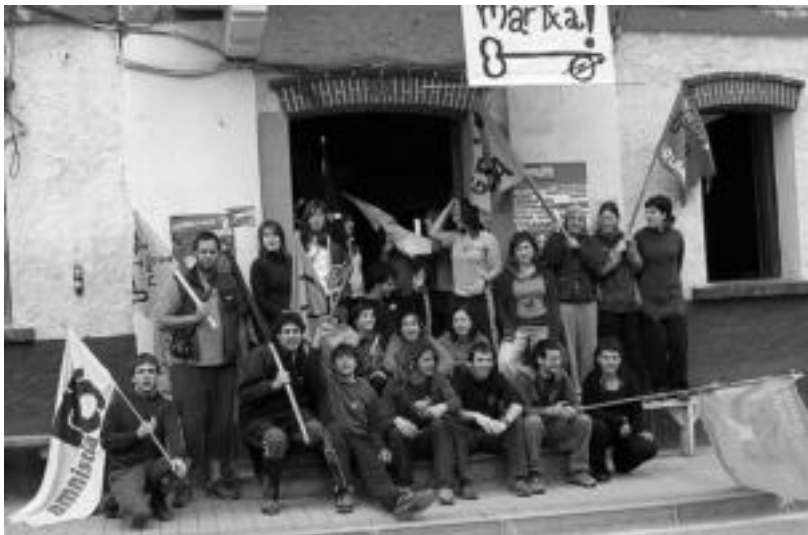
Leitza. Atzo goizean ailegatu zen Gaztetxe Marxka Leitzaldera. Sei gazte zetozen gaztebez gaztebe; Atekabeltzen zain zituzten bertakoak eta Goizuetako hainbat gazte ere. Marxkak zeharkatu dituen beste gaztebetako esperientziaren eta lanaren berri jaso zuten. JAIONE ASTIBIA