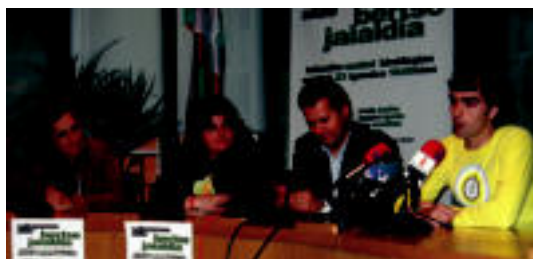
Atzo Tolosako udaletxean eginiko aurkezpen ekitaldia. ESTI EZEIZA

TOLOSA ▶ Bertso jaialdia antolatu du igandean Usabal kiroldegian Tolosaldea Sahararekin elkarteak ▶ 2