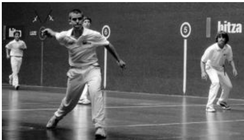
laz Hitza Pilota Txapelketako infantilen finala Beotibarren jokatu zen. JOXEMI SAIZAR