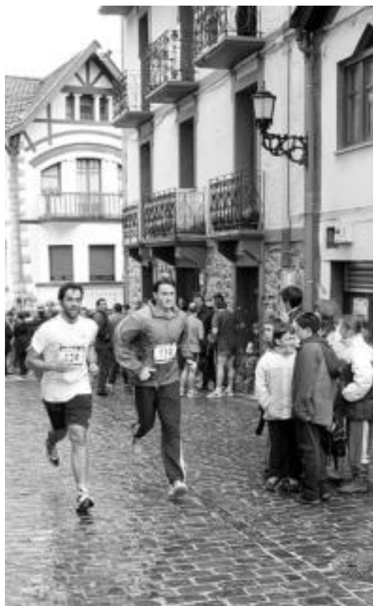
Herriko kaleetatik zehar igaroko dira korrikalariak.

Festak arratsaldean ere ja- rraitzeko, bazkaria antolatu dute Iruso jatetxean, 14:30ak aldera. 25 euro balio du eta Pe- ritzta eta Gaztañaga tabernatan eros daitezke txartelak. Gaur da azken eguna horretarako.