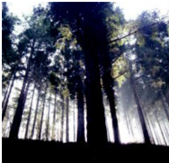
Douglas izeiak piano bateko tekla gutxien artean lodiena dela iduri du: hura besarkatzeko gutxienez bi pertsonen beharra da. » URBIZU

Merezi du leku hauek bisitatzera joateko: naturak eskaintzen dituen artelanek ez dute ikustera joateko arbolaren beste hosto bat bere erortzeaz inportante merezi.