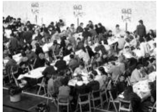
Jende asko bildu ohi da afarian, Alegiako pilotalekuan. HITZA