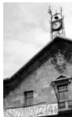
Ikurrinik gabe ageri zen. J. A.

2004ko azaroan, udaletxeko balkoian ofizialki zegoen ikurrina kendu zutenetik, hainbat aldiz azaldu da jarrita ikurra, masta hutsean, eta beste hainbestetan kendu izan dute. ◀