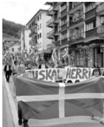
Leiza. Txistularien soinuak, manifestazioa eginez zeharkatu zuten herria ekitaldiaren aurretik. J. ASTIBIA

Aldarrikapen irakurketekin batera festa ikututa ere izan zuten egunak, noski. Esate baterako, halaxe egin zuten, Adunako plazan, 50 bat lagunek: txistularien eta herriko dantzarien laguntzarekin, ikurrinari Agurra dantzatu zioten eta ondoren hamaiketako egin zuten. Villabonan beste hainbeste egin zuten 86 lagunek. Kasu honetan baina, udaletxeko balkoia erabiltzen ez zieten utzi, eta plazan egin zuten. Tolosan, beste 100 bat lagun elkartu ziren Plaza Zaharrean. Leitzan, berriz, aurrena manifestazioa egin zuten herrian barrena 98 lagunek eta ondoren plazan burutu zuten ekitaldia, hamaiketakoarekin bukatzeko.