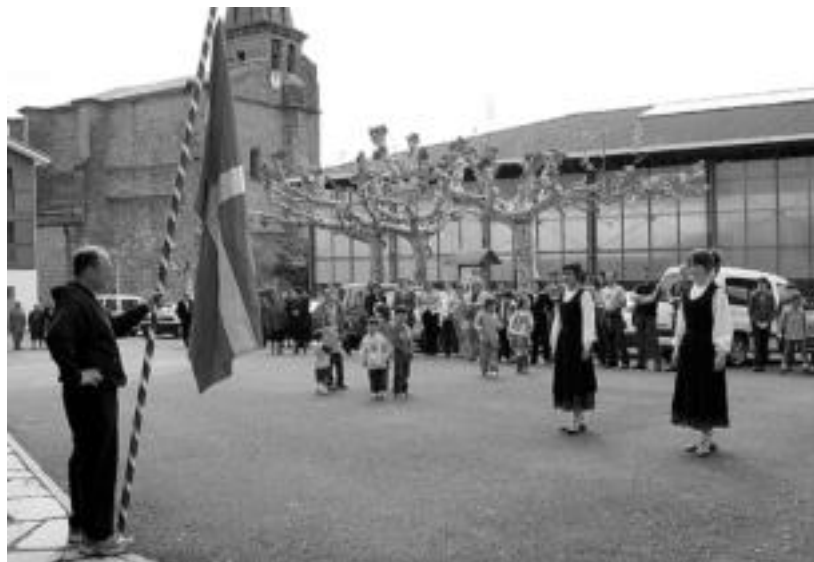
Aduna. Herriko plazan egin zuten ekitaldia. Aurretik EHNaren tramitazioa egiteko aukera izan zuten. Dagoeneko, 72 lagunek egin dute euren euskal herritartasunaren aitormena. HITZA

Tolosaldean eta Leitzaldean askotariko ekitaldiak egin zituzten igandean, Udalbiltzaren deia jarraituz