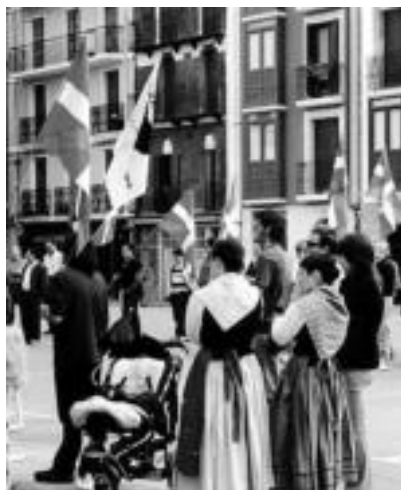
Villabona. Ikurrinekin batera, presoen Euskal Herritarzearen aldeko ikurrak ere baziren. L. ETXEBERRIA