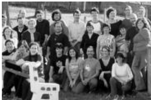
Tolosako Hodeiertz abesbatzako kideak.

Emanaldian euskal folkloreko zortzi pieza jo zituzten, horien artean Maitia nun zira P.T. Etcahunen abesti ezaguna, eta Mikel Laboaren Nerea . Bestetik, gaur egungo nazioarteko lanak ere abestu zituzten, bes-