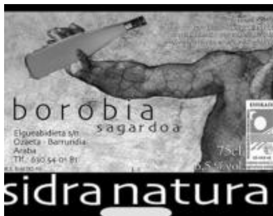
Etiketaren gainean dagoen sagardoa ekologikoa dela. HITZA

Duela zazpi urtetatik ari dira sagardoa egiten; orain dela hamar urte inguru hasi ziren pixkanaka sagarrondoak landatzen. Lehen uztak oso txikiak izan ziren, sagardo botila gutxi batzuk egiteko lain ematen zutenak. Hala ere, apurka-apurka uztak handitzen joan ziren. Oraindik ere, urtetik urtera