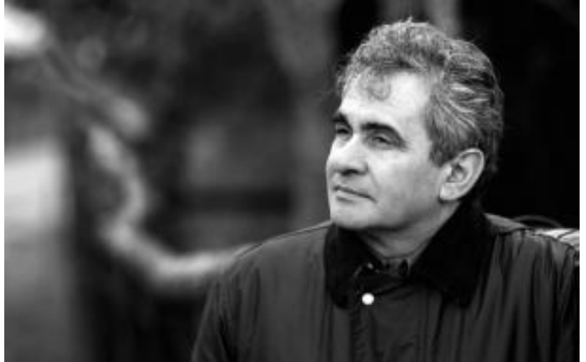
Bernardo Atxagak euskararekiko beste lotura bat izango du aurrerantzean.

Hainbat liburu argitaratu eta sari jaso ditu Atxagak bere ibilbidean. Eleberria, poesia eta haur eta gazte literatura jorratu ditu. Ondokoak dira adibide: Ziutateaz I eta II (1976), Etiopia (1978), Obabakoak (1988), Gizona bere bakardadean (1993), Xola eta basurdeak (1997), Banbuloren istorio banbulotarrak (1998), Groenlandiako Lezioa (1998), Soinujolearen semea (2003) eta Lekuak (2005). Sariak ez dira nolatanahikoak izan; besteak beste: Euskadi Saria, Espainiako Literatura Sari Nazionala, Kritika Saria, Eusko Ikaskuntza Saria eta Beterriko Liburua.