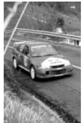
lazio Ikasberri Rallysprinta.