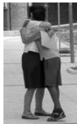
lazio etorrerako irudia.

Saharako herritarrak Algerian, Tinduf aldean jarritako kanpamenduetan bizi dira