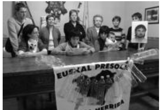
Lizartzako Etxerat-en prentsaurrekoko une bat, herenegun.

Martxoaren 20an ekin zion gose grebari preso politiko lizartzarrak