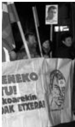
Aske geratzekoa bazen ere, ez zen Aizpurren berrikeri izan. HITZA

Hala, bi estatuetako gobernuak EPPKak «tratu duin eta begirunezkoa jasotzeko esku-