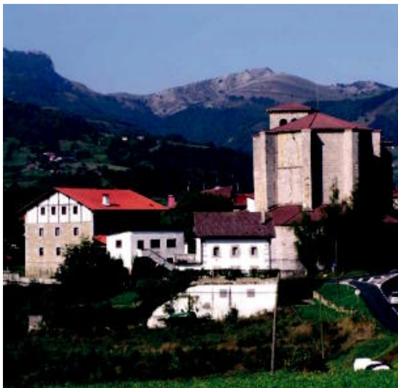
Zizurkilgo kaskoak gaur egun duen itxura. J. AZKUE

HELBURUA ▶ Joxin Azkue egilearen esanetan, «herriko memoria bisuala» jaso nahi du lanak ▶ 4