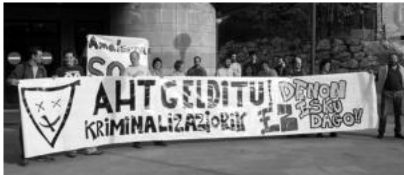
AHT Gelditu! Elkarlaneko kideak, atzo, protesta egiten, Tolosako epaitegiaren aurrean.

Otsaileko epaietan gertatu bezala, atzo ere ez zen salataria agertu; kanpaina berria du martxan AHT Gelditu! Elkarlanak