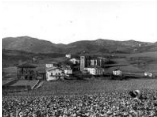
Zizurkilgo kaskoa, 1914an ateratako irudi batean.