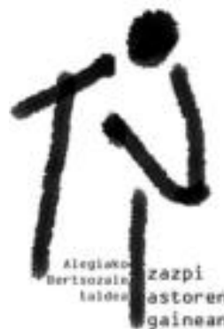
Txapelketaren iragarlea. HITZA

Norberak eramango du bazkaria, eta elkarrekin bazkalduko dute guztiek pilotalekuan.