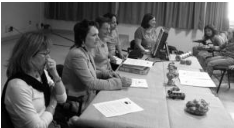
Kolonbiako eta Samaniego ikastetxeen ordezkariak, atzo arratsaldean, senidetze ekitaldian. N. LATABURU

Samaniego eta Guillermo Leon Valencia ikastetxeen arteko anaieratze ekitaldia burutu zuten atzo; Kolonbiako Vital Fundazioak bere proiektua aurkeztu zuen