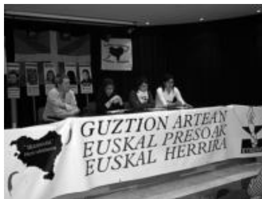
Herenegungo hitzaldiko une bat, Kultur Etxean.

Jarraian, herriko preso politikoei omenalditoxa eskainiko diete, 21:00etan Sendi Ekitan egitekoa duten kantu-afarrira joan aurretik —antolatzaileek adierazi dutenez, oraindik ere txartelak salgai badaude Zubiaurre eta Atari tabernetan—. ◀