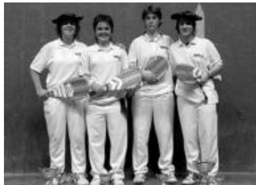
Manzisor, Arozena, Evaristti eta Urkizu, finalean. HITZA

Eskualdeko bi neskek jokatu dute Gipuzkoako Txapelketako finalean