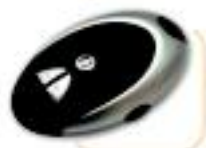
Esku libreko kita