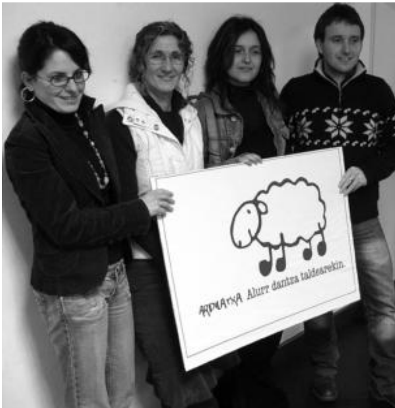
Alurr dantza taldeko ordezkariak, Ardi Latxa kultur elkarteko kidearekin. I. TERRADILLOS

Txileko gaztandegi bat lagundu ostean, Ibarako Alurr dantza taldearen proiektu berria sustatuko du orain Ardi Latxa kultur elkarteak