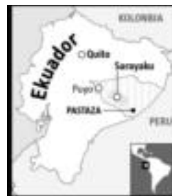
Inguruaren mapa. HITZA

Hurrengo goizean, ostegunean, enbaxadara eraman zituzten aurrena, eta «ia-ia hegazkineraino» gero. Airepor-