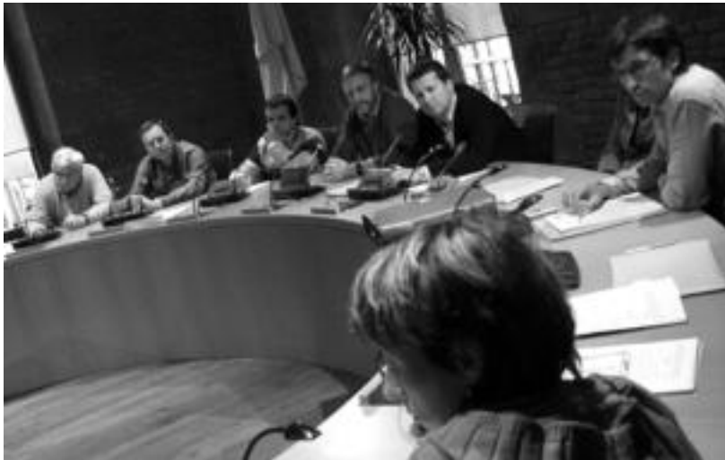
Udaleko kideek galderak egiteko aukera izan zuten, arduradunen azalpenen ostean. N. LATABURU