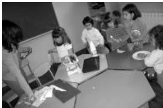
Txokoak ezagutzen eman zuten lehen saioa umeez. JAIONE ASTIBIA

Euskara Zerbitzuko teknikariak adierazi duenez, bestalde,