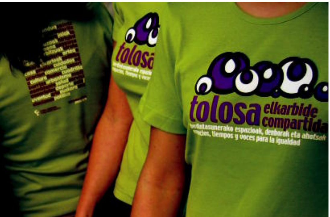
Hauek dira Tolosako Udalak Emakumearen Nazioarteko Egunean egindako kamisetak. I. TERRADILLOS

TOLOSA ▶ Gero eta emakume gehiago ikusten da 'Tolosa elkarbide' lelodun kamiseta berdea jantzita, hiriko «espazioak eta denborak orekatuak» egoteko