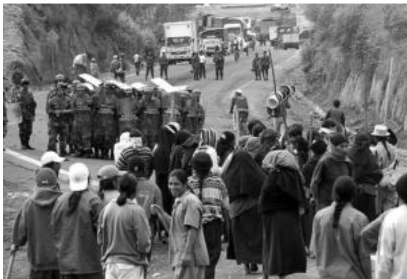
Ekuadorko militarrek eta indigenak, aurrez aurre, protesta batean, marxoaren 23an.