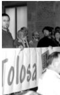
TBekoek protesta egin zuten. N. L.

Bestalde, Gorostidi-Voith eremuko alegazioak ebatzi zituzten, eta toki-babeseko etxebizitzaren erregimen juridikoa arautzeko oinarrien eta eremu