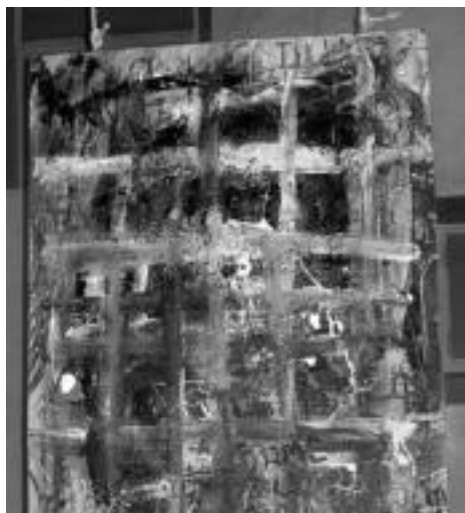
'Al otro lado de la cara'. Pintura plastikoa da, egur gainean egindakoa. ESTI EZEIZA