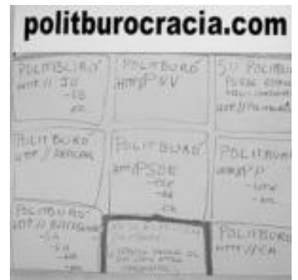
'Politburocracia.com'. Teknika mistoak mihise gainean. Politburo : sistema politikoa itxietan agertzen da organismo hau. «Bere zibilbor ederrera begiratzea asko gustatzen zaio. Normalean buruzagi edo batzorde nagusi bat dago buruan. Antonomiak: demokrazia, gizarte zibila». ESTI EZEIZA