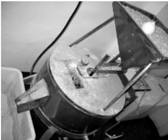
Errotan, harrizkoa, hasten da katea: artaleak ezari-ezarian erortzen dira eta tranka-tranka, artirina fin-fin ehoa ateratzen da. Taloen lehengai garratzitsuen. JAIONE ASTIBIA