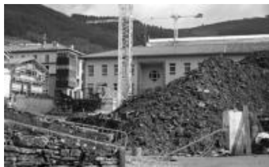
Goian, Danboliñene baserri ondoan kokaturiko aska eta iturria; behean, aska bota duten unearren irudia.