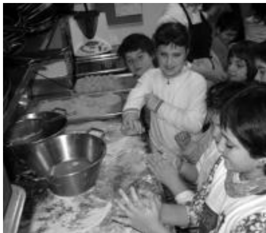
Kroketak egiten aritu ziren ikasleak. HITZA