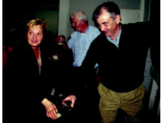
60 bat lagun elkartu ziren Asteasuko Sarasola sagardotegian.