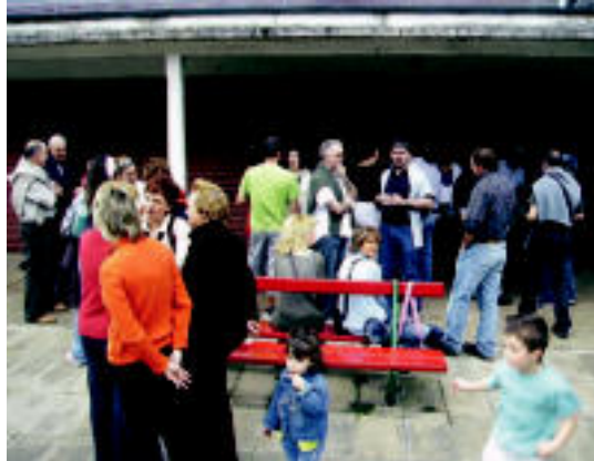
Kultur eta Osasun Gune berria bisitatu zuten. HITZA

▶ HITZAK ez du bere gain hartzen egunkarian adierazitako esanen eta iritzien erantzukizunik.