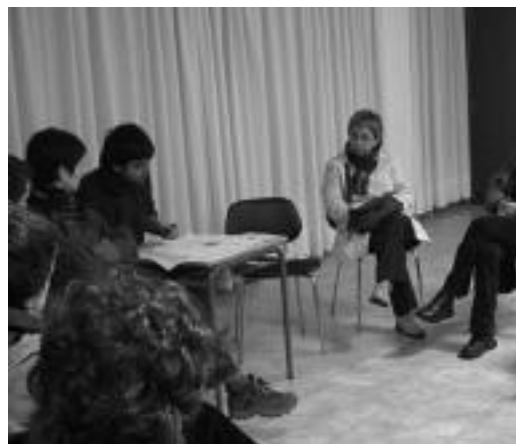
Amezketako Euskara Elkarte, bileretako batean. N. URBIZU