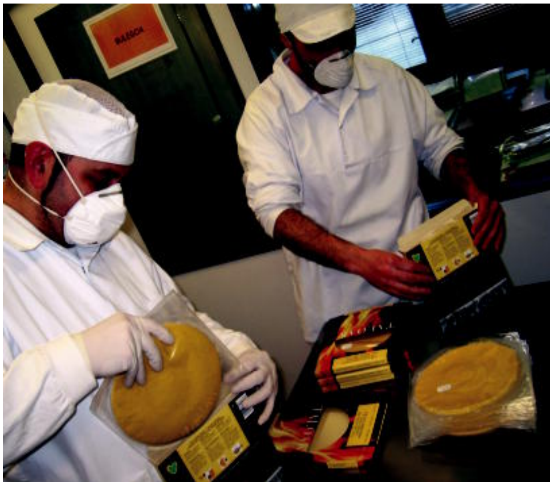
Leitzako Talotegia lantokiko bi langile, egindako taloak ontzietan sartzten.

PROZESUA ▶ Guztia bertan egiten dute, eta «berebiziko garrantzia» eman diote lehengaiari ▶ 7