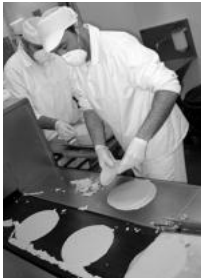
Orea sartu eta taloak eginda ateratzen dira makinatik. Hortik ontziratzera daramatzate. J. ASTIBIA