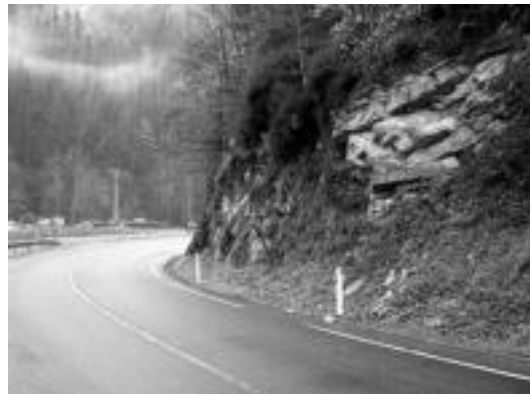
N-130 errepidea, Txaramako noranzkoan, ubegia igaro ondoren. Alboan dauden haitzak erortzeko arriskua dutela adierazi dute.