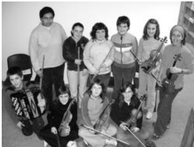
Elgoibarko lehiaketan parte hartu zuten Haitzbiki —ezkerrean— eta Haitzbakar taldeko partaideak, bere instrumentuekin. HITZA