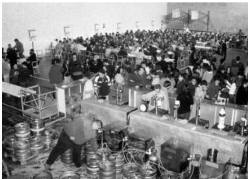
Jende andana bildu izan da aurreko bi edizioetan: Alegiako frontoian orduan ere afaria egin zuten. HITZA

Heineken garagardo etxeak jarriko ditu aurtengo zortzi markak, frontoian eskainiko dituzten jakiak bultzatzeko