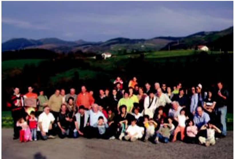
Leaburu-Txaramakoak eta Larresorokoak, elkarrekin, sagardotegiaren kanpoaldean.

60 bat lagun elkartu ziren egun-pasa egiteko. Musika, dantza saioak eta jai giroa ez ziren falta izan. «Kasualitatez, gainera, Iparraldeko abesba-