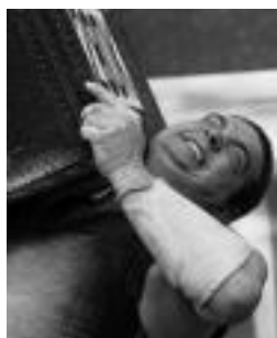
Perurena marka bila.

Leitzarrak duela bi hilabete jaso zuen 220 kiloko. Orain 5 kilo gehiago erantsita, marka hobetzeri doa, hain justu ere 23 urtez behokoetan marka onena ezartzeri. Aurreko egunetan, asteazkenean, azken probak egin eta gaur eginen du baliozko altxaldia Sakoneta kiroldegira bertaratu diren zaletuen aurrean.