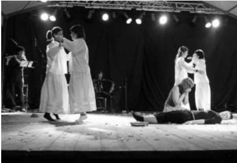
Ikuskizun bikaina eskaini zuten atzo Beotibarren poesia errezitatzen jardun zuten ikasleek. IMANOL GARCIA

Poesia errezitaldi «hunkigarria» burutu zuten atzo, Beotibar pilotalekuan, Laskorain ikastolako, Orixe institutuko eta Hirukide ikastetxeko ikasleek