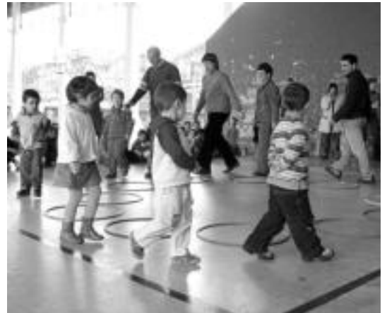
Guraso, ikasle eta irakasleak, atzo, jolasean. I. GARCIA

Jokoak eginez bukatu zuten atzo astea. Guraso, haur eta irakasleek hartu zuten parte giro ederrean eskolako frontoian antolatutako jolasetan. «Gurasoek gozoz hartu dute parte ekitaldietan», nabarmendu du Aiestaranek. Astean zehar izandako gonbidatuekin ere «oso gustura» zeuden eskolakoak.