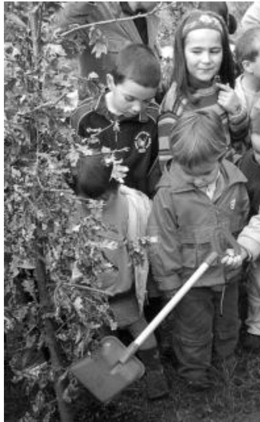
Pala eskuan hartuta, haritzak landatu egin zituzten haurrek. HITZA