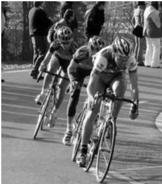
Leaburuko igoera borrokatua izan zen, talde sendoenen artean. n. u.