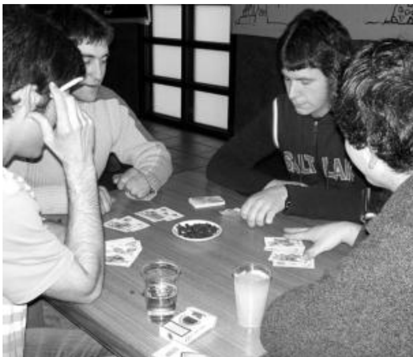
Mus Txapelketako finalurrekoak jokatzen, atzo Urepel gazte elkartearen. ESTI EZEIZA

«Giro alai eta herrikoia» izan da nagusi asteburu honetan, Urepel gazte elkarteak antolatzen dituen jaietan