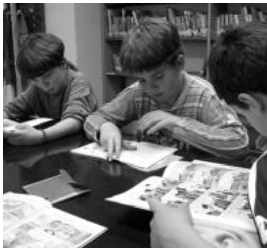
Hiru gazte irakurtzen Berrobiko liburutegian. I. TERRADILLOS

Hain zuzen ere, berrikuntza horiek behar zituzten, besteak beste, Euskadiko liburutegi sistema nazionala osatzen duten liburutegien sarea on line proiektuan egon ahal izateko. Berrobiko liburutegia sare horretan egongo bada ere, oraindik ez da erabiltzen hasi, baina