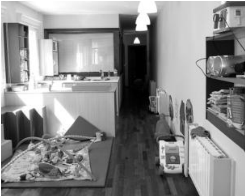
Haur eskolak txoko ezberdinak ditu: haur bat jostailuekin behatzen ari da. HITZA

0 eta 2 urte bitarteko sei haur daude jada hezitzaileekin, berez hamar umeentzako da Haur Eskola