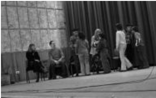
Bertso eskolakoeekin Lasarte, bere omenaldi egunean. JAIONE ASTIBIA

Lasarteren bertsoak kantatuz, bihar mahai-ingurua eginen dute erakusketa aretoan