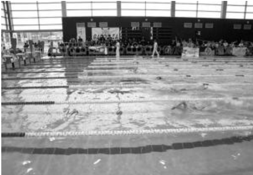
Jende asko bildu zen asteburuan Usabal kirolegira igerilariak animatzera. IMANOL GARCIA

Tolosaldea IKTKo hainbat igerilari daude taldean; Usabal kirolegian jokaturako Espainiako Kopan lortu dute igoera