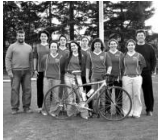
Tolosako txirrindulari talde berria Berazubiko zelaian. INIGO ASENSIO