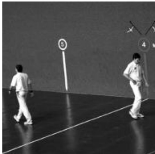
Belloso-Oteiza bikoteak senior mailako partida jokatu du. N. URBIZU

Hilaren 25-26an jokatu du Aurrera-Saiaz eskolak euriagatik atzeratutako kanporaketa