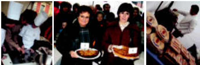
750. urteurreneko logo tikiak egiten. J. A.

Eguraldi umela izanda ere, erleen antzera gozo bila ibili direnek aurkitu dute nahiko aukera azokan