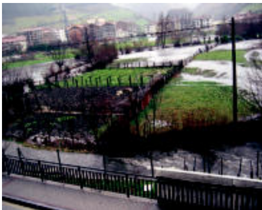
Urak Usabalen beheko solairuko tarima eta tatamiak hondatu ditu; Leitza Landako alorrak urez bete ditu uholdeak. I. GARCIA / J. ASTIBIA