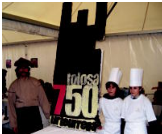
Urteurrena. Tolosaren 750. urteurrena gogoan izan zuten Gorrotxategikoeek, eta txokolatetzko bi metroko logoa egin zuten. J. ASTIBIA