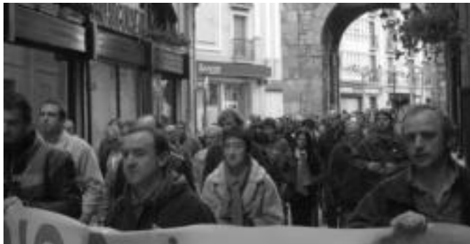
Ostegun eguerdian LABek Tolosan deitutako manifestazioaren irudia. NOELIA LATABURU

Bidea, ordea, ez da samurra izango. Izan ere, interes handiak daude gauzak dauden bezala iraun dezaten. Estatuak bere esku dituen arma guztiak erabiliko ditu egoera hau ez gainditzearren, eta zentzu honetan ulertzen dugu, besteak beste, espetxe politika gogortzearen bidean hartzen ari diren neurri basatiak.