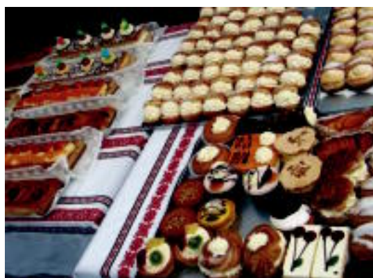
Berezitasunak. Saizarrekoek frutaz betetako hostorea, Ezeizakoek teilak eta zigarriloak, eta Gorrotxategikoeek bonba bereziak... J. ASTIBIA