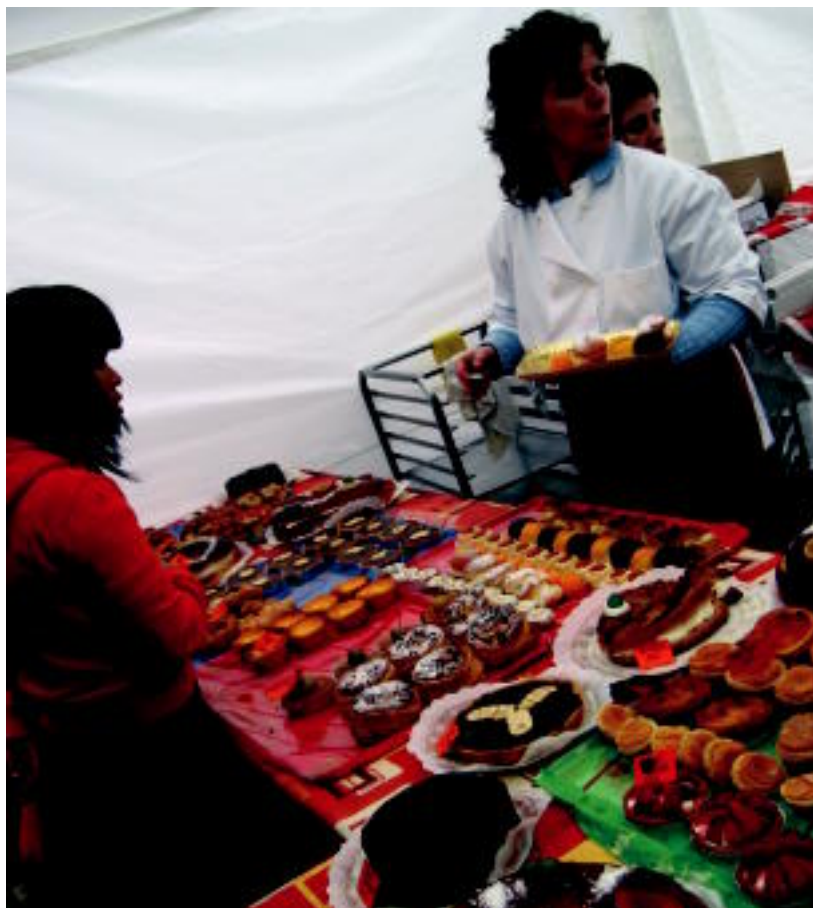
Erakusleiho. Gozogileen esanetan, azoka euren lanaren erakusleiho egokia da: «Bertan ezagutzen gaituzte, baina beste eskualdeetatik ere jende asko etortzen da egun honetan, eta baliagarria da oso». J. A.

LEHIAKETA ▶ 15 lagunek hartu zuten parte sagar tarta lehiaketan; Astiazaranek eta Iraolak jaso zituzten lehen bi sariak ▶ 4-5