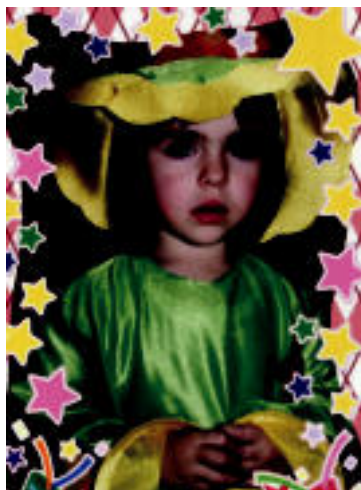
URTE ASKOAN Narrea Goñi Garmendia (Alegia). Atzo 3 urte gure ebeko erreginak. 3 mugu potolo asko maite zaitugunon partetik.