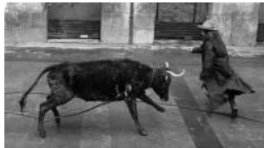
Paseak. Zezenaren aurrean erakustaldiak egin zituzten batzuk. i. g.