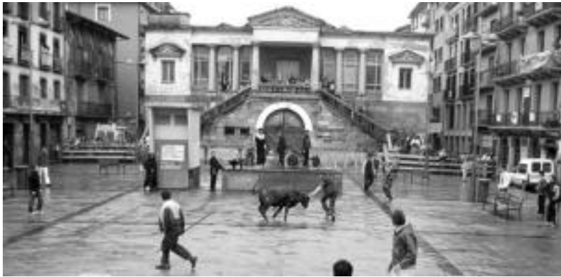
Plaza Berria. Zerkausiko lanak direla eta, aurten sokamuturra lekuz aldatu dute. i. g.