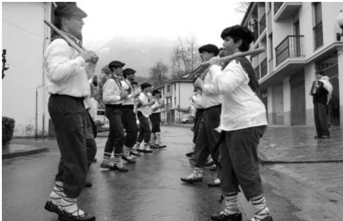
Aurten bi mutil berrik dantzatu dute. 20 bat dantzari aritu ziren orotara igandean, poltxeroez gain. N. URBIZU

Igandean 20 bat lagunek dantzatu zuten, eta atzo bi talde aritu ziren