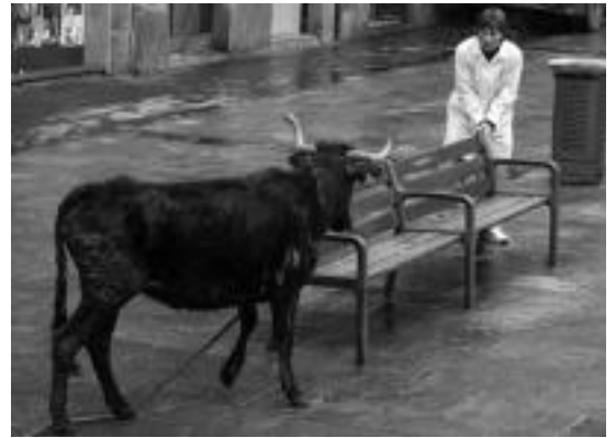
«Ezetz harrapatu». Farolak, eserlekuak... Edozerk balio du. i. g.