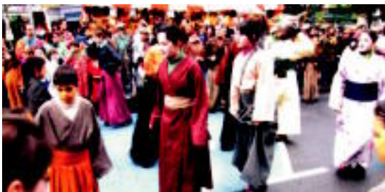
Atsedena. Samurai eta Ninja talde honek ez zuen hutsik egin Inauterietan. I. TERRALLOS