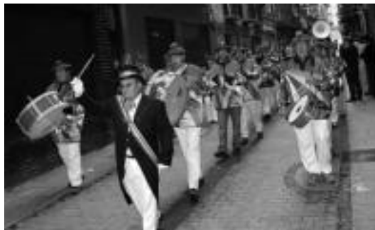
Arco Iris txaranga lerro zuzenean desfilatatu zuen. J. ASTIBIA