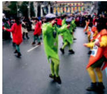
Txiribitu. Eusko labela aitzaki hartuta Tolosako babarruna, Ibarra-ko piperra, Ibizabalgog gazta eta euskal tomatea, guztiak batera, aritu ziren atzokoan. I. TERRALLOS