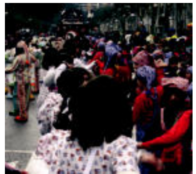
Kazkabarra. Ohetik jaiki berrikan hasi ziren Kazkabarrako gasteak dantzan, eta ez nola-nahi, gainera; euskal doinuek harira, saio bakaina egin zuten. I. ARRIENO