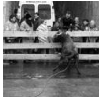
Farolan bueltaka. Ederki erabili zuen ninjaz jantzitako gazteak farola lau hankakoarengatik defendatzeko, baina zezenak ez zion uko egin borrokari, eta plazatik atera zuen. i. g.