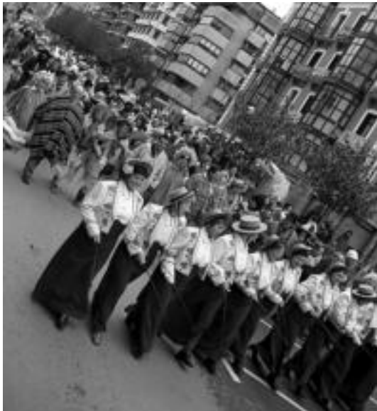
Errozieroak, txantxoak, pailazoak, arranderak... lufi-lalai! J. ASTIBIA