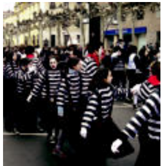
Kirikiño. Mimoak ere ederki igarri zuten dantzan, sorpresa eta gurri. Izan ere, ikuslearen hasieran kaxa batetik mimo bat atera zen. I. ARRIENO