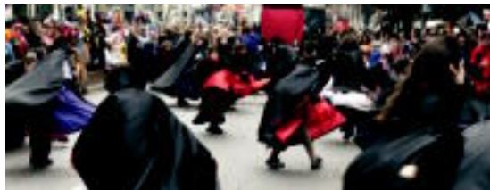
Tientek. Munstroek ikusleak izutu zituzten; emanaldi bakaina eskaini zuten. I. SESASO

Samurai eta ninjak, eusko label produktuak, munstroak, mimoak, raperoak eta ohera doazenak irudikatu zituzten atzo Ibarra eta Tolosako sei aisialdi taldeek