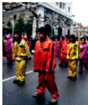
San Bernardo. Doinu dantzagarriak izan ziren nagusi talde honetako partaideek, raperoz mozturorik, eskaintako dantza saioan. N. LARRUGO

Dantza saioak goizean ikusteko aukera izan ez zuzenak arratsaldean ere izan zuten horretarako bera. Izan ere, aisialdi talde guztiak zuzenetan izan eta gero jarraitu zuten dantzan guztiok saioak korrikora nekari aurreratu egin.