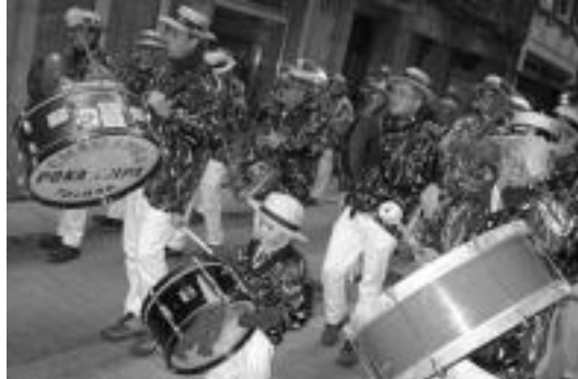
Poca Tripa txaranga gazte-gaztetandik hasi da txiki hau. J. ASTIBIA