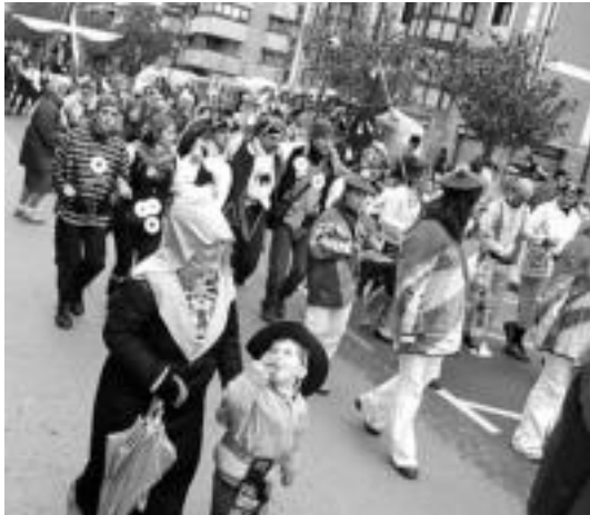
Adin guztietakoek parte hartzen dute xexenatarako kalejiran. J. ASTIBIA

Elkarteetako txarangek egunero-egunero egiten dute Plaza Zaharretik zezen-plazarainoko bidea