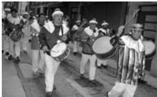
Tolosano txaranga Korreo kalean gora, atzo kalejiran. J. ASTIBIA