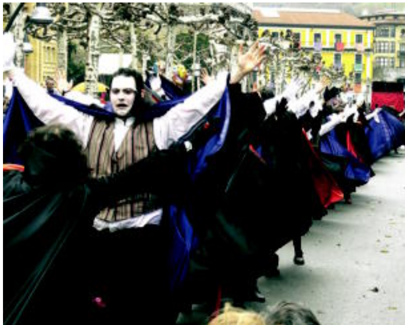
Ttentek aisialdi taldeko munstroek izua eragiten astindu zituzten gerriak. I. ASENSIO

GAIK ▶ Samurai eta ninjak, eusko label produktak, munstroak, mimoak, raperoak eta ohera doazenak irudikatu dituzte Tolosako eta Ibarako sei taldeek ▶ 4-5