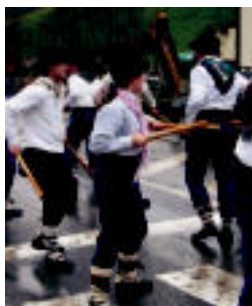
Talai-dantzariak. N. URBIZU

Herriko neska-mutilak aritu dira bi egunez ▶ 7