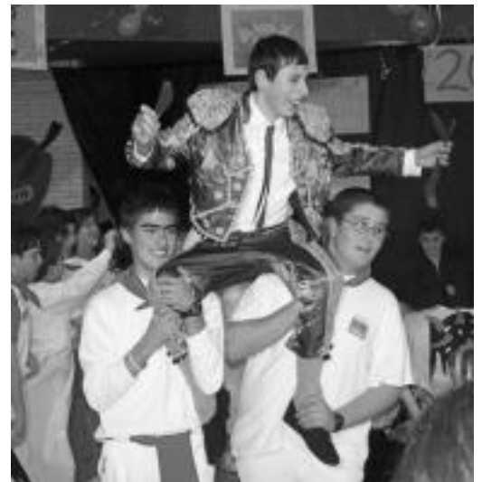
Anoeta-Irura. Ederki gozatu eta nahiko barre egin zuten Anoetako Herri Ikastolako eta Irurako Ikastolako ikasleek Inauteri Jaialdirako prestatutako eskeb barregarriekin. HITZA