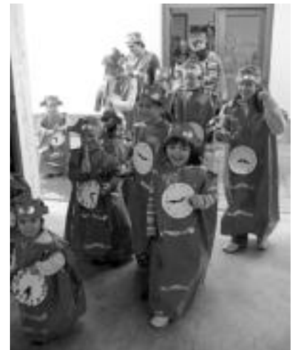
Albizar. Erloju mozorrotuta atera ziren eskolakoak. Kalejira egin zuten ondoko frontoian ikasle eta gurasoek beraiek jotako musikarekin: trikitixa, bonboa, panderoak, makilak... I. GARCIA