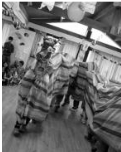
Ikaztegieta. Ahotik txinpartak bota beharrez eta Txinatik bertatik etorritakoa, herensuge luze-luzea azaldu zen festara; eskolako bikienetatik hasita, kozkorrenek egindako koreografiak osatzen. J. A.