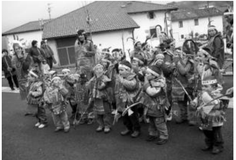
Abaltzisketa. Herria indio talde batek hartu zuen beretzat atzo arratsaldean. Gezi eta aizkorak eskuan, luma gorri-urdinak buruan, euriaren dantza eginez ibili ziren herriko ataritan barrena, gero eskola atarian ezarri zituzten tipietan atseden hartuz. JAIONE ASTIBIA

Gaur oraindik horretan ibiliko dira beste hainbatetan, eta ondoren oporralditxoa hartuko dute.