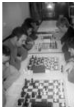
Tolosa-Ibarra xake taldekoak, arriboko irudian. HITZA

okerrago doaz, hirugarrenen galdu baitute jarraian. Beasaingo Alfili taldearekin galdu zuten oraingoan.