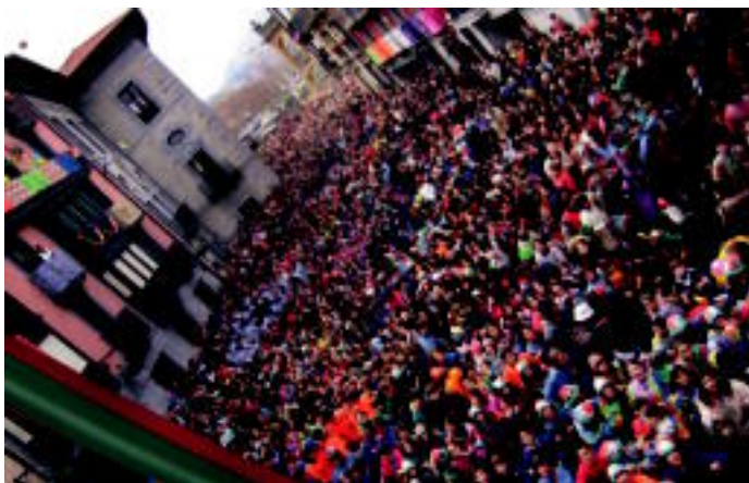
Jendetza bildu zen Plaza Zaharrera txupinazoiari harrera egiteko; Nafarroako zubian eta Zerkausi inguruan ere jende asko elkartu zen, atzo, festei hasiera emateko. N. LATABORU