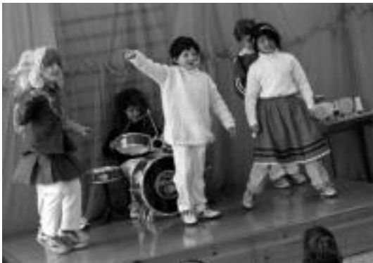
Ibarra. Goiz-goizetik hasi ziren festarekin Uzturpen. Gela bakoitzeko ikasleek eurek prestatutako eskebak antzeztu zituzten —irudian karaokea—, gainerako ikaskideen txaloak eraginez. Ondoren, herrira jaiatsi ziren, hamaiketako egitera. J. ASTIBIA