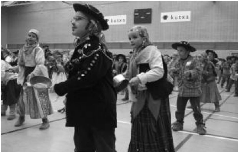
Villabona. Euriak jaialdia zapuztuko zuenaren beldur, Olaederra kiroldegian egin zuten Villabonako ikastetxeek jaialdia. Jendez gainezka zeuden harmailak: hainbat eta hainbat guraso bere argazki eta bideo kamerekin. Haurrek, bitartean, irakasleek lagundurik ikuskizun bikaina eskaini zuten kantxan. I. GARCIA