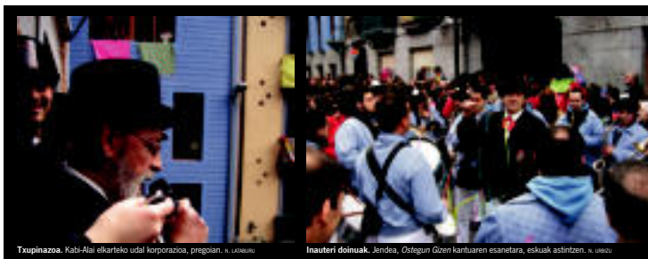
Txupinazoa. Kabi-Alai elkarteak udal korporazioa, pregoian. N. LATABORU