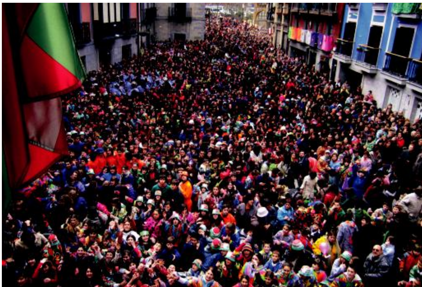
Jendetza bildu zen Plaza Zaharrera, txilaba eta jantzi koloretsuak soinean, txupinazoa noiz jaurtiko zain. Egun zoroak hasi dira. N. LATABURU

OTSAILAK 23 ▶ 1981eko estatu kolpe saiakeraren parodia egin eta gero bota zuen suziria Kabi-Alaiko udal korporazioak ▶ 4-5