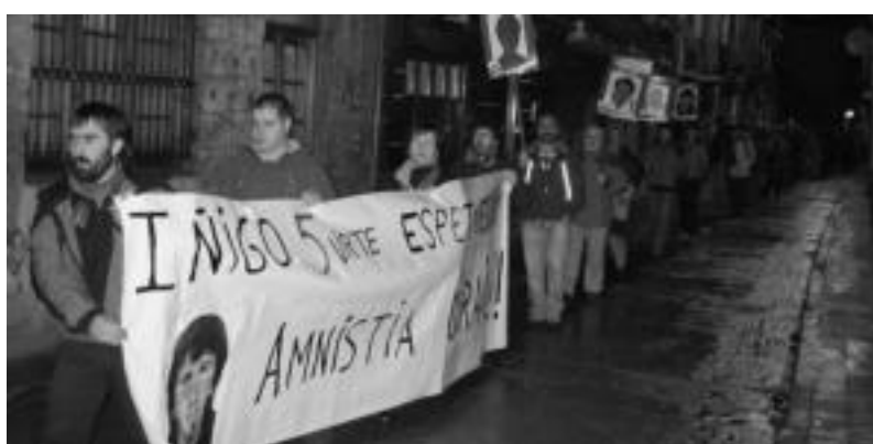
Guridiren egoera salatzen atzo egindako manifestazioaren une bat. I. GARCIA

Prokuradoreak eskatutako zigorrak behin betiko ezarri dizkiete; Frantzian bizitzeko debekua ere jarri diete