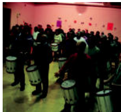
Danborrada. Harenegan egindako entsegu izan zen azkena larunbatetik aurrera. «13»

Mozorroa. Berriek diseinatutako Samurri eta Ninja moztoreak jantziak dituzte dantzarako. Partaideak. 110.