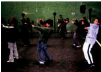
Txiribitu. Eusko Labela aitzaiki, entsegu ugari burutu dituzte Txiribitukoek larunbatero. «12»

Tolosako eta Ibarroko 6 aisialdi taldek dantzaldien azken entseguak burutu dituzte; danborradakoak ere Bandarekin batera aritu dira; gutzia prest dago, beraz, gaur jai erraldoiari ongetorria emateko