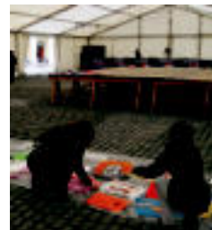
Karpa dekoratzen. I. GARCIA

8 talderen txosnak hartu ditu, Euskal Herria plazan; ekintza asko aukeran ▶ 3