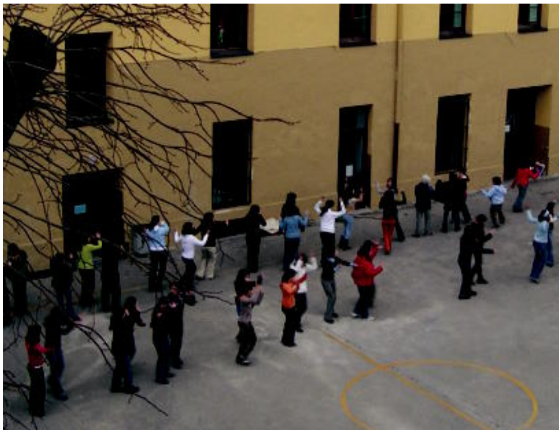
Kazkabarra aisialdi taldekoak, asteburuan, Laskorain Ikastolan dantza entseatzen. HITZA

SUZIRIA ▶ 12:00etan jaurtiko dute, udaletxetik; eskualdeko herrietan ere bada zer ospatzerik ▶ 3-5