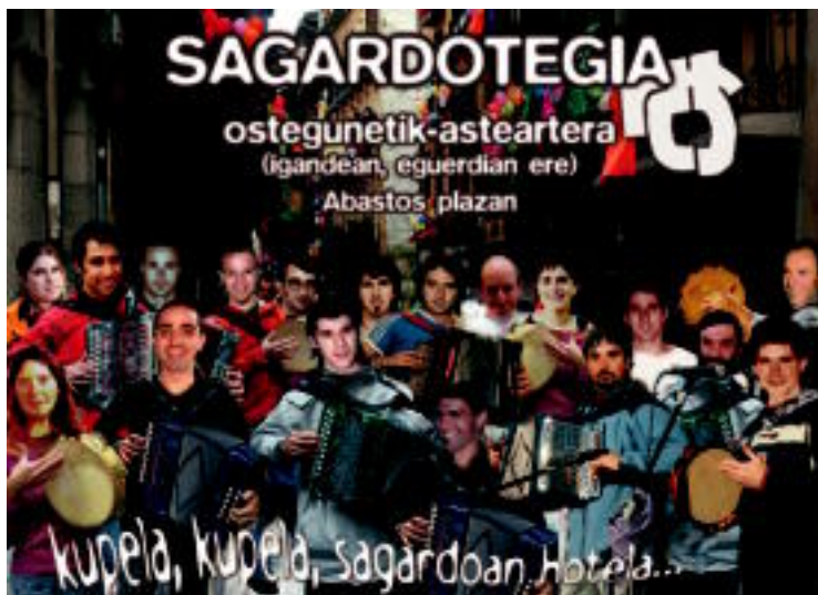
INAUTERIETAN ERE, EUSKAL PRESOK, ETXERA, TOLOSARA Zatoz sagardotegira, gure presoen alde txotx egitera eta ekonomikoki laguntzera. Ostegunetik asteartera iluntzeetan irekita, eta igande eguerdian ere bai.

Askok eta askok hitz hauek irakurtzen dituztenerako jai giroan murgilduta egongo dira edota, kirioak dantzan, jai erraldoiak iragartzen dituen txupinazoaren zain. Haatik, aurretik ditugun sei egunak borobilak izan daitezten eta guztia ondo irten dadin herritarren parte-hartzea ezinbestekoa da. Eta aurten ere erantzun dute, ez nola-nahi, gainera. Erakuslehoak, eraikinak, kaleak...—argazkian, Alde Zaharreko Letxuga kalea— Guztia prest dago festaren hasierarako. Honenbestez, hitz bi esatea baino ez litzateke faltako: «Ondo pasa tolosar eta kanpotar guztiok eta Gora Inauteriak 2006!» NOELIA LATABURU