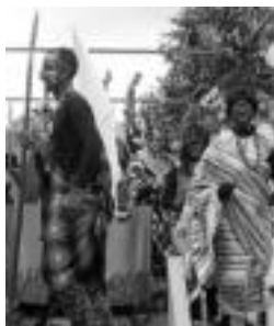
Edozein itxura egokia da.

08:00. Diana, Tolosako Musika Bandarekin. 08:45. Herriko txistulari