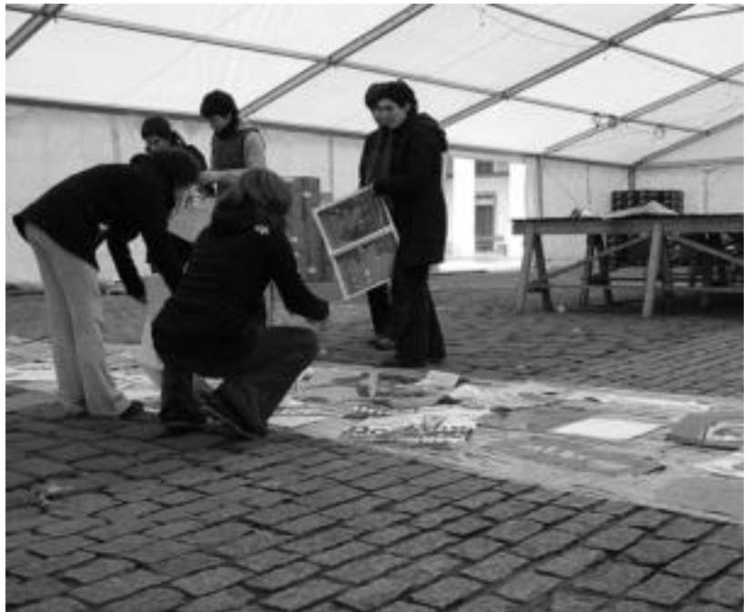
Talde bakoitzeko kartelak erabili zituzten atzo karparen dekorazioa burutzeko.

Egunero 18:00etan irekiko dute txosnagunea, gaur izan ezik, eguerdirako zabalik egongo baita. 06:00 eta 06:30-ak ingurura arte musika izango da karpa erraldoian eta ordu erdi beranduago itxiko dute. Asteartean, azken eguna, 02:30 estaliko da. Batzordekideek inauterizale guztiak animatu dituzte txosnagunera azaltzera. Giro aparta egongo dela ziurtzat jotzen dute.