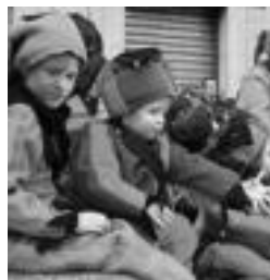
Txikienak ere, bixi-bixi! L. MONTES