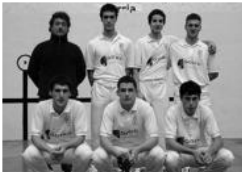
Aurrera taldeak egin ditu aurtengoak txapelketan. A. C./ARGAZKI PRESS