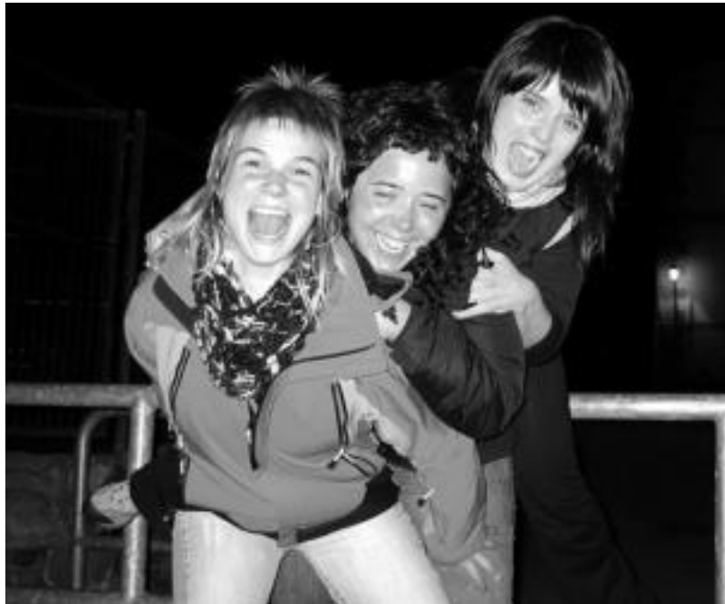
Amaiak, Olatzek eta Garbiñek ez dute gehiegirik behar barre egiteko. N. URBIZU

Beste bi talderekin lehiatu dira, eta 7 proba egin behar