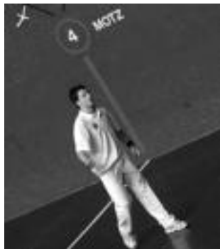
Belloso oso ongi aritu zen leanean. N. U.

Final-laurdenetarako sailkatuta, Bidegoingo taldeak Lemoaren aurka jokatu du datorren martxoaren 12an