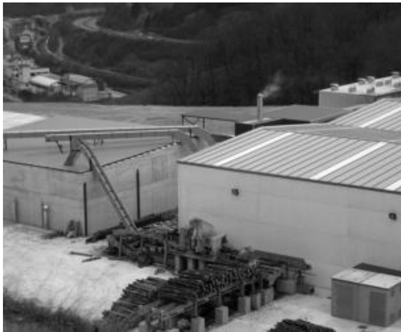
Altzo Azpin dagoen zerrategian lanean jarraitzen dute. N. URBIZU

Altzoko bizilagun baten salaketari arrazoia eman dio Donostiako epaitegiak, obrak egiten hasi zirenetik «legez kanpokoak» direla arrazoituta