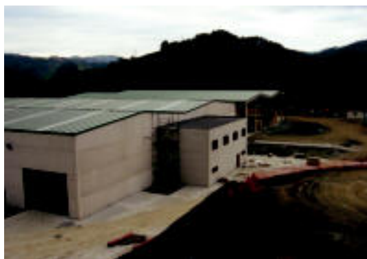
Altzo Azpi auzoan dagoen zerrategia. N. URBIZU

ERANTZUNA ▶ Urbizu enbalaketak enpresak eta Udalak deklaraziorik ez egitea erabaki dute oraingoz ▶ 5