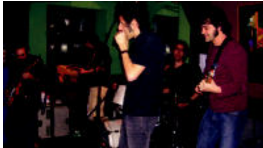
King Bee taldeak kontzertu indartsua eskaini zuen. HITZA

▶ HITZAK ez du bere gain hartzen egunkarian adierazitako esanen eta iritzien erantzukizunik.