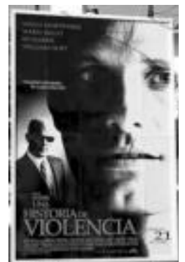
Film hau Sitgeseko (Katalunia) Zinemaldian bota zuten.

Thriller dramatiko honetan, besteak beste, Viggo Mortensen, Maria Bello, Ed Harris, Wi-