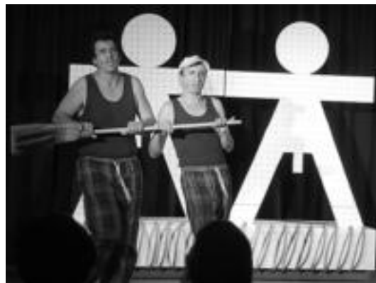
Gai batekin edo bestearekin, umorea b(eh)arra-b(eh)arra.