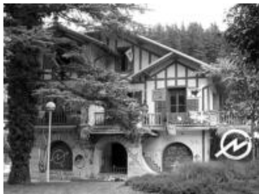
Urdapilleta egun okupatuta dauka Onddo Gazte Asanbladak.

Egun Onddo Gazte Asanbladak eraikina okupatuta du. Udala eta Onddo hainbatetan bildu dira Gaztetxearentzat leku bat topatzeko. Herenegun egindako osoko bilkuraren ondoren ere bildu ziren bi aldeak. Bileraren emaitza lan talde bat osatuko dutela izan da eta alde bakoitzetik hiru kide bidaliko