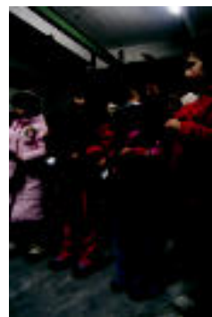
Entseatzan, atzo. N. URBIZU

Kaldereroak Anoeta, Irura, Ibarra, Tolosa eta Zizurkilen ▶ 5