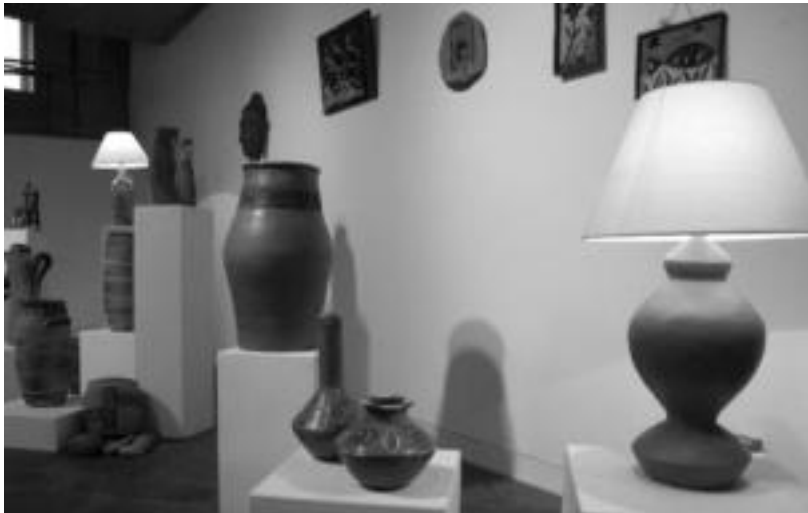
Kultur Etxeko zeramika tailerrekiko ikasleek egindako erakusketa, Aranburu Juregian. JOXEMI SAIZAR