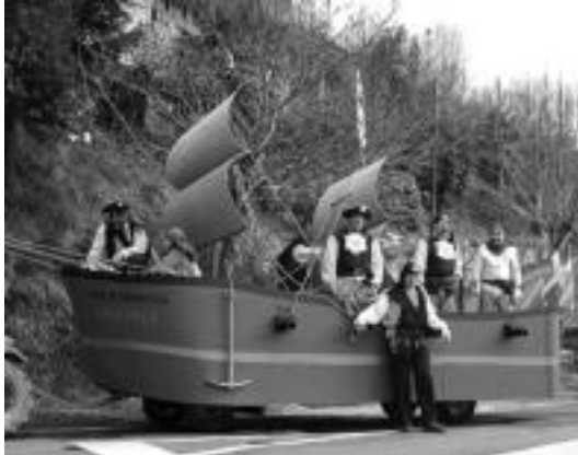
lazko Inauterietan ikusi ahal izan zen gurdietako bat. HITZA

11:00. Txistulariek lagundurik, agintariekin eta dantzariekin Meza Nagusia. Ondoren, hamaiketakoa. 12:00. Dantzariak kalean ibiliko dira puska biltzen eta gurdi, mozorro eta gainerakoak kalez kale txaranga lagundurik. 13:00. Lizartzako Inauteri-dantzak herriko plazan. 14:00. Inauteri bazkaria herriko pilotalekuan. Ondoren. Txaranga, dultzainero, jokua, dantza-soka, zozketa, sariak... 20:30. Plazan Ijittoa errez Inauterien amaiera.