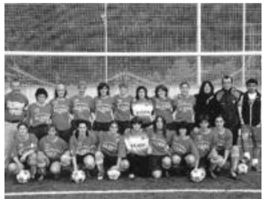
Garaipena behar dute Tolosako neskek aurrera egiteko. HITZA

Bi partidetan porrot egin eta gero lorturiko azken garaipenak esperantzaz bete ditu