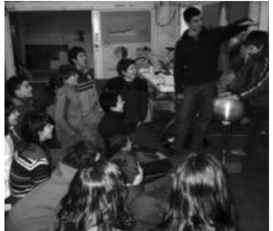
Jesusen Bihotzako ikasleek ederki pasa zuten erakusketan. HITZA

Ikusgai izango da hilaren 20ra arte, 10:00etatik 13:30era, eta 16:30etik 19:00etara bitartean.