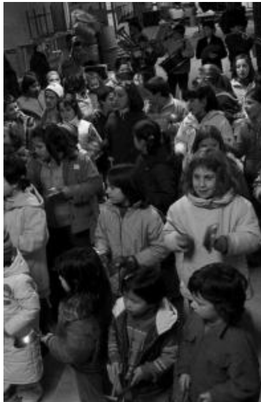
Iruako Kulturunean azken entsegua egin zuten atzo. N. URBIZU

Zizurkil. Gaurkoan, agudo aterako dira Zizurkil. Bazkaldu ondoren, 15:15ean, Pedro Maria Otaño eskolako ikasle nahiz lagunak aterako dira, eta herrian zehar ibiliko dira; entzulek Kaldereroen koplak aditze-ko aukera izango dute.