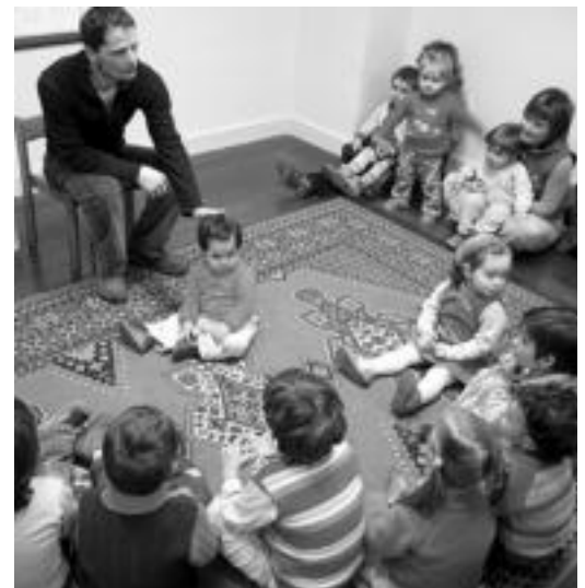
Adi egon ziren haurrak ipuin kontalariari entzuten. I. TERRADILLOS