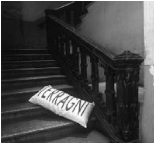
Via Cantu, 62. Giuseppe Terragni Via Cantu-ko 62an hil zen. Erokeriak jota, bere arrebarren bila zihoala eskaileretan erorita zendu zen, buruan kolpea hartuta. Burukoak lagun izan zezakeen. PACO POLAN