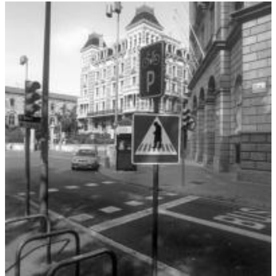
Bartzelonako Balmes eta Gran Via de la Corts Catalanes-en arteko bidegurutzea. Bidegurutze honetan hil zen Antoni Gaudi, tranbiak harrapatuta. Seinaleak istripua ekiditu nahi du. PACO POLAN