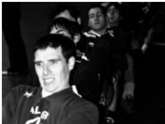
Gatika izan zen lehena Ibarra egindako saiakeran.

Federazioak HITZARI azaldu dionez, «egoera larrian aurkitzen da sokatira, eta kirolari bultzadaxo bat eman asmoz» antolatu dituzte saioak egunak. Lehena Ibarra izan bazen, bigarrena Araban egingo dute igande honetan, eta Bizkaian eta Nafarroan egiteko asmoa ere badute. Sokatira arindu eta ikusgarriago egin nahi dute zaletasuna areago-