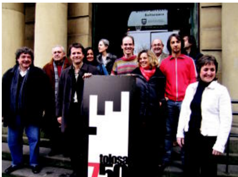
Herriko musikariek egindako lana nabarmentzeko baliatu nahi dute urteurrena Fundaziokoek. N. LATABURU

BEREZIA ▶ «Kontzertu itzela» iragarri dute uztailerako; Berazubi futbol zelaietan izango da ▶ 3