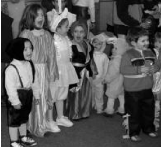
lazio Inauterietan ederki igaro zuten gazteboek. HITZA

Egun horretan, Aldin kultur eta kirol Elkarteak eta Guraso Elkarteak antolatuta, 17:30ean herriko dantzari txikien saioa izango da, eta ondoren herriko txikienek txokolatada hartuko dute Urepele gazte elkartearen,