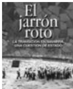
Liburuaren azala. HITZA

La vieja herida (Txalaparta, 2002) izan zen historia alorreko bere lehen argitalpena. Hartan, 1512ko Espainiako konkistatik foru hobekuntza bitarteko