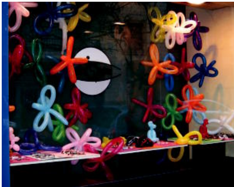
Koloretako puxikak, maskarak, txilabak, konfetiak, serpentinak... ikus daitezke dendetan. L. MONTES

TOLOSA ▶ Gero eta egun gutxiago falta dira Inauterietarako; herriko dendetako erakusleihoak ere kutsatu dira dagoeneko festa giroaz