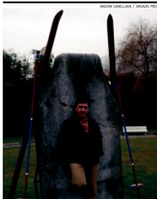
ANDONI CANELLADA / ARGAZKI PRESS