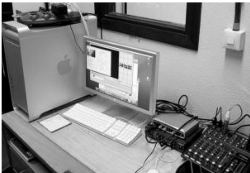
Xaguxar irratia maneiatzeko ordenagailua eta kontrol mahaia erabiltzen dute.

Eskolan egiten dutena herrian zabaltzen dute ikasleek aldizkari eta irratia berriaren bitartez