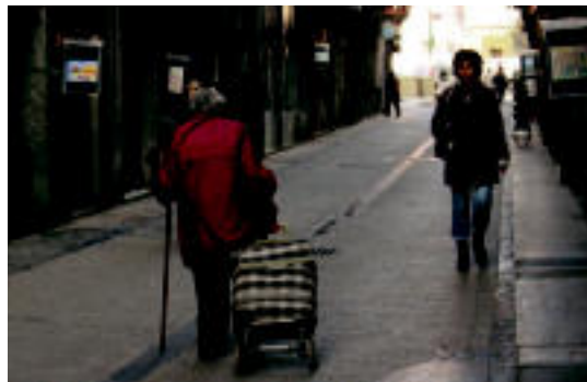
120 marrazkitik gora ikus daitezke Alde Zaharreko erakusleho eta txokoetan; Kaldereroen bueltan kenduko dituzte. L. MONTES