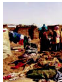
Kanpamenduetako bat, uholdeen ondoren. HITZA

Tindufeko kanpamenduetan, uholdeek «inolako babesik gabe» utzi dituzte 12.000 familia; premia larria da ▶ 7