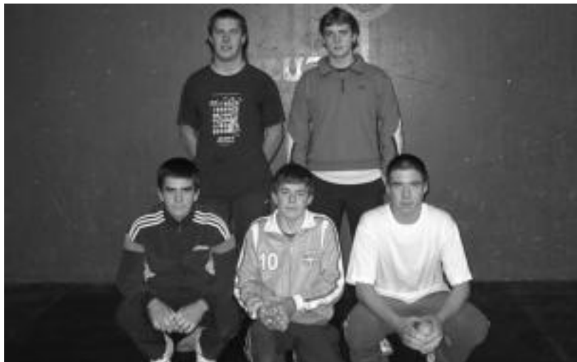
Aste honetan Zazpi-Iturriko Sukiak, Olaetxeak eta Arzelusek jokatu dute txapelketetan, besteak beste. N. U.

Garaipen errazak alde batetik eta porrota nabariak ere jaso dituzte Aurrera-Saiazekoek eta Zazpi-Iturrikoek