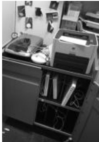
Ohiko tresneria eta teknologia modernoak erabiltzen ikasi dute Muñagorri eskolako ikasleek. I. TERRADILLOS