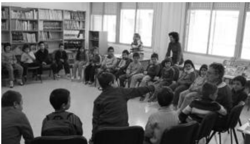
Irakurzaletasuna bultzatu eta idazlea zuzenean ezagutzeko saioa egin zuen Arrietak LH2ko ikasleekin. i.g.