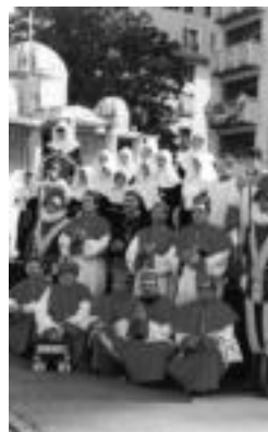
Berazubiko karroza, iaz. HITZA

Epaimahaia Tolosako Udalen eta lehiaketan parte hartuko duten ordezkarien artean adostuko dute. Zazpi partaide izango ditu: Festa Batzordeko ordezkari bat, Tolosako Udaleko ordezkari bat eta lehiaketan parte hartuko duten bost ordezkari. Dagoeneko izena eman duten talde guztiek dirua jasoko dute, parte hartzen duten mailaren arabera. Aipatutako kopurua jasotzeko