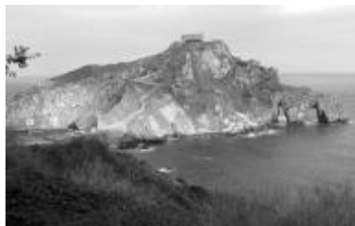
Gaztelugatxeko baselizatik abiatuko da ibilaldia. HITZA