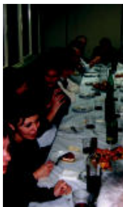
Kantu afaria, ostiralean. HITZA

BERASTEGI ▶ Aldizkari eta irrati berriari esker, eskolan egiten dutena herrira zabaltzen dute ikasleek ▶ 6