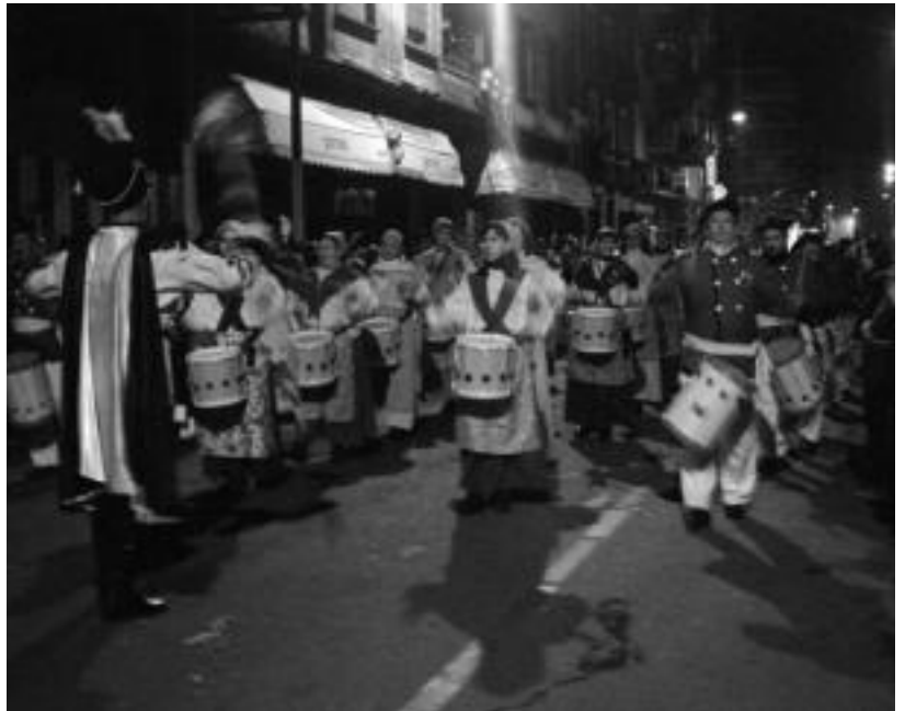
Iazko danborradaren ostean, «arintasuna» lortu behar zela erabaki zuten. IRATXE ETXEBESTE

Mulanboren eta Legazpiko eta Bilboko taldeen doinuak danbor hotsekin uztartzea erabaki du Festa Batzordeak