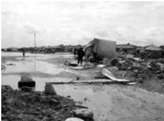
Otsailak 27 kanpamenduko irudi bat uholdeen ondoren.

«Inolako babesik gabe» egonik, «guztiaren beharra» dagoela azpimarratu zuen berak ere. «Hori dena erosi egin behar da eta azkar. 0 gradutik be-