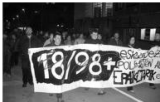
Villabonan egin zuten 18/98 auziaren aurkako manifestazioa. i. g.

Tolosan nahiz Leitzan, Bilbora joateko garraioa antolatuko dute larunbatean