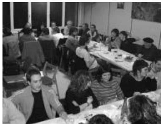
Kantu afarian giro polita sortu zen. HITZA