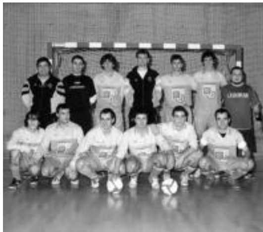
Larunbateko garaipenak emaitza txarrei eman die amaiera. HITZA